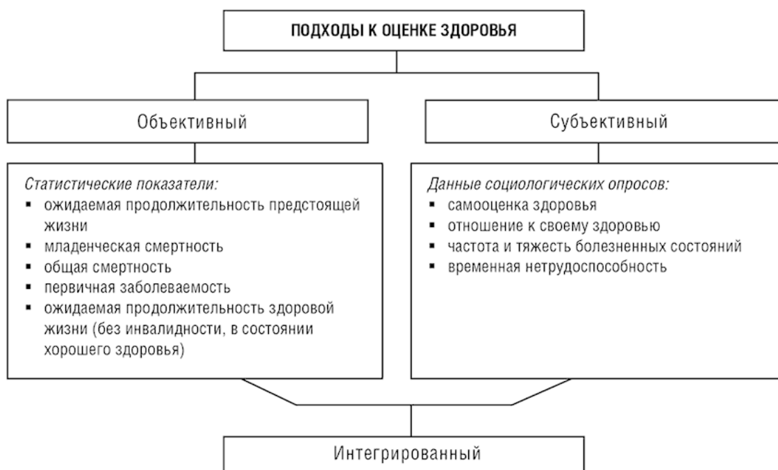
Рис. 1.2. Подходы к оценке здоровья и соответствующие им показатели

В международной практике принято выделять два подхода к оценке здоровья: объективный и субъективный (рис. 1.2). Объективный подход – оценка здоровья внешним наблюдателем, экспертом с помощью специальных инструментов в рамках специализированных обследований (данные официальной статистики). Объективно состояние здоровья оценивается на основании анализа демографических показателей, таких как коэффициенты смертности по возрастам и причинам смерти, ожидаемая продолжительность жизни и др.; медицинской документации и показателей, например, заболеваемости острыми и хроническими болезнями, обращаемости в медицинские учреждения, сведений о проведённых профосмотрах и диспансеризациях и т. д.