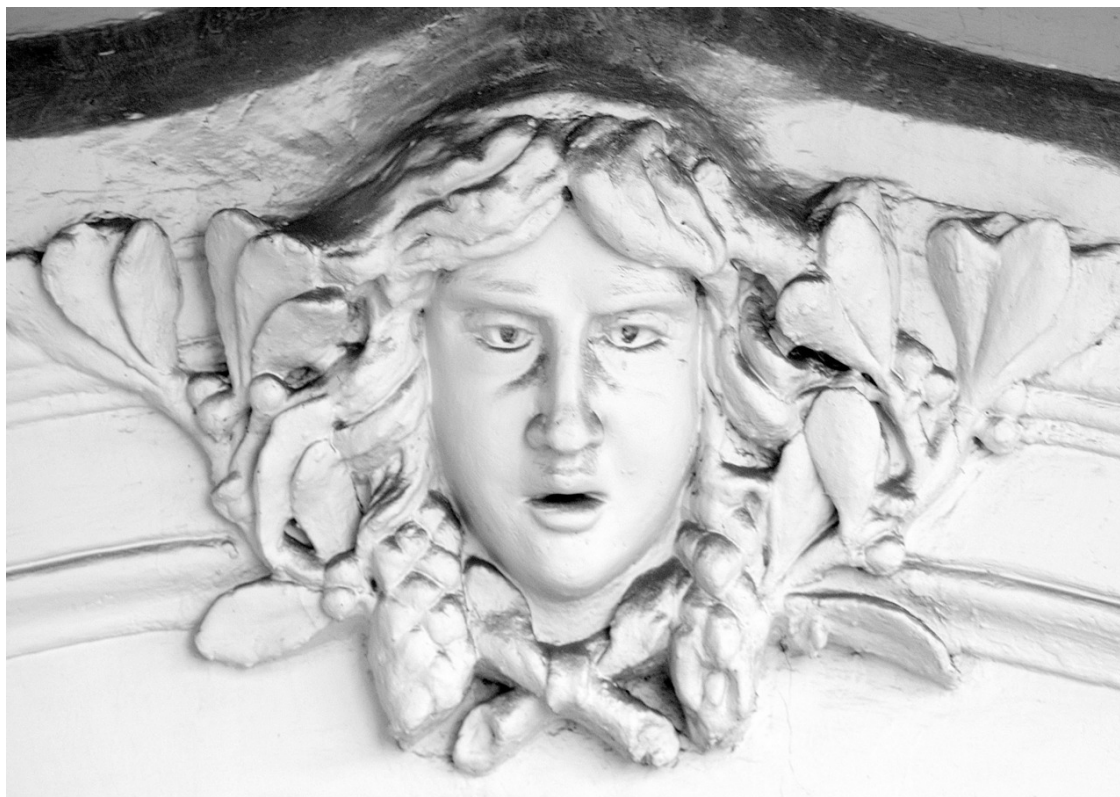
«Каменные лица Ростова»