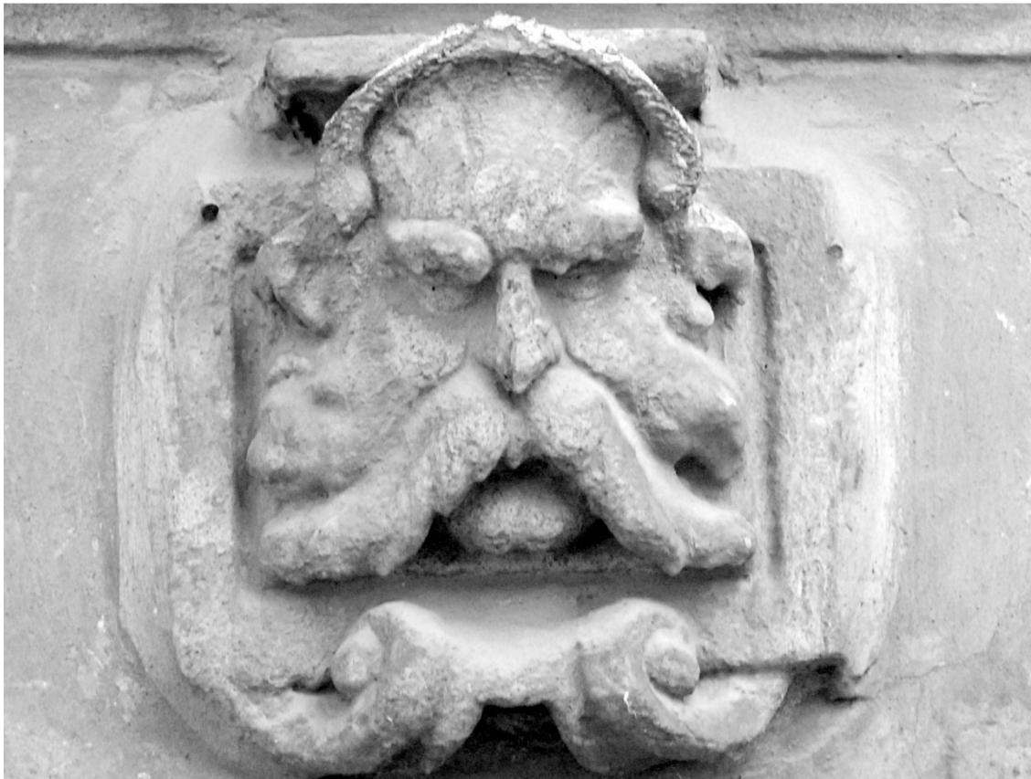
«Каменные лица Ростова»