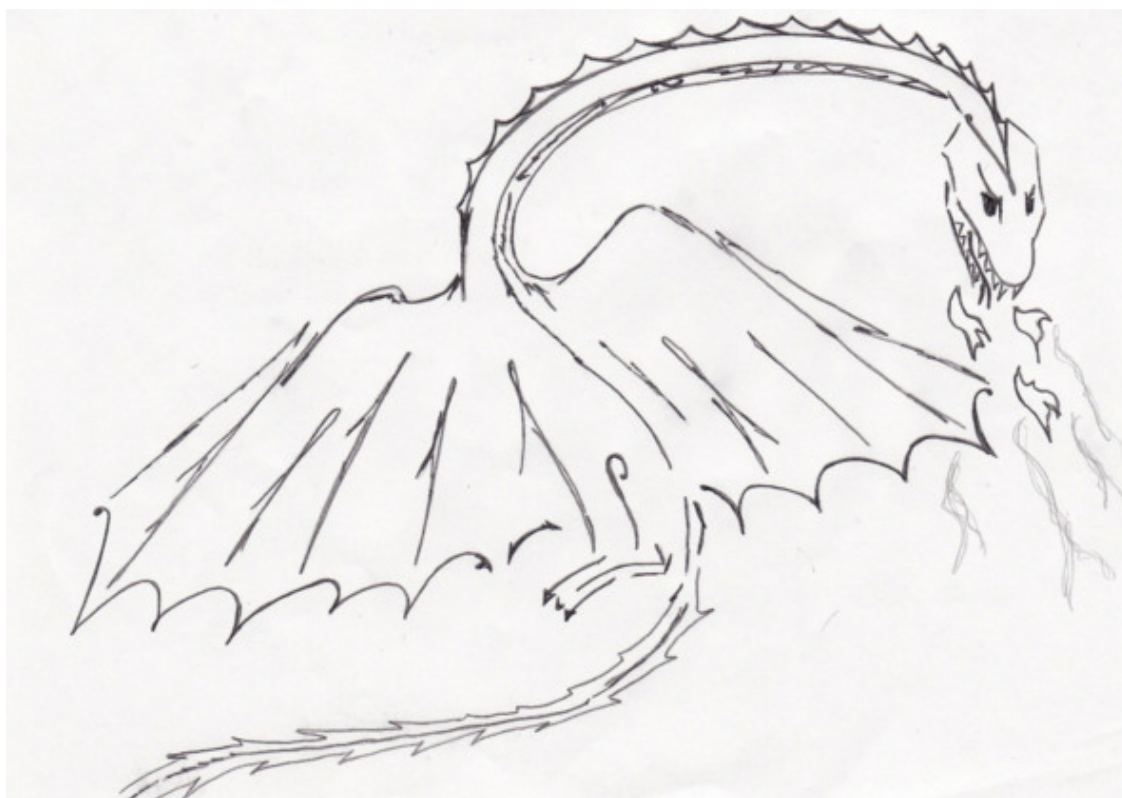
Рисунок автора, 2011 г.

Спускаясь ежедневно к ней с небес, Желая поддержать в её печали. Садилась стаи их на горный склон, Удел гречанки им казался жалок. А из воды, Диане посвящён, Звучал порой прекрасный хор русалок. Морских богинь, однако, голоса Её вниманьем вовсе не владели. Отныне горизонта полоса Вмещала все мечты её и цели. И девушка, знакомый силуэт Надеясь встретить, не спускала взора. Пусть год пройдёт и даже много лет — Вернётся друг. Сегодня. Завтра. Скоро.