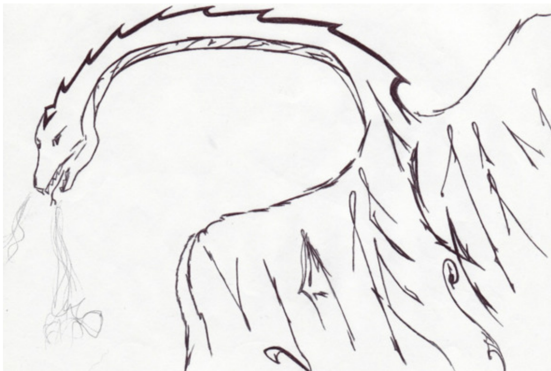
Рисунок автора, 2011 г.

Они смотрели на огонь. Долго, безотрывно. Оба хранили молчание.