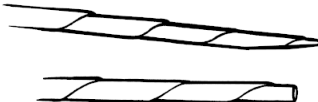
Рисунок 4. Соединение трубочек путем складывания одного конца пополам

Для прочной фиксации трубочек на сложенный конец наносят клей, лучше всего пользоваться в таком случае клеевым карандашом, поскольку сухой клей тотчас схватывается. Если применить клей ПВА или любой другой жидкий клей, то придется долго ждать, пока он высохнет. Еще жидкий клей может существенно размягчить стык, что усложняет изготовление изделия. Тогда как для склеивания карандашом достаточно просто провести одной из трубочек по поверхности карандаша и немедленно соединить две трубочки (рис. 5).