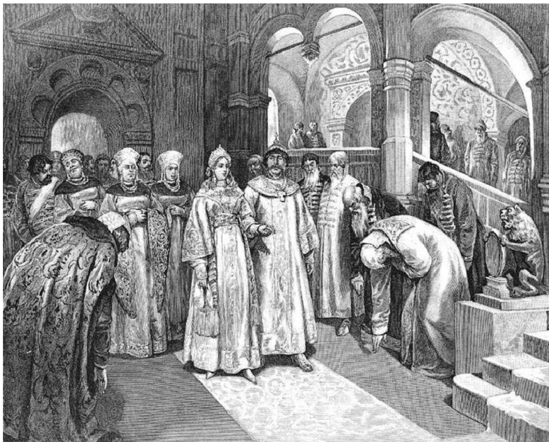
1526 г. Василий III, Великий князь Московский, вводит во дворец невесту свою, Елену Глинскую. Художник Клавдий Лебедев

Дедом Елены Глинской по матери был Стефан Якшич, военный вождь сербов, бежавших от османов и осевших на юге Венгерского королевства. Бабка Ивана по отцу – Софья Палеолог, принцесса из рода византийских императоров. Итак, кровей, в том числе и царственных, в нашем Рюриковиче соединилось немало.