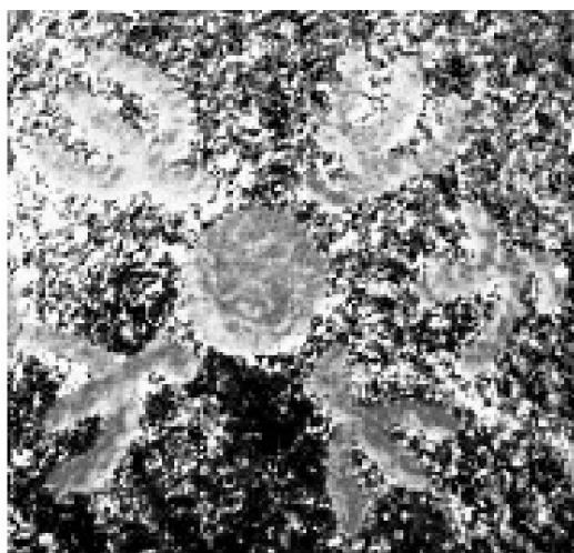
Рис. 1. фотографии наскальных рисунков.

Фотографии наскальных рисунков с темой полного солнечного затмения 18 июля 1229 г. до н. э.