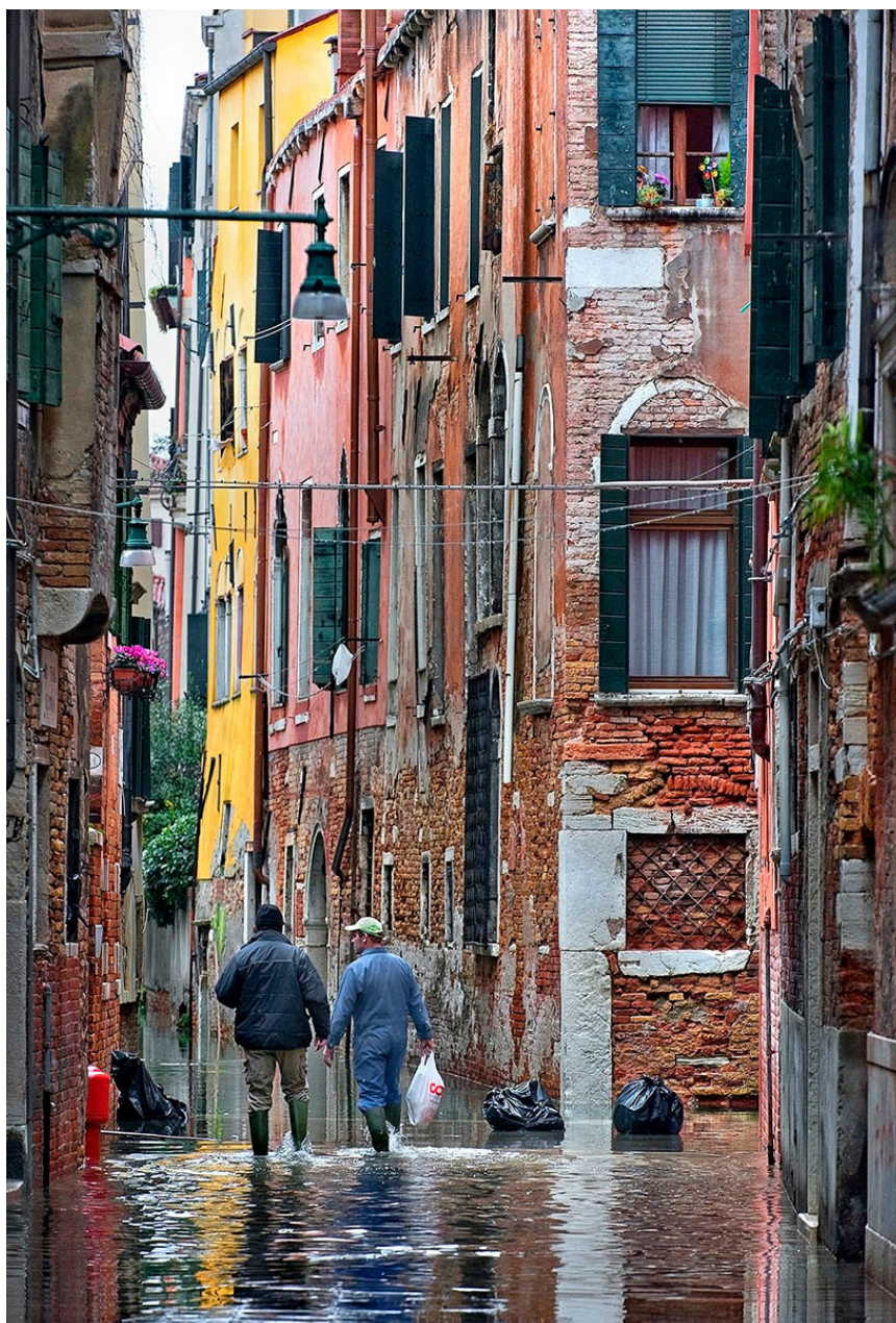
Фото 6. «Аква Альта» из серии «Наводнение в Венеции»