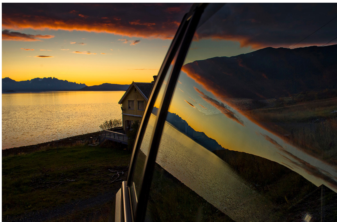
Фото 2. «Норвежский закат с отражением»

Собираясь забраться на сиденье джипа, чтобы ехать дальше, я уткнулся глазами в остекление задней дверки. Там, как в зеркале, отражалось все, что я только что снял. Появилась возможность снять сразу два заката (см. фото 2). Как полезно, однако, повертеть головой, прежде чем зачехлить камеру!