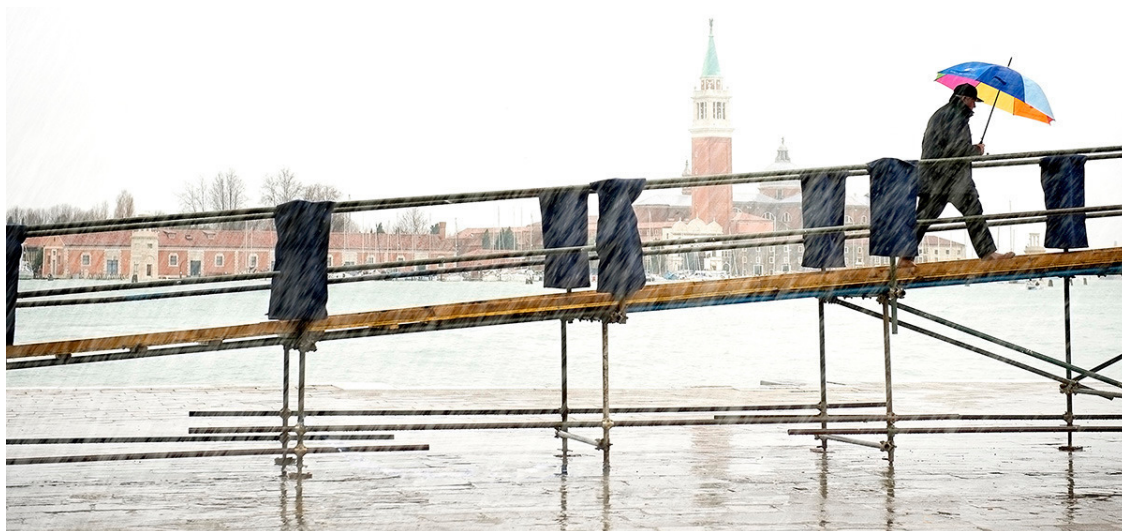
Фото 5. «Новогодний дождь» из серии «Наводнение в Венеции»

Воды венецианской лагуны выплескиваются на набережную, прохожие передвигаются по временным мосткам и мостикам. Сюжет фото 5 строго горизонтален в силу того, что и сама набережная, и мостик на переднем плане, и даже комплекс храма Сан-Джорджо Маджоре на острове в глубине композиции тянутся вдоль линии горизонта. При кадрировании пришлось убрать пустое небо сверху и часть мостовой на переднем плане снизу. Удаленные части файла не содержали никакой полезной информации.