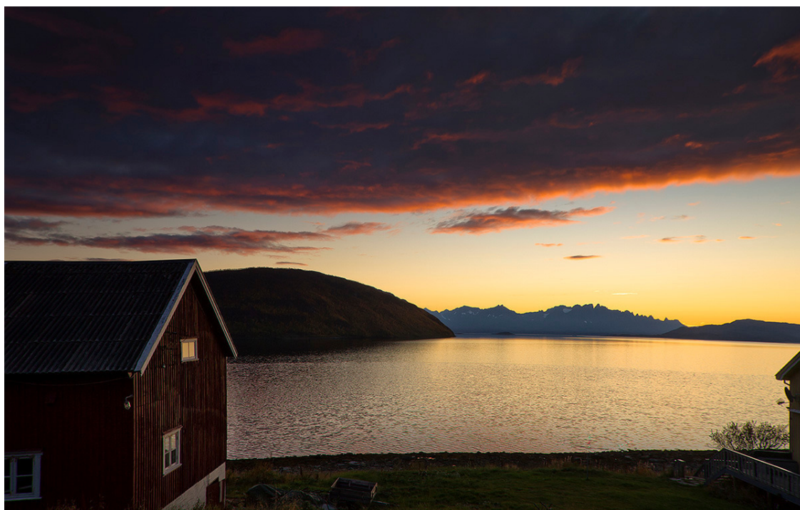
Фото 1. «Норвежский закат»

В Норвегии, где я был в составе группы, мы спешили на последний паром, когда случился необыкновенно красивый рериховский закат. Следующего парома пришлось бы ждать до утра. Размышлять было некогда еще и потому, что солнце закатилось за линию горизонта за полчаса до момента съемки, краски успели потускнеть и вот-вот могли совсем потухнуть. Фото 1 и 2 пришлось снимать, не отходя от машины.