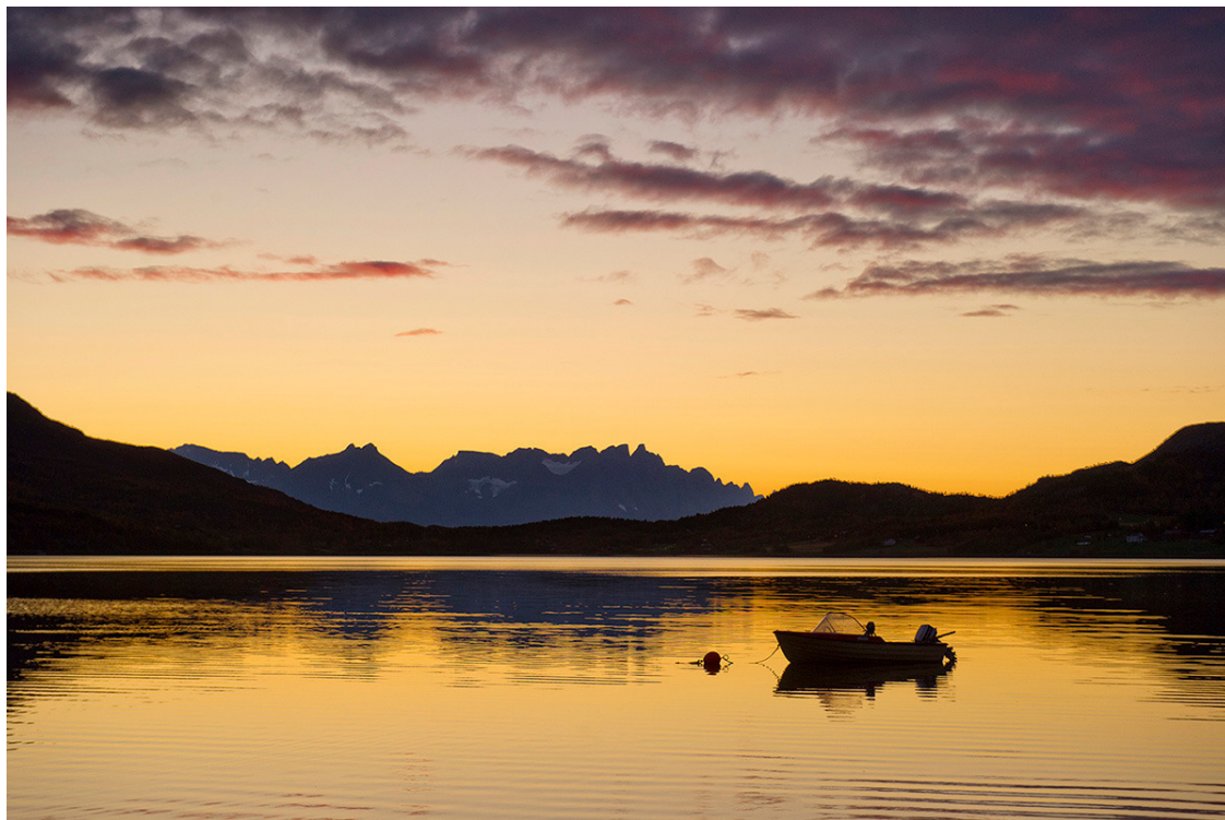
Фото 3. «Норвежский закат с лодочкой»