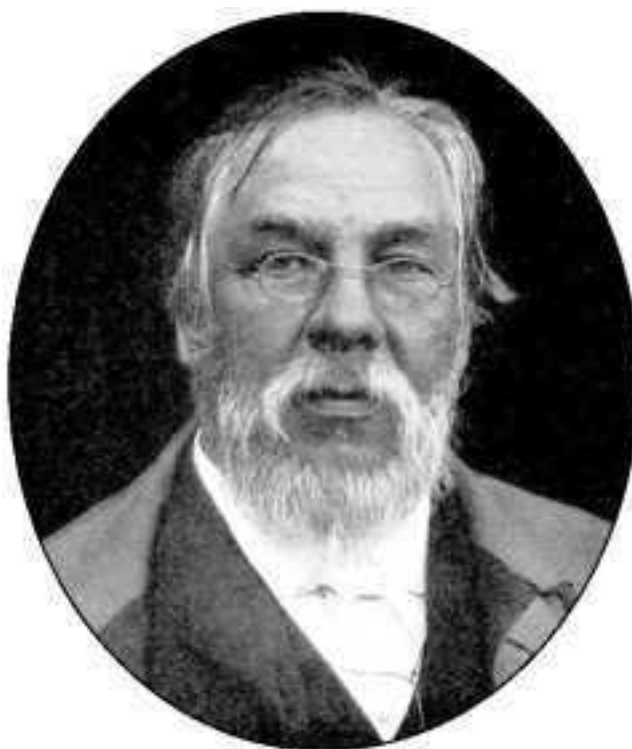
Русский врач-терапевт и общественный деятель Сергей Петрович Боткин

Замечу, что жена императора Александра II – Мария Александровна родила царю семейных детей. Роды и склонность императрицы к простудам сделали свое дело, и во второй половине 60-х годов это была больная, психологически сломленная смертью старшего сына женщина, муж которой больше времени уделял фавориткам, чем здоровью жены. 22 ноября 1870 года высочайшим указом Александра II врач С.П. Боткин назначается почетным лейб-медиком, а главным объектом его забот и лечения становится императрица Мария Александровна.