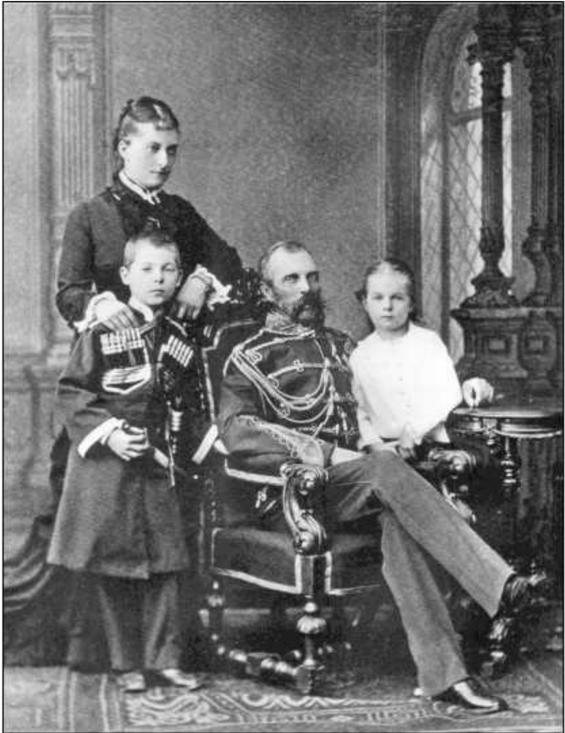
Император Александр II со второй супругой Екатериной Долгорукой и детьми

6. Чрезвычайно важное геополитическое значение с точки зрения размещения летней резиденции имело присутствие на Крымском полуострове агрессивно или нейтрально настроенных коренных этнических групп населения, среди которых преобладали так называемые крымские татары, греки-туркофоны, урумы и караимы. Крымские татары как самостоятельный этнос сформировались в Крыму в XIII–XVII веках. Историческим ядром крымско-татарского этноса являются тюркские племена из кипчако-огузской группы, осевшие в Крыму, которые смешались с местными потомками гуннов, хазар, печенегов, а также представителями дотюркского населения Крыма. После окончания Крымской войны (1853—25.02.1856) начался массовый исход в Турцию крымских татар (около 198 тысяч человек) и принудительное выселе-