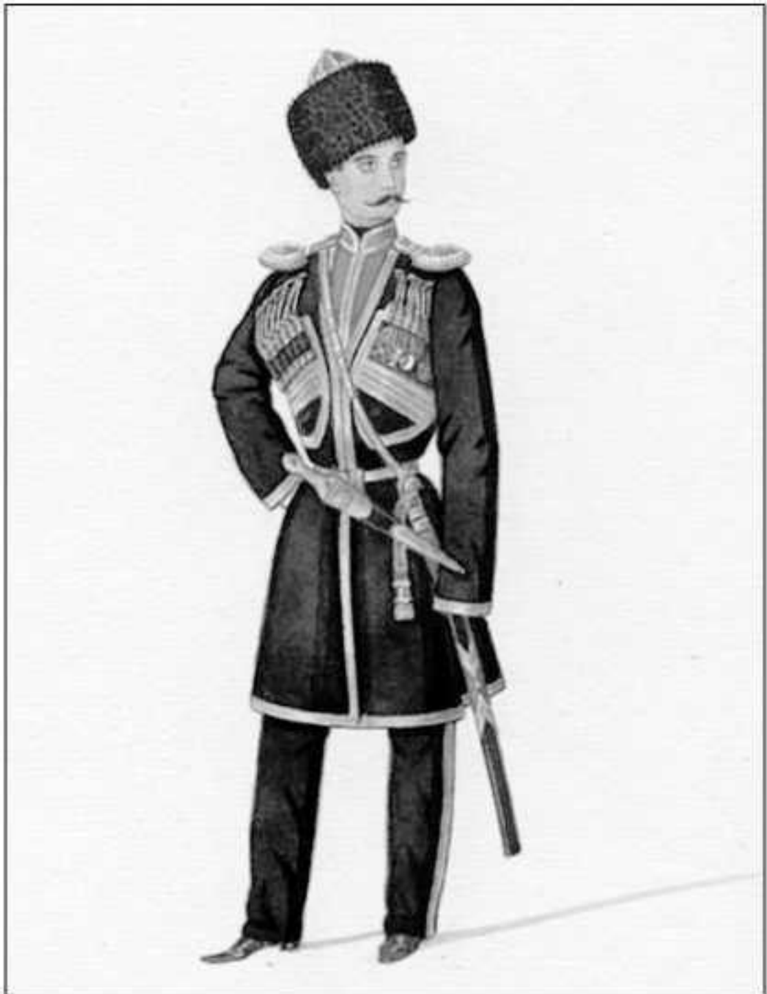
Лейб-гвардии Кавказский казачий эскадрон СЕИВ конвоя. Ober-офицер в обыкновенной форме. Ливадия, 1864 год