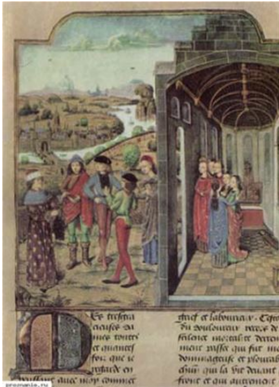
Миниатюра, предворяющая первый день «Декамерона»

Одна из самых знаменитых книг в мире, «Декамерон», была создана, скорее всего, между 1349 и 1351 годами. За образец Боккаччо берет средневековые сборники так называемых примеров , новелл на латинском языке, создаваемых для проповедников, причем, источниками не гнушались брать не только эпизоды Священного писания, но и языческие басни, анекдоты, сказки и легенды Древней Греции и Рима. Историкам литературы известны сборники «Римские деяния» и «Народные проповеди»).