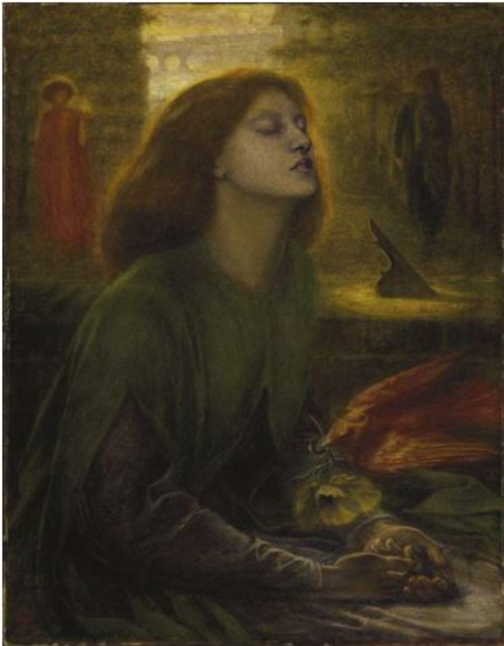
Беатриче Портинари. Д.Г.Росетти (1863-1864)

Тогда же и появляются первые строки, посвященные далекой и недоступной красавице, вскоре, в 1290 году умершей. Любовь и скорбь пронизывает стихи Данте, созданные в период с 1283 по 1292 год. Восхваление возлюбленной, стремление к божеству, мистическое толкование любви – вся эта сложнейшая символика вызовет целый поток исследований, в которых часть ученых увидит в Беатриче лишь поэтическую фикцию – аллегорическое выражение политических и философских идеалов автора. Однако существование Беатриче подтверждено – в архивах Флоренции было обнаружено завещание Фолько, в котором упоминается имя его дочери Беатриче.