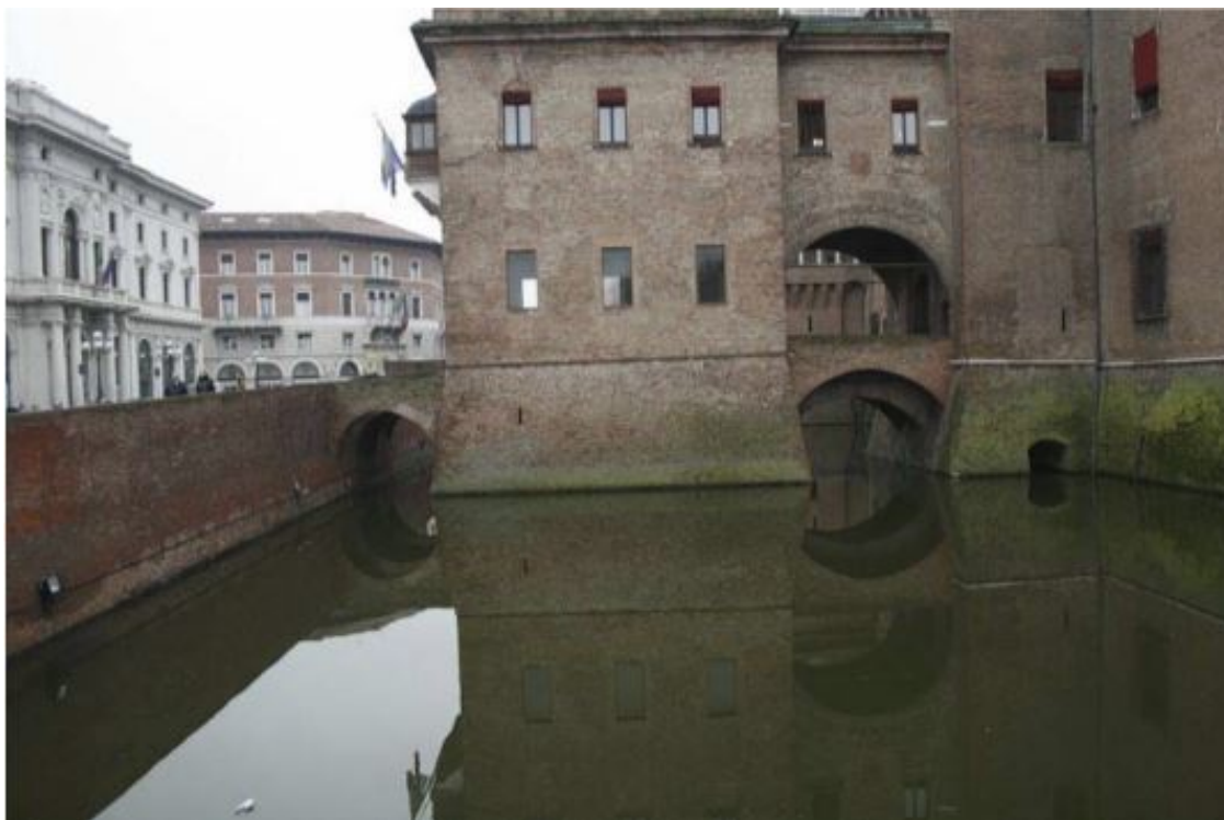
Одна из улиц Феррары

Феррара... Север Италии... Город, имя которого связано с одним из замечательнейших итальянских поэтов Лудовико (Лодовико) Ариосто (1474-1533). Благородный род, богатый отец... Феррара давно вызывала неприязнь у окружающих ее городов – Милана, Венеции, Флоренции и, конечно, Рима. Уж слишком независимый и, главное, сумевший остаться мирным во время междоусобных войн, рвавших на части Италию в XV-XVI веках.