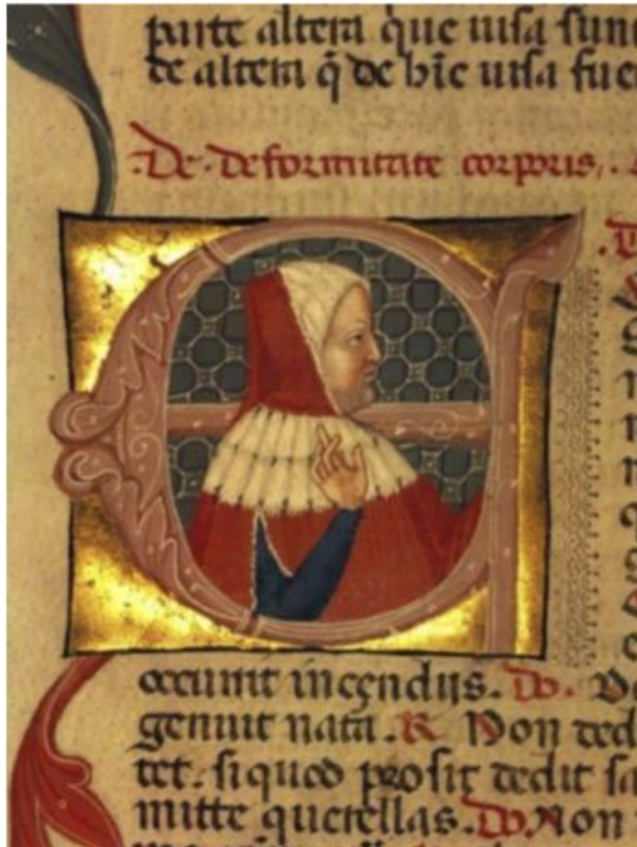
Подлинная обложка одного из трактатов Петрарки

В начале 1341 г. Петрарка получает предложение от Парижского университета, позже от Неаполитанского короля и, наконец, от папской курии, которая сочла возможным короновать его лавровым венком. Событие, ставшее апофеозом всей жизни Петрарки, апофеозом и началом эпохи, ставшей в нашем сознании той самой эпохой Возрождения, состоялось 8 апреля 1341 г. Первый день Пасхи, когда празднуется воскресение Христа. По преданию, Петрарка сам назначил эту дату. Как утверждает Джованни Боккаччо, Петрарка видел особый смысл в том, чтобы его всемирное признание состоялось именно в день возрождения. Он верил, что акт увенчания его в качестве одного из основоположников гуманизма, создателя литературного итальянского языка, начинает новую эпоху в истории не только в его родной Италии, но и во всей Европе. Об этом дне Петрарка расскажет в письме своему покровителю – Неаполитанскому королю Роберту, одарившего его в знак признания выдающихся заслуг перед поэзией пурпурной мантией, подбитой горностаем, наподобие тех, что в торжественных случаях возлагались на плечи монархов... Боккаччо говорит, что именно с этого дня начался отсчет новой