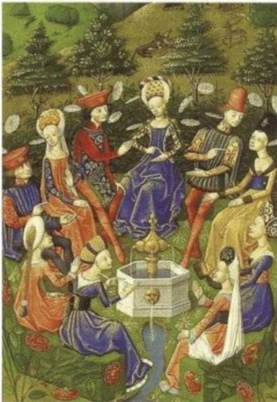
Еще одна чудесная средневековая иллюстрация к книге Боккаччо

«Декамерон» содержит десять тематических блоков – десять дней рассказов троих молодых людей и семи девушек, собравшихся в тосканском имении одного из героев, чтоб спастись от чумы – и лучшего развлечения, чем пение и танцы, любовь и игры, купание и прогулки, а, главное, увлекательные, поучительные, фривольные, таинственные истории, они не нашли! Время Боккаччо еще не знало сказок «Тысячи и одной ночи», но как похожи новеллы с обрамляющими конструкциями, новеллы, где внутри одной содержатся другие, на прекрасные сказки мастерицы Шехерезады!