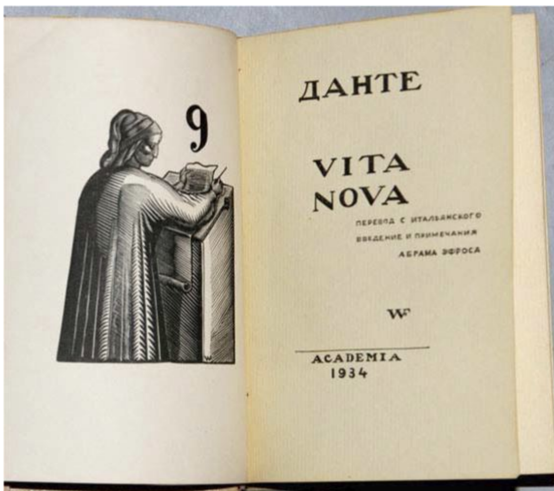
Уникальное издание книги Данте

Исследователям известны его взаимоотношения с доминиканцами монастыря Santa Maria Novella. От Блаженного Августина до схоластической философии, от Овидия к Горацию, от Лукиана к Сенеке... Философия и классическая литература, физика и астрономия... Однако политическая борьба во Флоренции не может оставить равнодушным и его – Данте становится членом цеха врачей и аптекарей, к которым принадлежали еще и книгопродавцы, и художники.