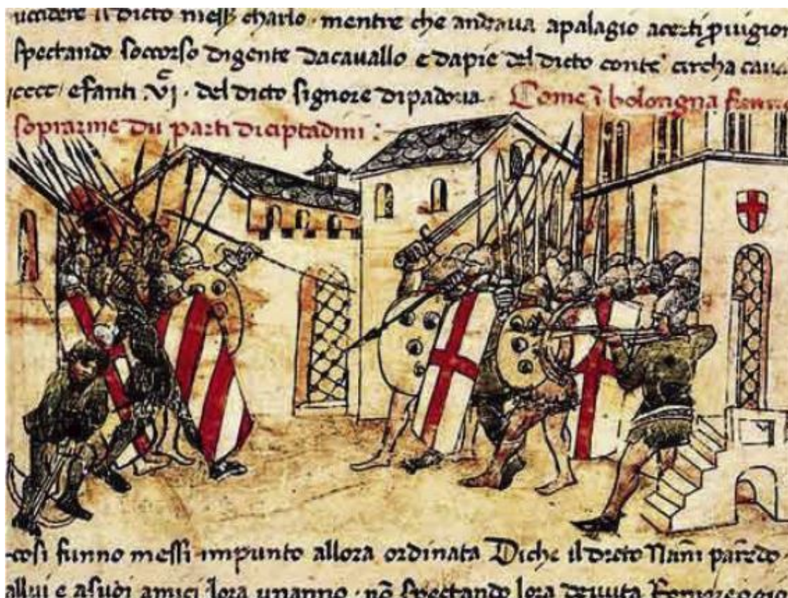
Бой между гвельфами и гибеллинами