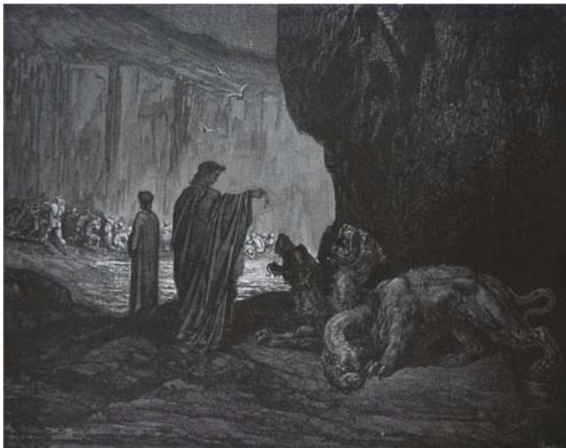
Из иллюстраций Г.Доре к «Божественной комедии»

По форме поэма являет собой загробное видение, что было достаточно популярным в средневековой светской и клерикальной литературе. Как и у многих средневековых поэтов, она держится на аллегорическом стержне. Так, дремучий лес, в котором поэт заблудился на полпути земного бытия, – символ жизненных осложнений. Три зверя, которые нападают на поэта: пантера, лев и волчица – три самые сильные страсти: чувственность, властолюбие, жадность. Этим аллегориям дается еще и политическое истолкование: пантера – родина гения, Флоренция, пятна на шкуре ее должны обозначать вражду партий гвельфов и гибеллинов. Лев – символ грубой физической силы – Франция; волчица, алчная и похотливая – папская курия. Звери угрожают национальному единству Италии, о котором мечтал Данте, единству, скрепленному господством феодальной монархии. Но, пожалуй, стоит уберечь себя от лишней политизации поэмы Данте.