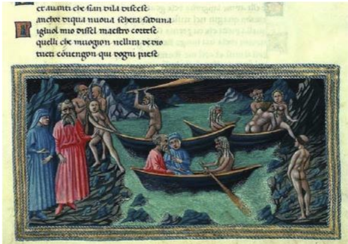
Данте и Вергилий в ладье Харона. Н. де Улиссе, 1444-1450

В удивительно точной композиции «Божественной комедии» сказался рационализм нового творчества, развившегося в атмосфере зарождающейся буржуазной культуры.