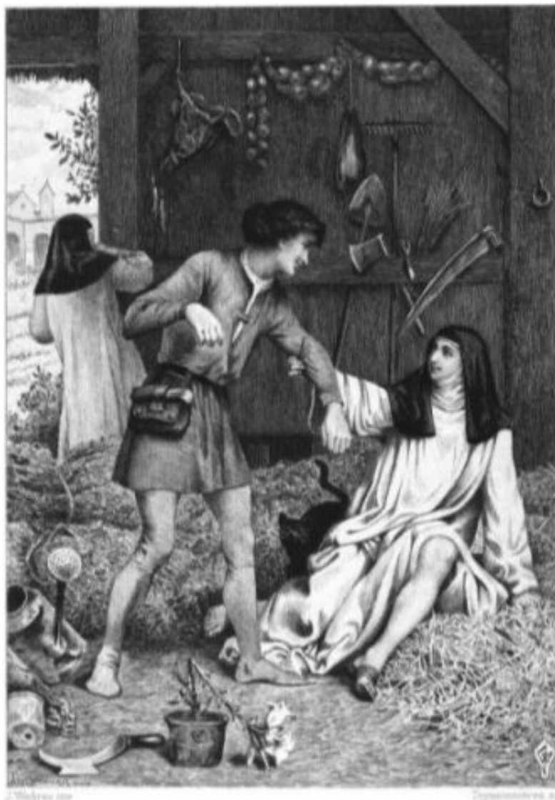
Иллюстрация к еще одной новелле

За первой, собственно вступительной, новеллой, бросающей более, чем сомнительный свет на средневековых католических чудотворцев, следуют другие новеллы, которые тоже можно назвать антиклерикальными. Это известная новелла о богатом парижском купце Абраме (Аврааме), которого его друг, итальянский купец, настойчиво уговаривал принять христианскую веру. Прежде чем решиться на столь ответственный шаг, Абрам отправляется в Рим, чтобы поглядеть на главу христианской церкви. Проведя некоторое время в Риме, Абрам пришел к заключению, что папа и все его присные, «от мала до велика, открыто распутничают, предаются не только разврату естественному, но и впадают в грех содомский, что ни у кого нет ни стыда, ни совести... И чем пристальнее он в них вглядывался, тем больше убеждался в их алчности и корыстолюбии...».