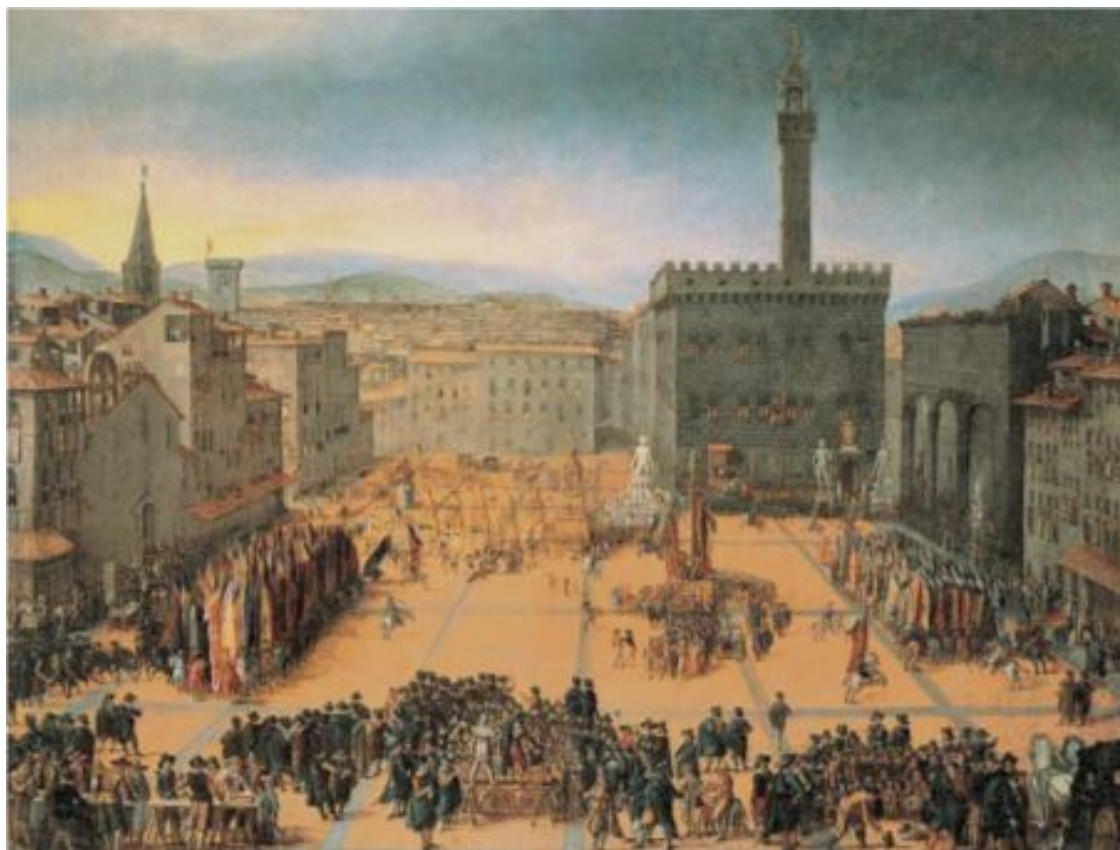
Далекая Флоренция. Площадь Синьории

Вероятно, отец Данте был юристом. В семье, ведущей свое начало от рыцарского рода, феодальные настроения были чрезвычайно сильны, хотя долгое пребывание в городе купцов и политиков, художников и поэтов заставляло эти традиции тускнеть. Понятно, что могла дать Данте школа этой эпохи – схоластика царила еще долго... Университета во Флоренции не было, и по всей вероятности, юноша учился в Болонье, университет которой славился медицинским и юридическим факультетами. Самообразование – он читал все, что попадает в поле зрения, ища свой путь, путь ученого, мыслителя и поэта. Великий римлянин Вергилий станет его «вождем, господином и учителем». Данте, овладевший французским и провансальским языками, стал поглощать поэмы о Трое и Фивах, об Александре Македонском и Цезаре, о Карле Великом и его паладинах, а в рифмованных французских энциклопедиях и дидактических поэмах он находит все новые и новые знания. Видимо, в Болонье Данте знакомится с Гвидо Гвиницелли, 1 поэтом, считавшимся родоначальником «нового сладостного стиля» (позже, в своей «Комедии» Данте назовет его отцом).