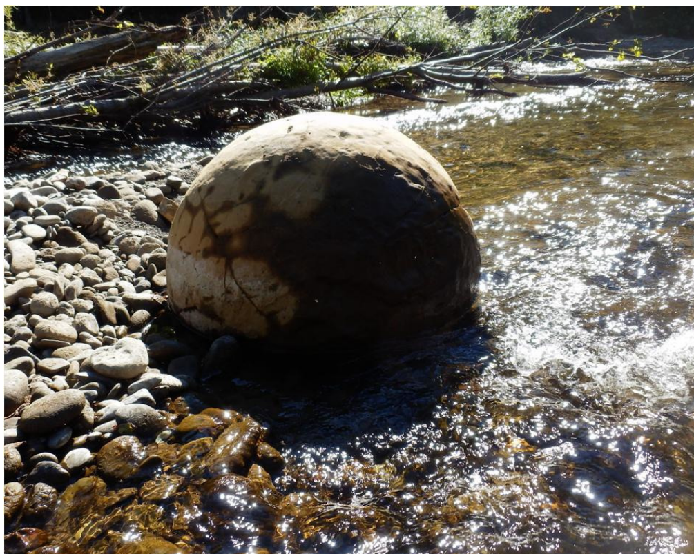
Такой каменный шар, ядро от гигантской старинной пушки в диаметре за полметра.