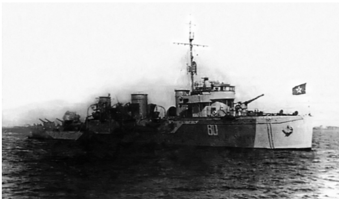
Эскадренный миноносец «Куйбышев»