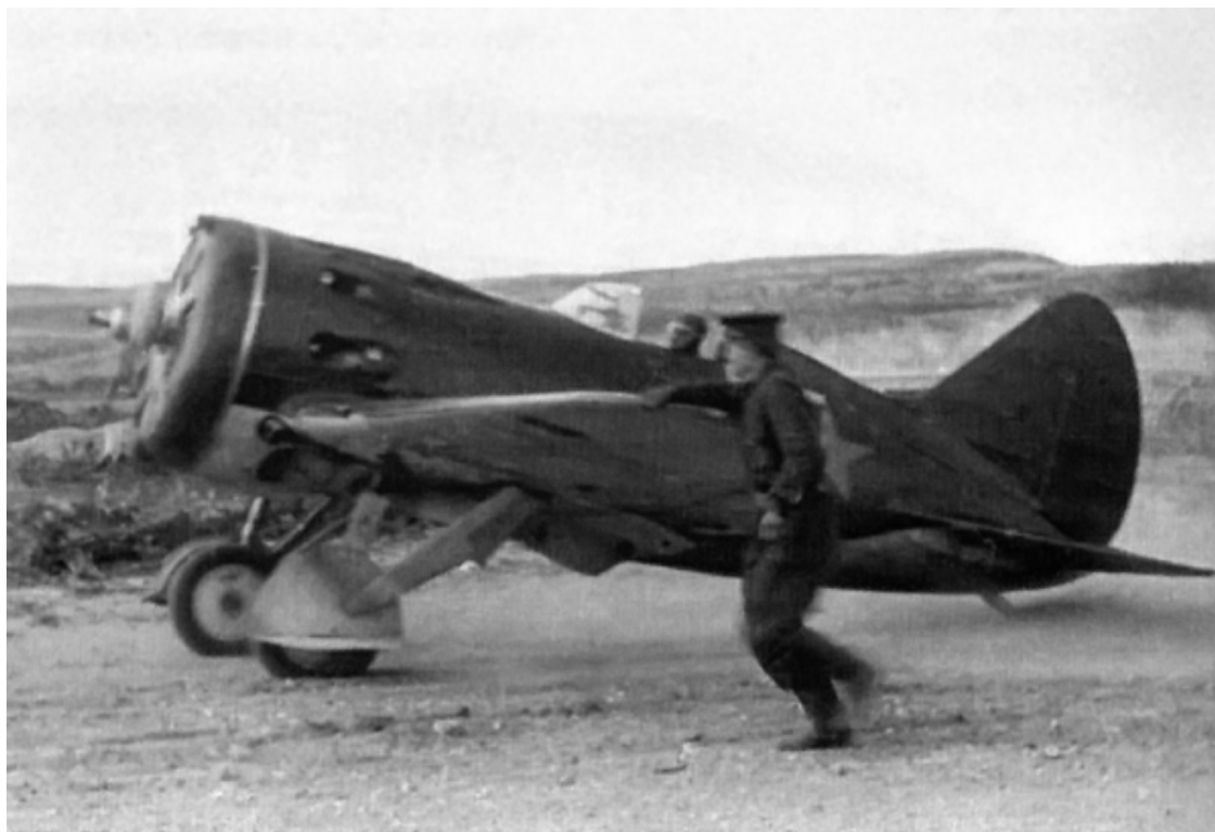
Истребитель И-16 72-го смешанного авиационного полка