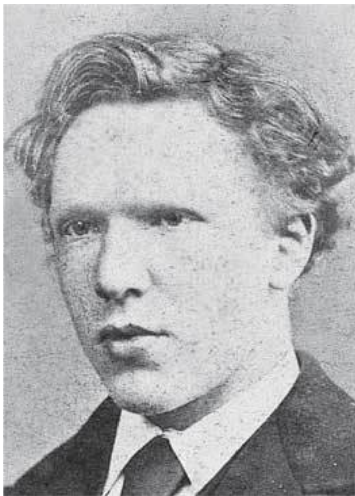
Винсент Ван Гог в возрасте 19 лет