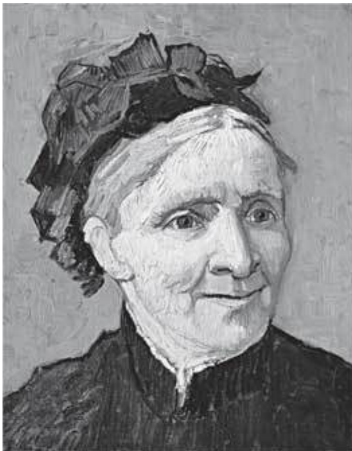
Портрет матери художника

Но увы! Через шесть недель ребенок умер.