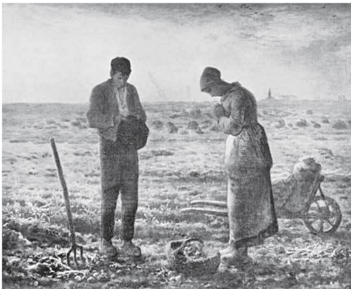
Жан-Франсуа Милле. Вечерняя молитва (Анжелюс).

Но ответом ему был смех Урсулы. Иронический смех Судьбы.