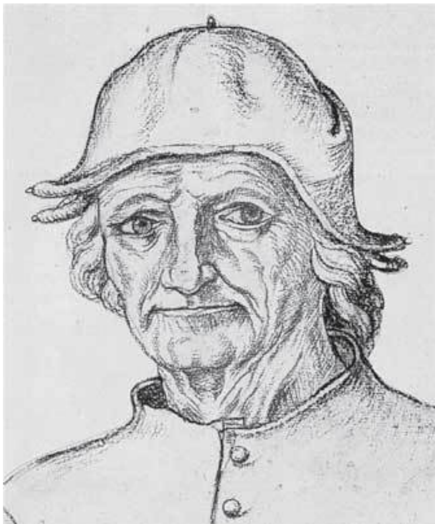
Иероним Босх. Автопортрет