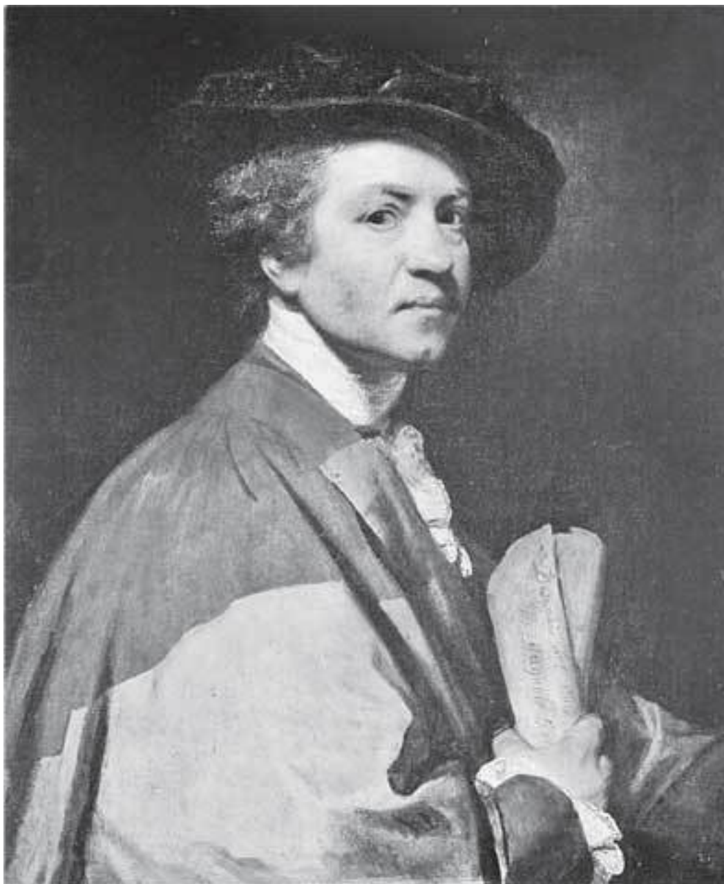
Джошуа Рейнольдс. Автопортрет

Винсент плутал по узким окраинным улочкам, где жили герои Диккенса, где обитают их братья. Старая, добрая, веселая Англия! Он гулял по набережной Темзы, любуясь водами реки, тяжелыми баржами, перевозящими уголь, Вестминстерским мостом. Иногда он доставал из кармана листы бумаги и карандаш и начинал рисовать. Но всякий раз он недовольно хмыкал. Рисунок не получался.