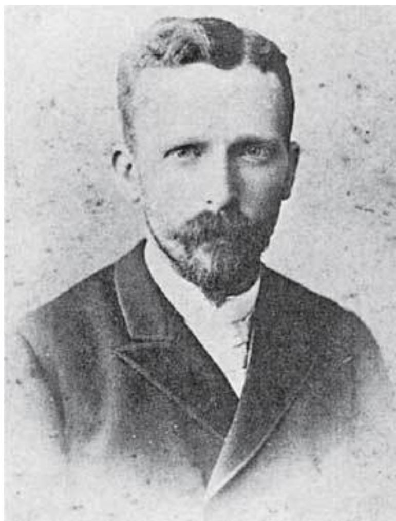
Теодор Ван Гог, брат художника

Впрочем, неуживчивый нрав юного Винсента проявлялся не только в родительском доме. Поступив в коммунальную школу, он прежде всего выучился у крестьянских ребят, сыновей местных ткачей, всевозможным ругательствам и сыпал ими направо и налево, стоило ему только выйти из себя. Не желая подчиняться никакой дисциплине, он выказал такую необузданность да и с соучениками вел себя так вызывающе, что пастору пришлось взять его из школы.