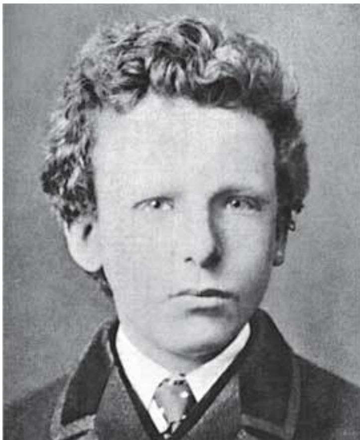
Винсент Ван Гог в возрасте 13 лет