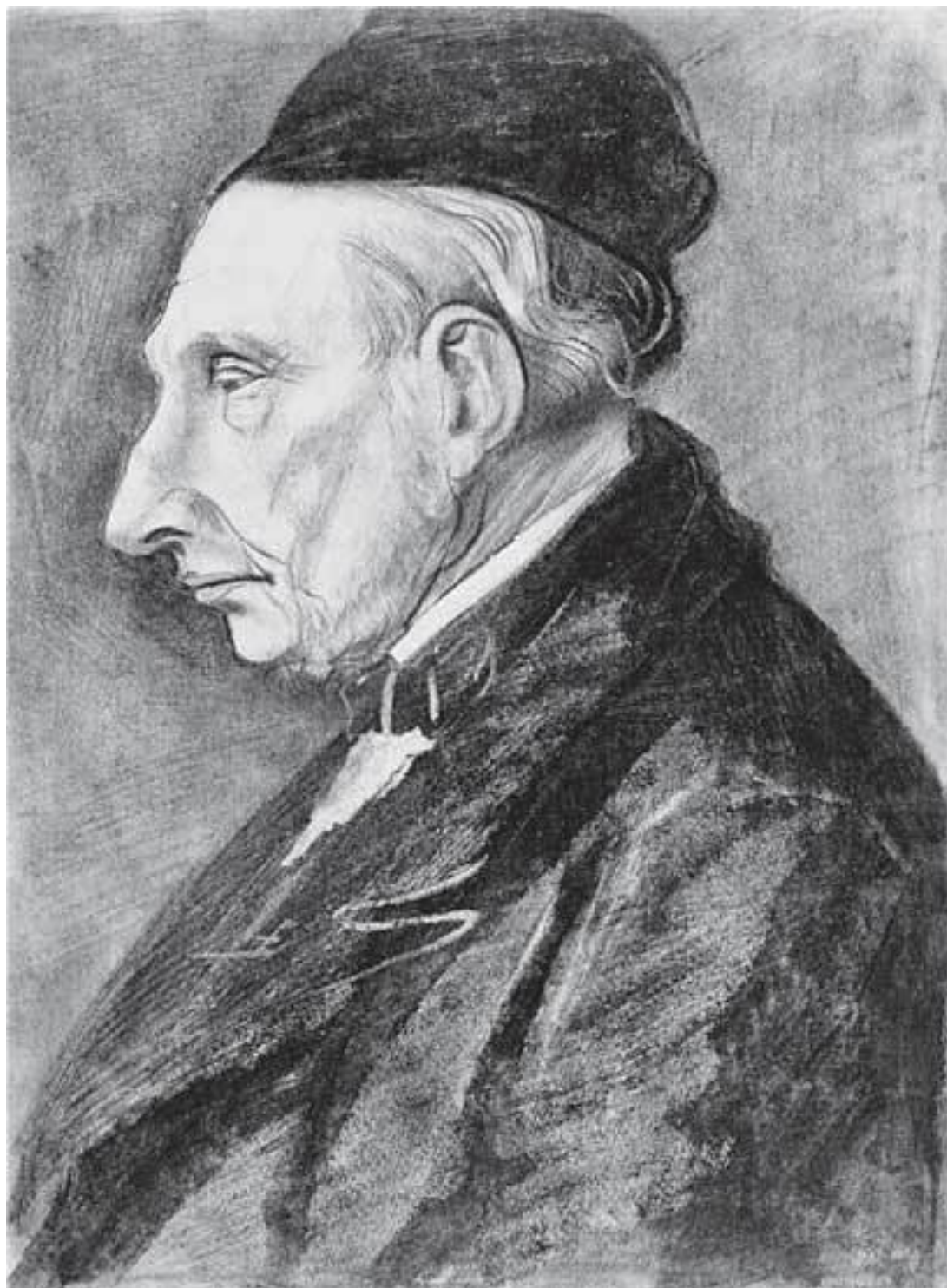
Портрет отца художника