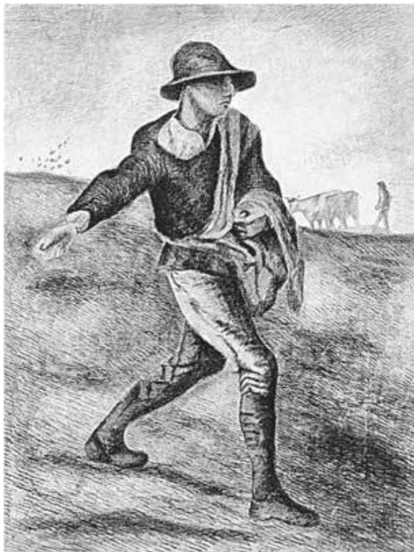
Сеятель. (Подражание Милле)

В 1849 году в один из таких приходов – Гроот-Зюндерт, – небольшой поселок, расположенный у самой бельгийской границы, километрах в пятнадцати от Розендала, где находилась голландская таможня по пути Брюссель – Амстердам, был назначен 27-летний священник Теодор Ван Гог. Приход этот весьма незавиден. Но молодому пастору трудно рассчитывать на что-то лучшее: он не обладает ни блестящими способностями, ни красноречием. Его тяжело-весно-монотонные проповеди лишены полета, это всего лишь незамысловатые риторические упражнения, банальные вариации на избитые темы. Правда, он серьезно и честно относится к своим обязанностям, но ему недостает вдохновения. Нельзя также сказать, чтобы он отличался особой истовостью веры. Вера его искренна и глубока, но ей чужда подлинная страсть. Кстати сказать, лютеранский пастор Теодор Ван Гог – сторонник либерального протестантизма, центром которого является город Гронинген.