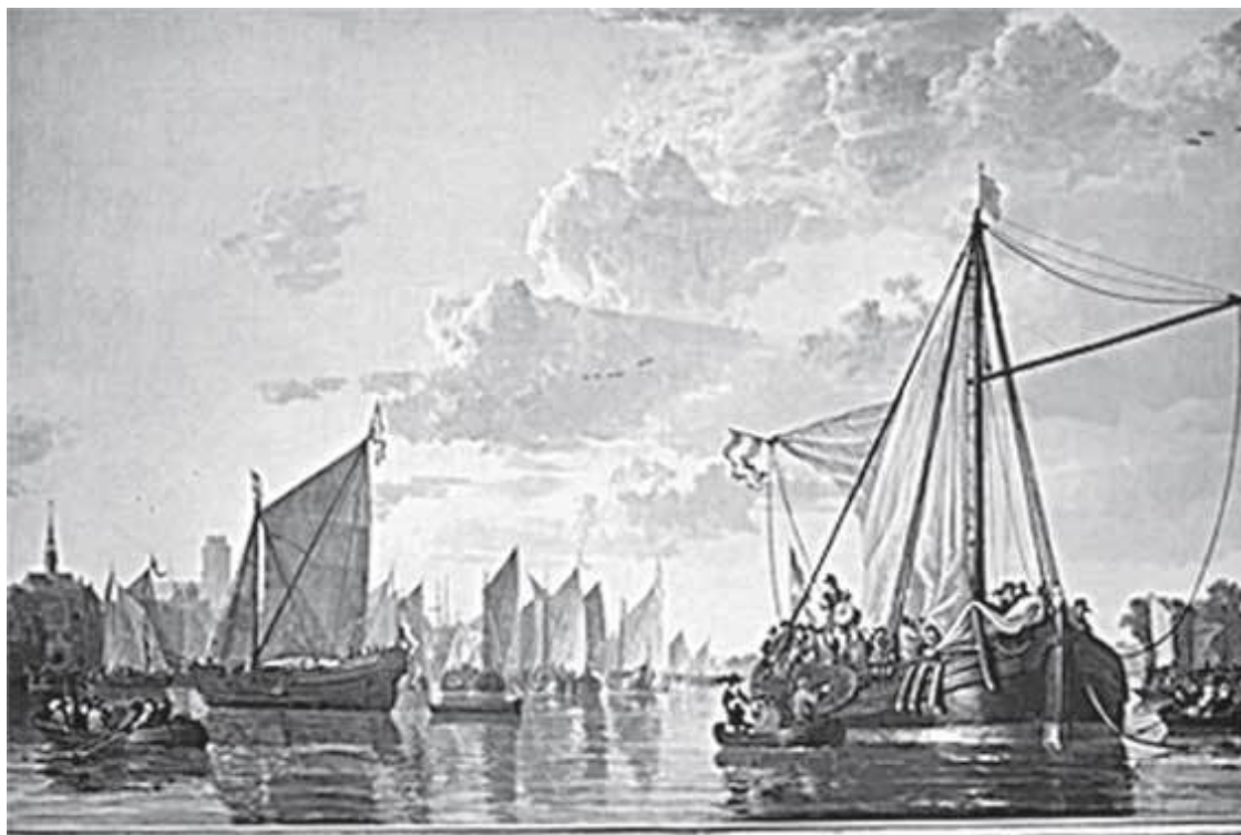
Альберт Кёйп. Маас в Дордрехте

Отец посоветовал ему поискать работу в музее. А Тео заявил, что стоило бы заняться живописью, коль скоро у Винсента такая явная тяга и бесспорные способности к этому делу. Нет, нет, упрямо твердил Винсент. Он не будет художником. Он не имеет права искать легкого пути. Он должен искупить свою вину, доказать, что он не столь уж недостойн заботы, которой его окружали родные. Отвергая Винсента, общество обвиняет его. Он должен пересилить себя и исправиться, чтобы наконец заслужить уважение сограждан. Все неудачи – следствие его неумелости и ничтожества. Он исправится, станет другим человеком. Он искупит свои грехи. А покамест он ищет работу, изучает объявления в английских газетах, списывается с работодателями.