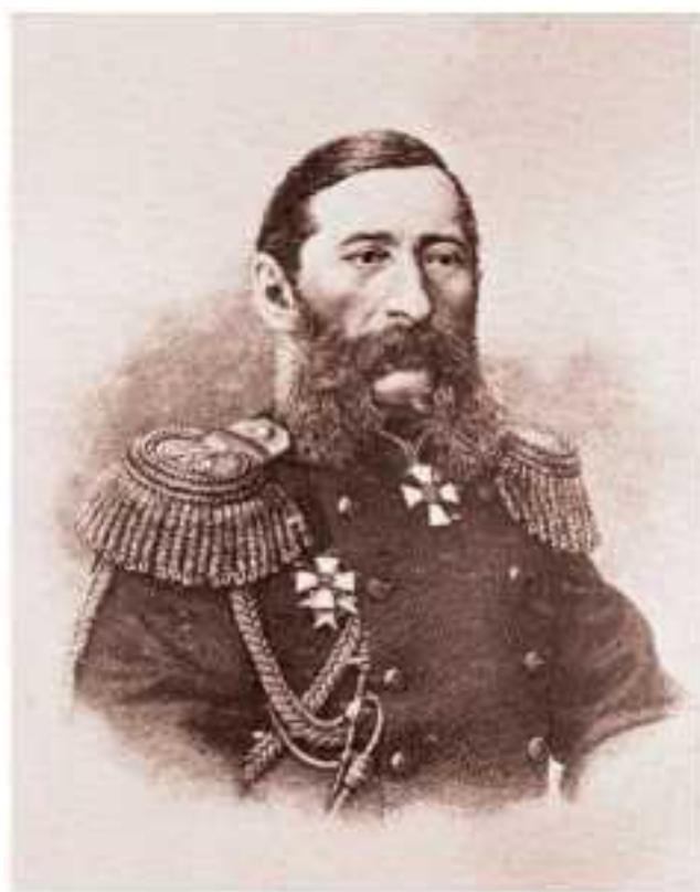
Граф Михаил Тариелович Лорис-Меликов

Полагаю, что Александр II не предполагал, начиная либеральную университетскую реформу, что она вызовет студенческое движение, объединение студентов в кружки и партии, что появится поколение «бунтарей», которое в силу возраста и образования не захочет довольствоваться тем, что имеет. Начиная реформы и, безусловно, желая лучшей доли своему народу, Александр не думал, что столкнется с кризисом доверия народа к самодержавной власти, а также что окажется на месте жертвы «охотников». Власти допустили просчет и пытались найти выход из сложившейся ситуации. «Известен случай, что Александр II, тот самый, обложенный революционерами, семижды искавшими его смерти, как-то посетил Дом предварительного заключения на Шпалерной («дядю» Большого дома) и в одиночке 227 велел себя запереть, просидел больше часа – хотел вникнуть в состояние тех, кого он там держал» 4 .