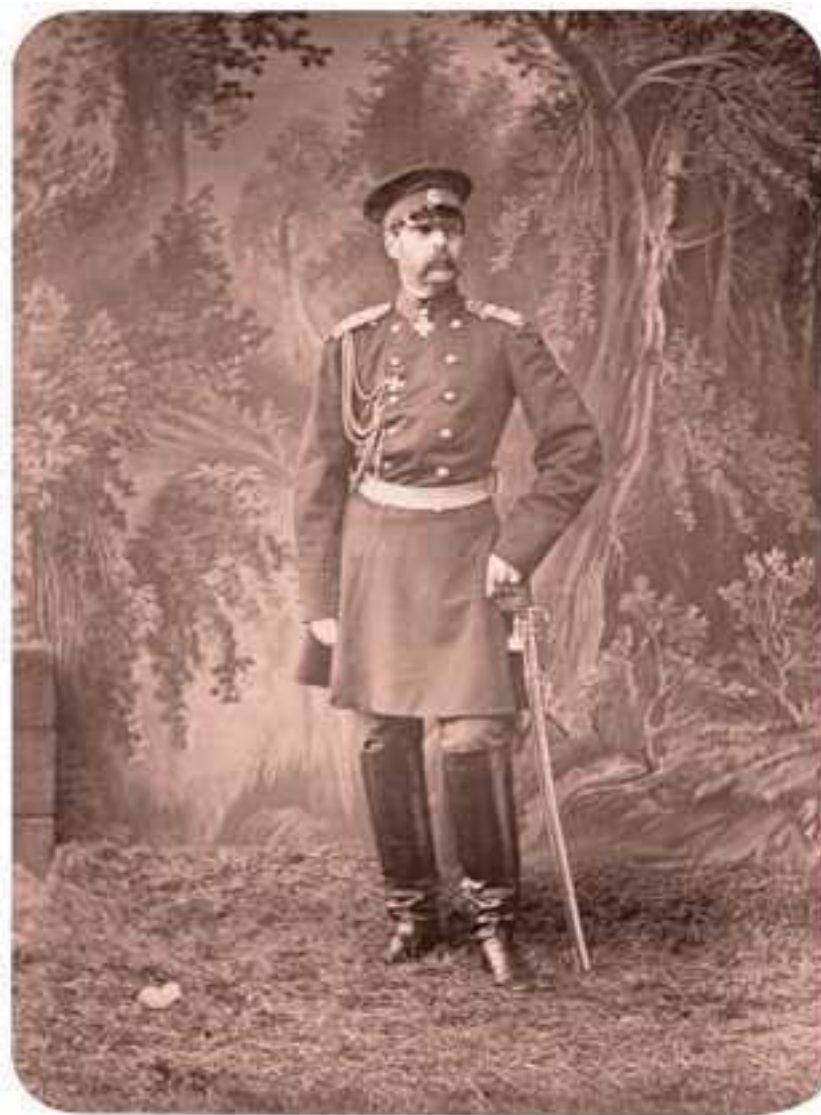
Император Александр II Фото Сергея Левицкого. 1860-е

Что касается внешней политики Александра II, то историки обоснованно относят к его заслугам возврат Россией прав на Черное море и территорию Бессарабии, присоединение Батума и турецкого Карса, освобождение балканских христиан от османского ига и т. д.