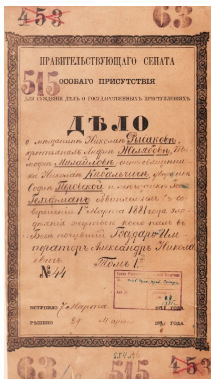
Обложка дела 1 марта 1881 года

Заседание Особого присутствия Правительствующего сената длилось пять дней и проходило с 26 по 30 марта 1881 года. Формально процесс проходил в открытом режиме, однако присутствовать в зале суда могли только обладатели специальных билетов, на каждом из которых указывалась фамилия, имя и отчество, а также звание владельца, подписи инспектора здания судебных установлений и прокурора судебной палаты и сургучная печать 6 .