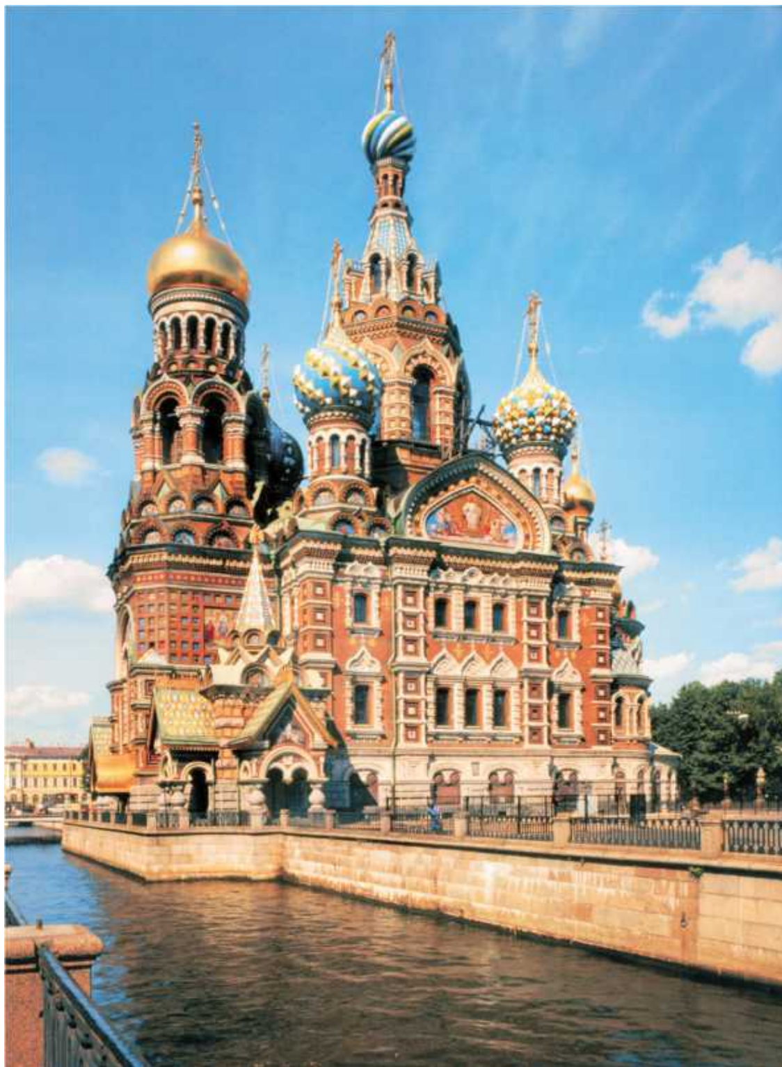
Адольф Парланд Храм Воскресения Христова (Спас на Крови) на месте покушения на Александра II в Санкт-Петербурге