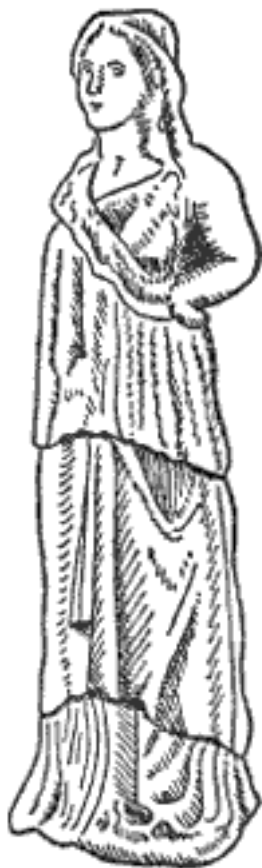
Рис. 3. Мраморная статуэтка из Нисы, видимо изображение богини. Масштаб примерно 1:2. II в. до н. э.

Далее пробел в истории Парфии вплоть до 217 г. до н. э., когда Тиридат занял Гирканию и Комитену, получив богатые земли у юго-восточных берегов Каспия. После этого он перенес свою столицу в селевкидский город Гекатомпил, местоположение которого до сих пор не обнаружено, но известно, что он находился на главном торговом пути через Иран. После его смерти около 211 г. до н. э. царем стал его сын; по-видимому, первый Артабан. К 209 г. до н. э. парфянам принадлежала территория, простиравшаяся до Экбатаны в Мидии, но в этот момент преемник Селевка Антиох III получил возможность отвоевать взбунтовавшиеся провинции. В ходе долгой кампании он снова взял Экбатану, обратил в бегство парфянских всадников, отправленных Артабаном разрушить драгоценные подземные каналы у соляной пустыни, и без труда занял Гекатомпил. Затем он с жестокими боями прошел через Тапуру в восточном Эльбурсе, отвоевал Гирканию и, наконец, заключил союз с Артабаном. Антиох завершил свои успехи, заставив признать свое главенство и Евтидема, правителя Бактрии. Затем, чтобы продемонстрировать восстановление правления на востоке, Антиох прошел дальше, следуя по пути Александра Македонского по Гиндукушу, через перевал Хибер в Пенджаб, и вернулся в Селевкию на Тигре через Сейстан и Карманию. Его экспедиция уменьшила размеры Парфии, однако государство сохранилось.