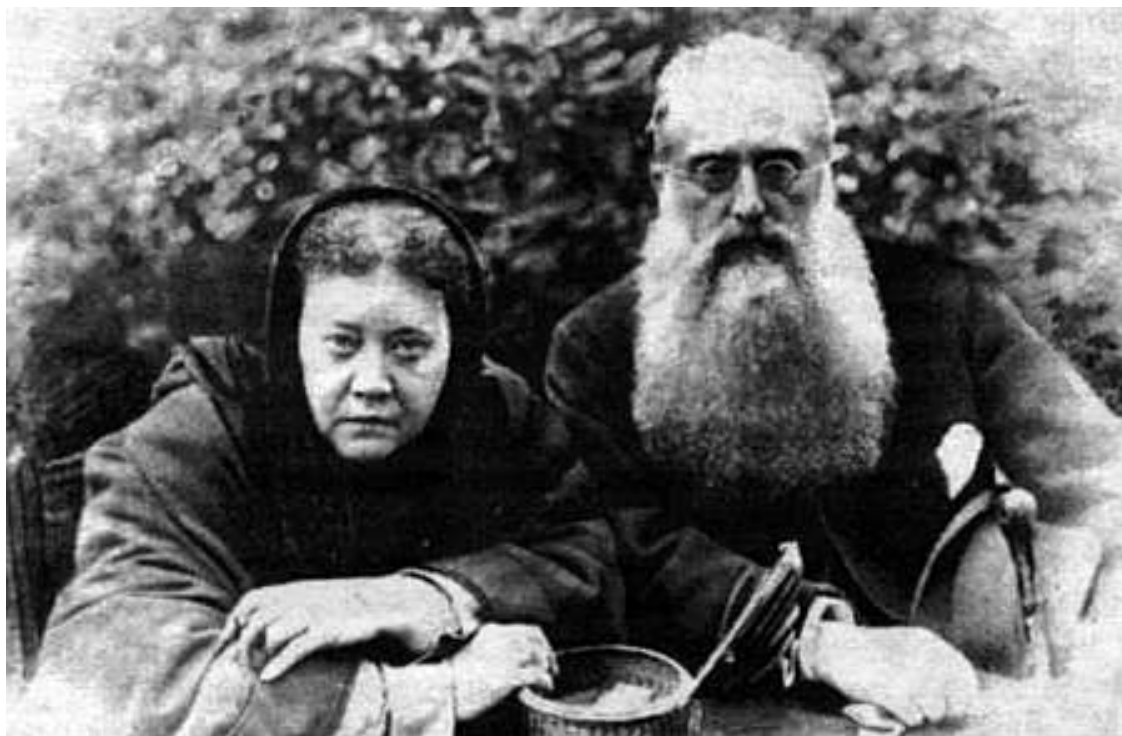
Рис.1.2. Елена Блаватская и Генри Олькотт – основатели Теософского общества

Поскольку теософия Блаватской представляла собой развернутую компиляцию из множества религиозных представлений – как западных, так и восточных, – она была близка по духу учению Маркса, который тоже претендовал на формирование единого взгляда на окружающий мир, на его происхождение и развитие, основанный на множестве других философских учений, появившихся еще до Маркса. Вот почему, чувствуя «революционное» родство, теософы неоднократно посылали своих эмиссаров в Советскую Россию (а бывало, что те ехали сами) в надежде найти свое место в здании коммунистической идеологии, насаждавшейся с момента прихода большевиков к власти. Но впервые «контакт» был установлен еще в семье Маркса.