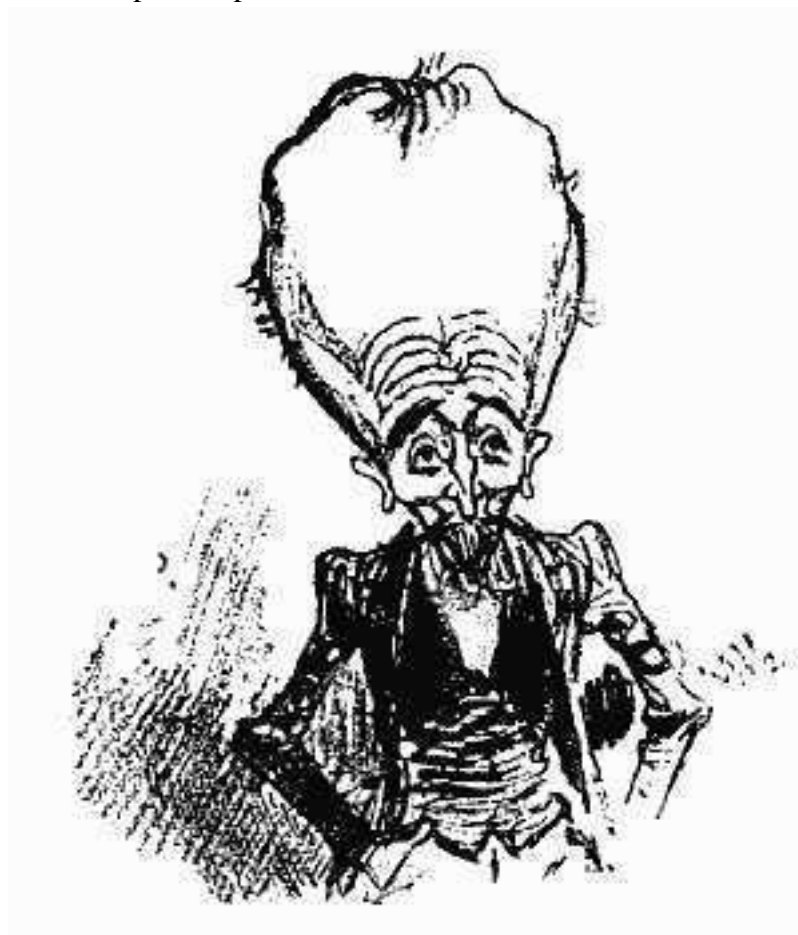
Рис.1.12. Люди будущего по Альберу Робиде (иллюстрация к роману «Электрическая жизнь», 1883 год)

Миф об особенностях мозга и черепа Ленина не был плодом личной фантазии коммунистических лидеров. Они были достаточно начитанными людьми, знакомыми с современными им футурологическими концепциями и фантастическими романами. Именно в произведениях фантастов они могли почерпнуть идею о том, что человек будущего будет обладать огромной головой, вмещающей невероятно развитый мозг.