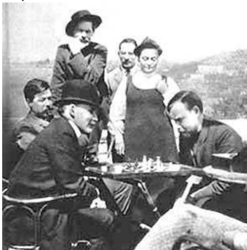
Рис.1.4. Ленин играет в шахматы с Александром Богдановым, 1908 год

Во время революции 1905 года Богданов-Малиновский возглавлял боевую техническую группу большевистской партии и считался настоящим коммунистом. Однако после поражения этой первой революции в России дали о себе знать общеполитические разногласия с ортодоксами-материалистами, которых представлял сам Владимир Ленин. Дело в том, что Богданов отказался от чистого материализма, не приняв аксиому о независимом существовании материальных объектов и доказывая, что если человечество, изменяя мир, способно к теоретическому исследованию и практическому воспроизводству любого вида материи, то нет никакой необходимости в концепции материи, которая стоит над научным познанием. Ленин, наоборот, утверждал, что философствования Богданова – это уход в идеализм, поскольку через человека материя познает материю и не более того.