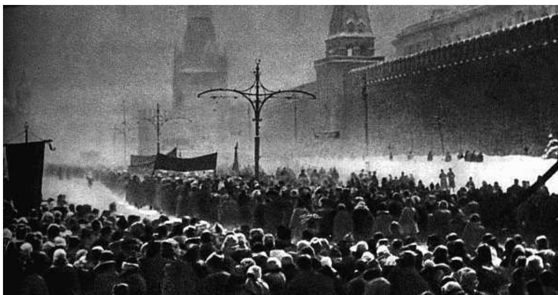
Рис.1.8. Прощание с Владимиром Лениным

Поздние советские источники по этому поводу сообщали, что только с 23 по 25 января были получены тысячи писем и телеграмм с просьбой трудящихся увековечить тело Ленина. Но при этом 27 января телеграфные агентства Советского Союза сообщили: «Встаньте, товарищи, Ильича опускают в могилу!» Опять же в официальном сообщении – ни слова об увековечении тела в мавзолее.