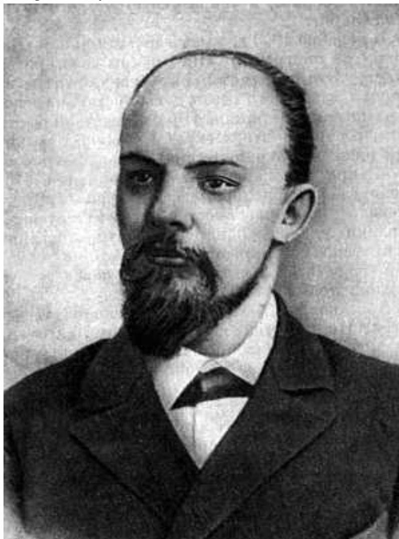
Рис.1.3. Владимир Ульянов (Ленин) в 1897 году

Марксизм оказался очень привлекательным для «недоучек» – для тех, кто не сумел получить полноценное высшее образование. Сам Ленин – экстернант, с первого курса университета он был исключен. Другой марксист-теоретик – Николай Бухарин – дальше первого курса университета тоже не пошел, революционная деятельность помешала. Говорливый Лев Троцкий закончил всего лишь реальное училище.