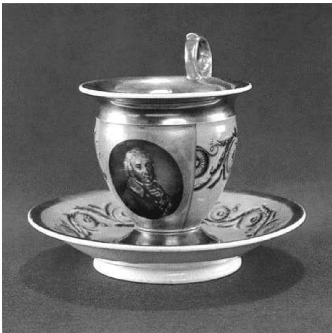
Чайная пара с портретом Николая Алексеевича Голицына. Фарфор из фондов музея-усадьбы «Архангельское»

Думал ли Николай Алексеевич, видевший Париж (а кроме него, Страсбург, Вена, Милан, Турин), о французских королях или нет, но планы его потрясли размахом. Он задумал величественный ансамбль, начав с того, что раскрыл свой дорожный журнал и записал деньги, израсходованные 3 сентября 1780 года, «на букет, извозчика, карточный долг, план Архангельского», за который архитектор де Герн получил 1200 рублей. Тот проект вместе с датой и подписями обеих сторон в полной сохранности дошел до наших дней, в отличие от сведений об авторе. О нем не известно почти ничего, кроме того, что он был немолодым французом и хорошим специалистом с дипломом и премией парижской Школы изящных искусств. Скорее всего, он не приезжал в Россию, и его вклад в Архангельское ограничился планом дворца, или Большого дома, как называл свою новую резиденцию Голицын. Проект парка и всего, что к нему относилось, принадлежал итальянцу Джакомо Тромбара. Он жил в России постоянно и, помимо звания члена Академии художеств и должности придворного зодчего, имел много знакомых среди столичной знати, в числе которых был и Николай Алексеевич. Именно Тромбара предложил разбить в усадьбе парк с террасами и новыми оранжереями, воплотив замысел с итальянским мастерством и русским размахом. Благодаря ему корявый склон превратился