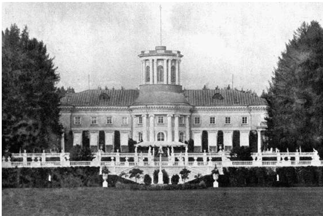
Большой дом. Фотография, конец XIX века

Вместе с Большим домом на высоком берегу Москвы-реки строились 2 тепличных павильона, законченные к 1786 году. Ни один из них до нашего времени не сохранился, однако представить, как они выглядели, позволяет рисунок крепостного художника, где оранжереи изображены вместе с ближайшим участком Большого партера, как ландшафтным искусстве называют парадную, открытую часть парка, для которой характерны геометрическое построение, строгость линий и форм. При оформлении партера в Архангельском Тромбаре не понадобилась фантазия, ведь подобные сооружения не допускали отклонения от правил: прямые аллеи, огромные засеянные травой площади, редко посаженные и подстриженные по-версальски в виде шаров деревья. Позади них возвышалась стена из старых лип с пышными кронами. Считается, что липы остались от французского сада Дмитрия Михайловича, поскольку новый хозяин хотел иметь настоящий парк сразу, не дожидаясь пока вырастут молодые деревца.