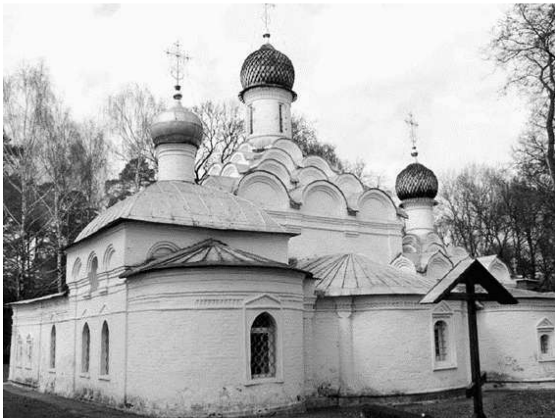
С южной стороны Михаила Архангела находится маленькое кладбище

Вначале единственный вход в храм Михаила Архангела находился с северной стороны, там, куда подходила дорога из села. Позже здание было перестроено по канонам классицизма и, к сожалению, утратило свою оригинальную композицию. Позднейшие строители, не искусные в архитектурном искусстве, неловко расширили окна, переложили полы, снесли тесовую кровлю, заменив ее железной. Под банальной четырехскатной крышей спрятали очаровательные кокошники – за ними якобы некому было ухаживать. Тогда же снесли маленькую звонницу над западной стеной, а вместо нее возвели колокольню, сначала деревянную, а потом каменную, трехъярусную, с часами и шпилем.