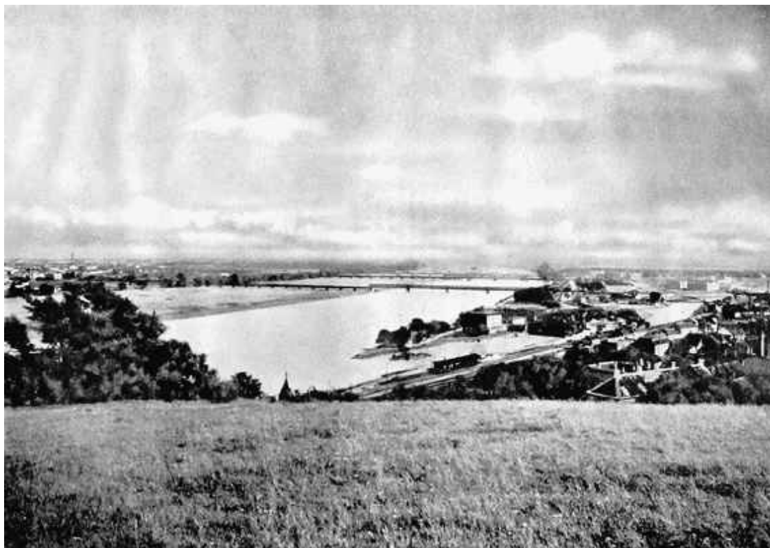
Местность, где Дунайский канал впадает в Дунай. Вид с горы Каленберг

Генрих Язомиргот, брат и наследник Леопольда IV, поменял титул маркграфа на эрцгерцога, как с тех пор именовались принцы австрийского правящего дома. Именно ему принадлежит идея постройки собора Святого Стефана. Заложив камень в основание самого крупного в Австрии храма, он задумался о новом родовом гнезде. Герцогский замок с 1160 года располагался на «лысой» горе Каленберг, став частью окружавшего Вену пояса укреплений. Известно, что его отделкой занимались византийские художники, украсившие фресками главный зал и господские спальни.