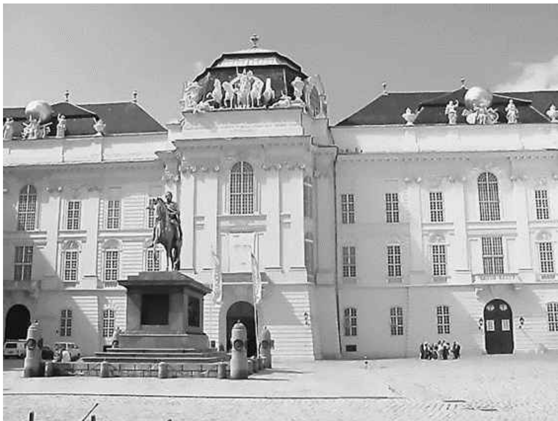
Придворная (ныне Национальная) библиотека