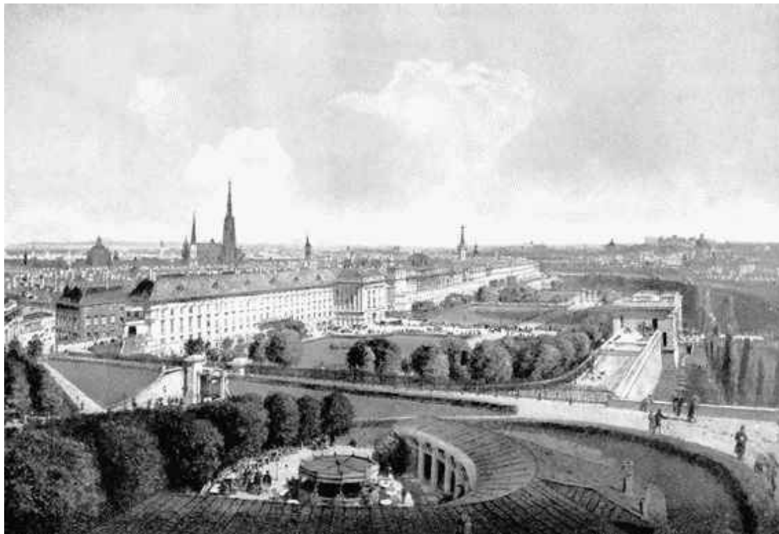
Венские крепостные валы, превращенные в прогулочную зону. Фотография 1830 года

начал подумывать о его свержении. В ту пору (весной 1241 года) на земли Европы вторглись монголы, и страх перед кочевниками заставил воюющие стороны искать пути примирения. Император обещал даровать Бабенбергам королевское достоинство и принял решение о включении всех завоеванных Фридрихом областей в состав Австрии. Однако в 1246 году последний Бабенберг был ранен в бою с дунайскими мадьярами и вскоре умер, не успев позаботиться о потомстве.