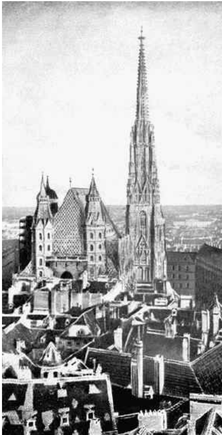
Готическая Вена: шпили главного храма господствуют над остальными сооружениями средневековой части города

На протяжении своей долгой истории дом Габсбургов предоставлял королей не только Австрии, но и Чехии, Венгрии, Испании, Сицилийско-Неаполитанскому королевству. Члены этой династии были герцогами Тосканы и Модены, правили мелкими княжествами практически во всей Европе. Они выступали оплотом Германии в борьбе против Франции, защищали Европу от турок, являлись опорой папам римским в духовных битвах контрреформации. Название рода произошло от небольшой крепости Габихтсбург (от нем. Habichtsburg –