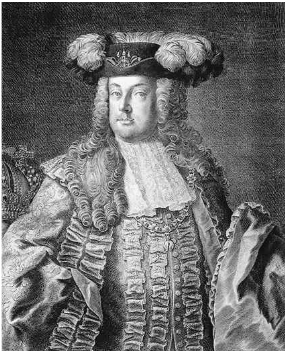
Император Франц I

По замечанию английского путешественника, в то время «императорская резиденция была в высшей мере превосходна, великолепна, роскошна». Как видно из форм и отделки дворцов XVIII века, все это показалось недостаточным императору Карлу VI, предпринявшему в Хофбурге перестройку небывалых масштабов. Задуманное требовало блистательных талантов, и монарх не скупился, приглашая именитых архитекторов, скульпторов и художников.