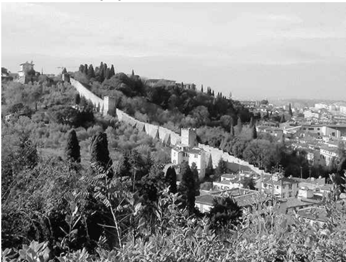
Флорентийская крепость давно на почетной пенсии

К периодическим бедам добавлялись и постоянные, например обычай кровной мести, заимствованный у варваров и укоренившийся в Италии под названием «вендетта». Одно из самых крупных ее проявлений произошло в 1010 году, когда флорентийцы напали на фьезоланцев в день почитаемого теми святого Ромула. Перебив мужчин, они разрушили крепость и ушли, уверенные в своей правоте: по непроверенным данным, нападение было совершено по просьбе или с согласия императора.