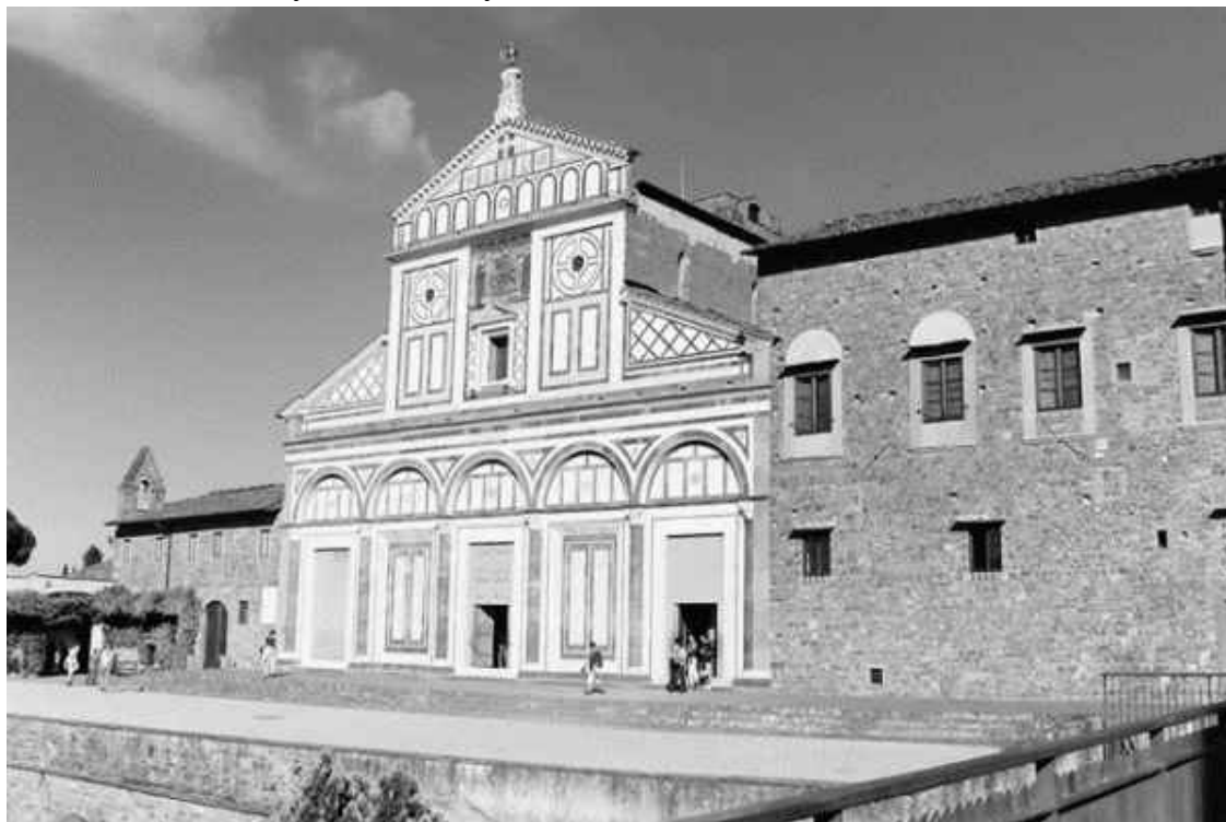
Церковь Сан-Миньято на горе

Одним из лучших произведений проторенессансного искусства ныне считается храм Сан-Миньято на горе, где некогда располагались Верхние Фезулы и где, по легенде, принял мученическую смерть святой Миньято. Церковные анналы называют этим именем армянского царевича, служившего в римском легионе и погибшего от рук варваров, не пожелав отречься от христианской веры. Часовня на месте его казни стояла еще с античных времен, а в 1018 году вместо полусгнившего деревянного строения заботами епископа Гильдебранда появилась каменная базилика, то есть собственно храм Сан-Миньято. Вначале он принадлежал монахи-ням-бенедиктинкам, но с 1373 года стал собственностью мужского братства того же ордена. Его строили, перестраивали и украшали еще 300 лет, пока фасад не приобрел благородный вид отчасти из-за формы, но в большей мере из-за цвета: облицовка белым и зеленым мрамором усилила яркость красок настенной мозаики «Христос на троне между Марией и Миньято». Конструктивной особенностью здания стали арки нижнего яруса, чьи пропорции вместе с приемом наложения на стену создали ощущение легкости.