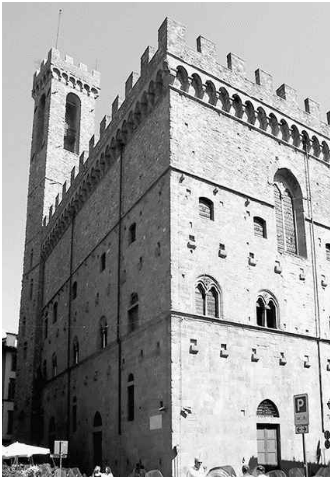
Барджелло – дворец капитано дель popolo