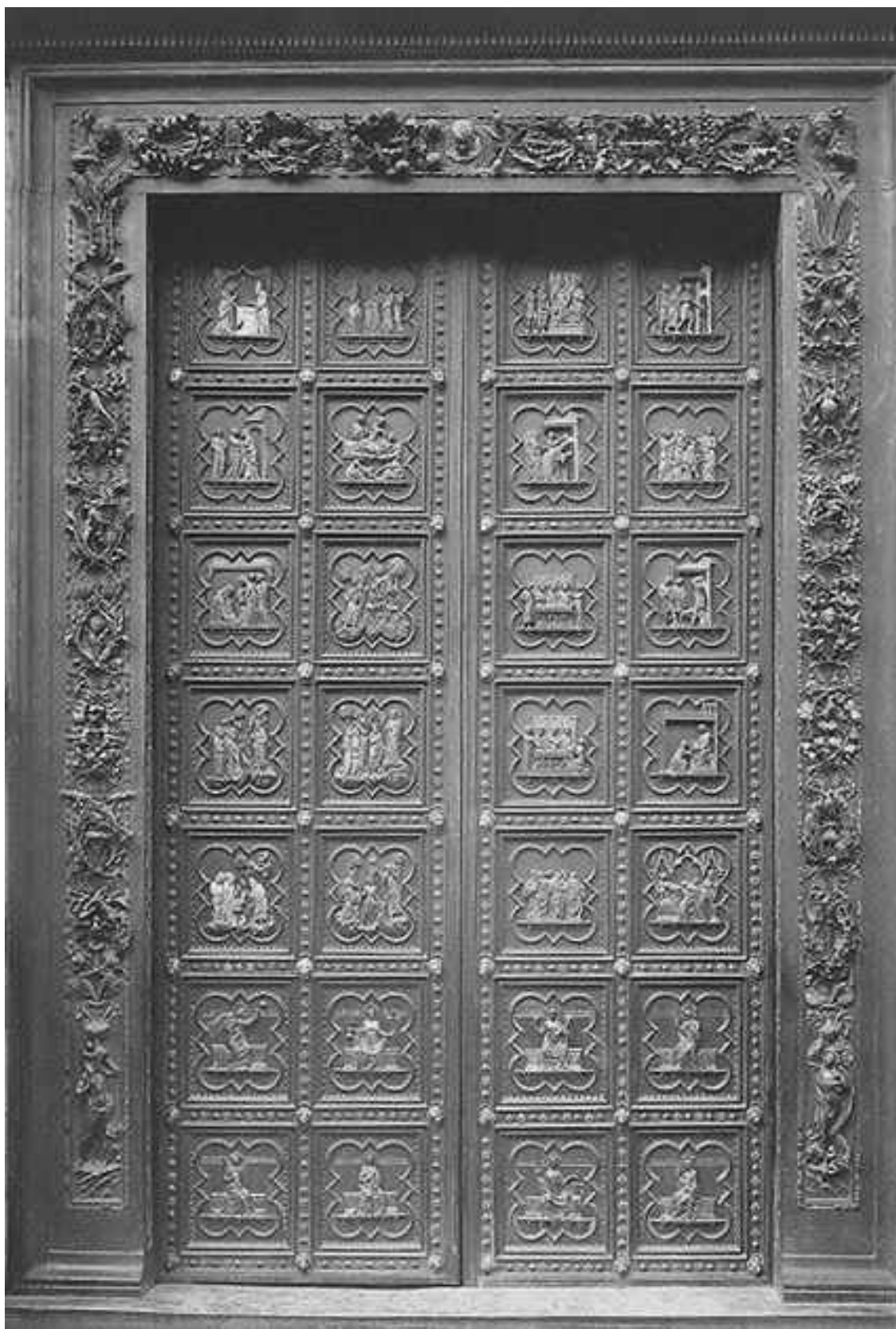
Скромные бронзовые двери Андреа Пизано