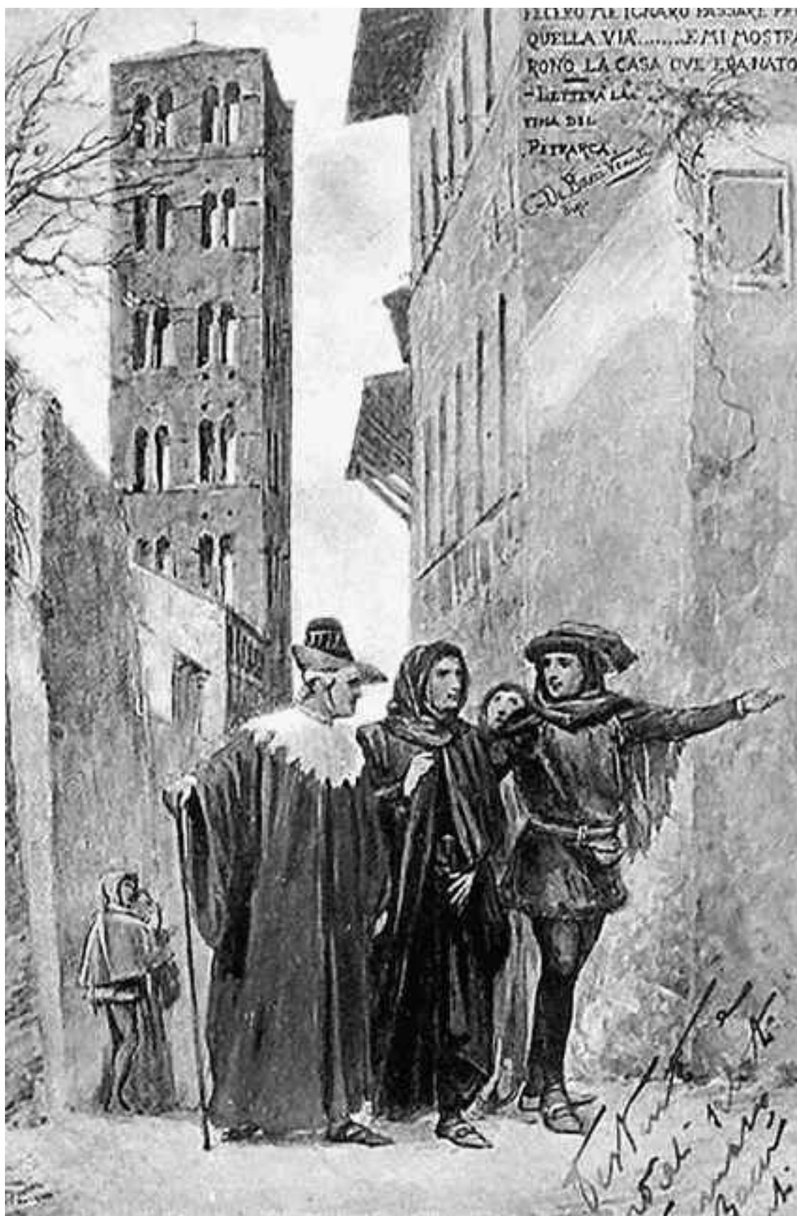
Группа заговорщиков (в центре Данте), которая пробирается по городу под покровом ночи. Средневековый рисунок