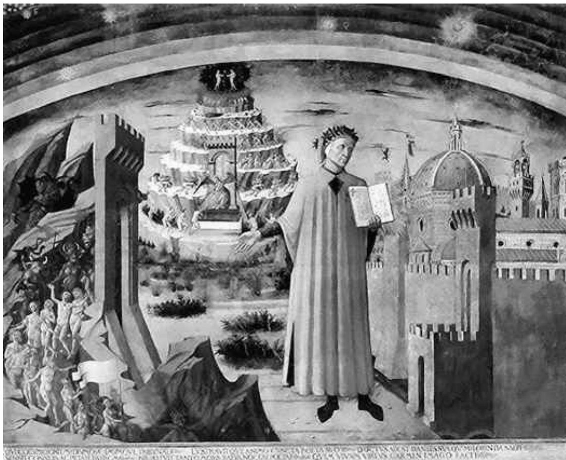
Данте, изображенный на фоне родной Флоренции