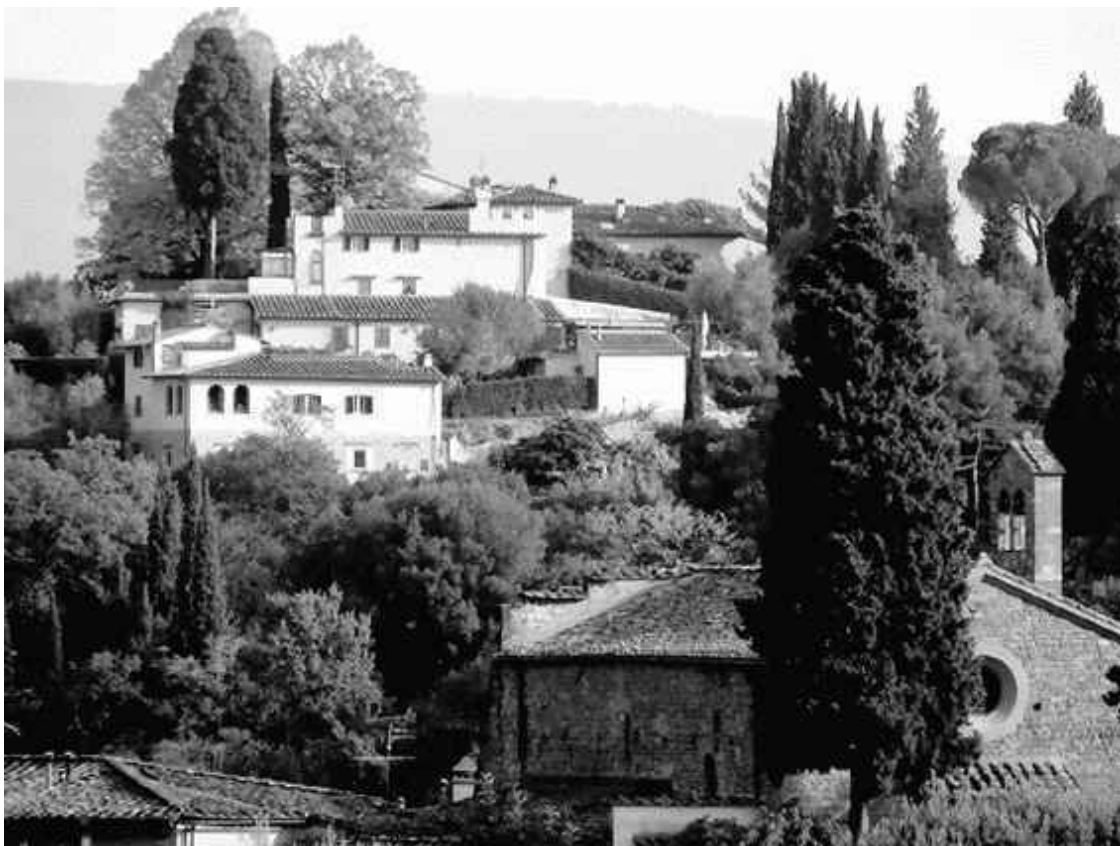
Одно из предместий Флоренции, теперь уже без замков, но с красивыми виллами