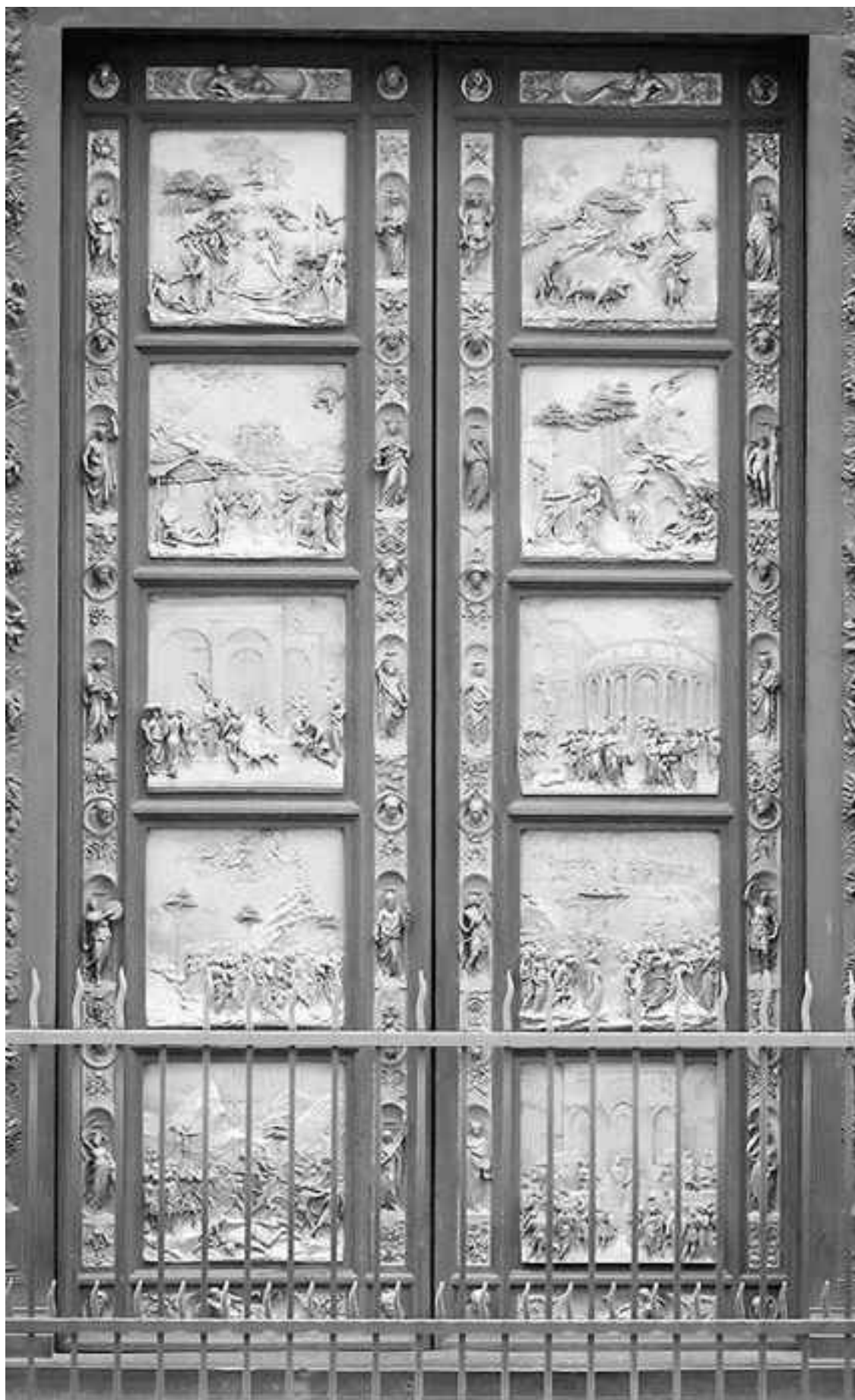
...и Порта ди Парадизо – Райские врата Гиберти