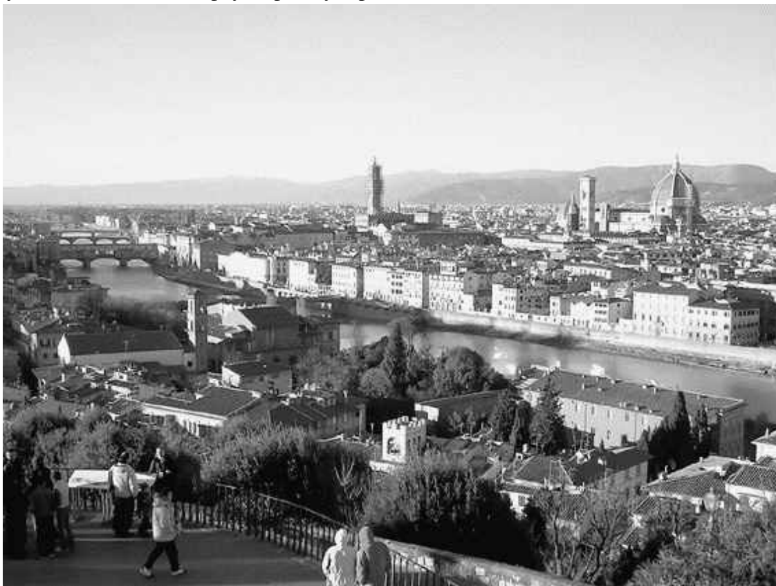
Вид с холма Сан-Миньято

Прежде чем начать прогулку по улицам и площадям тосканской столицы, стоит вспомнить Макиавелли и подняться на холм Сан-Миньято, откуда Флоренция видна целиком как на ладони. Воздух в здешних местах почти всегда сухой и прозрачный, поэтому четко просматривается даже то, что лежит у горизонта, то есть на северо-западе, где долина расширяется, открывая взгляду самую старую часть города – так называемый сакральный центр. Его легко узнать по колоссальному куполу храма Санта-Мария дель Фиоре, стоящего в окружении подобных ему шедевров архитектуры. С северо-востока к старым кварталам подступают Северные Апеннины, в этом месте невысокие, покрытые зеленью, которая вместе с синевой неба усиливает и без того яркую красоту строений.