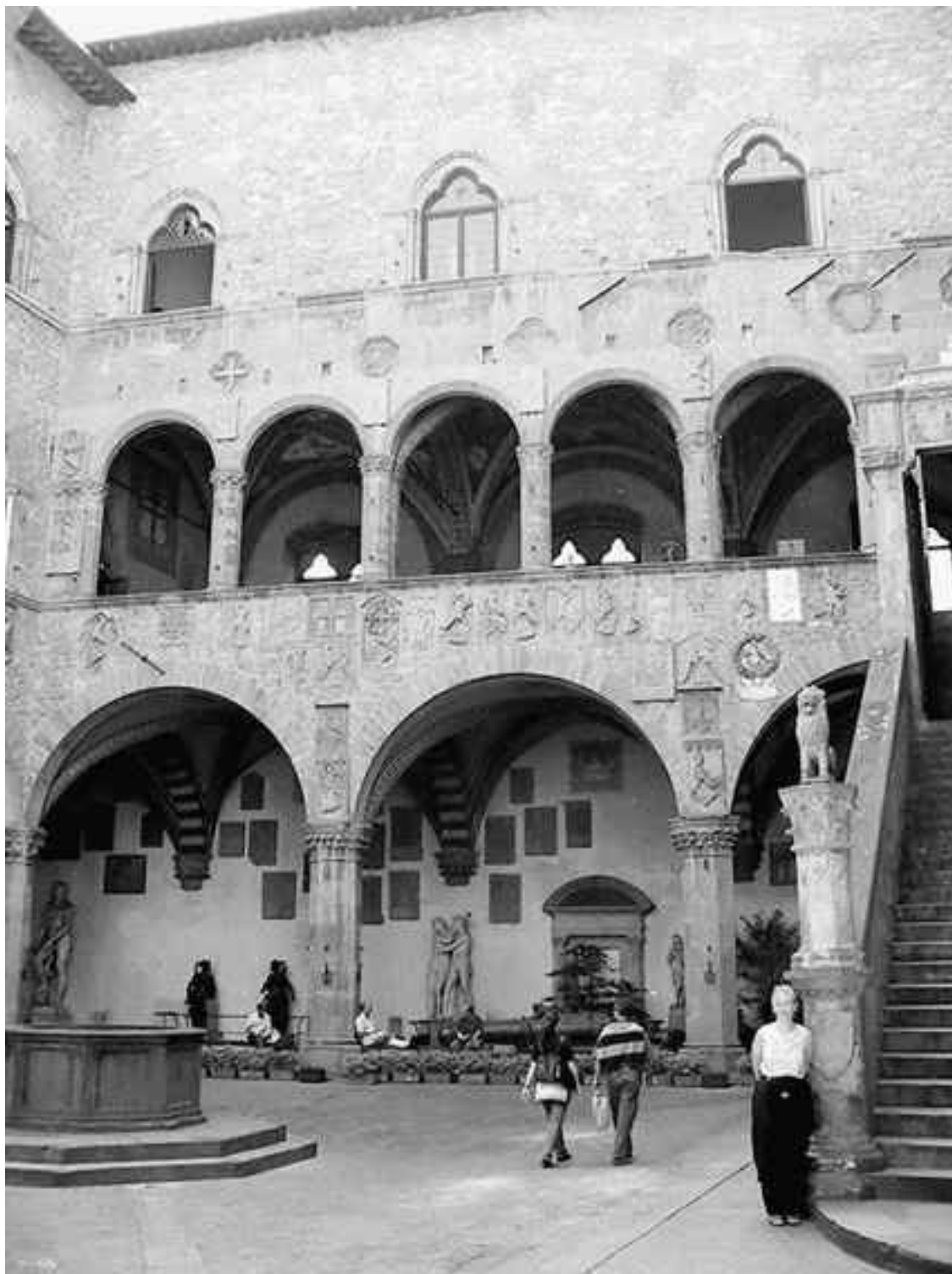
Внутренний дворик Барджелло

Хартия, подтвердившая свободу Флоренции, решила юридический вопрос, а регулирование экономики перешло от синьора к горожанам, которых представляли все те же консулы. В совете коммуны они являлись властью исполнительной, тогда как законотворчеством занималась креденца (от лат. consilia credentiae – «собрание доверенных»).