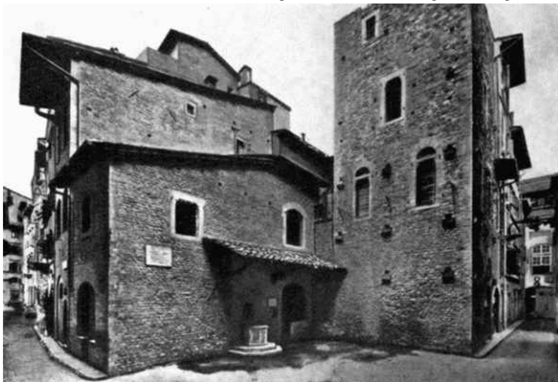
Капитановая башня – место заседаний глав Флорентийской коммуны

Однако, если вспомнить Макиавелли, «как в теле человеческом, чем в более пожилом возрасте завладевает им болезнь, тем она опаснее и смертельнее, так и во Флоренции жители поздно разделились на враждующие партии, зато больше пострадали от этого разделения». О причине первых раздоров соотечественникам поведал местный летописец Джованни Виллани в своем сочинении «Новая хроника или История Флоренции»: «...в 1177 году во Флоренции началась великая, доселе небывалая война между гражданами. Причины ее заключаются в привычке к слишком сладкой и безбедной жизни вкупе с гордыней и неблагодарностью. Дело в том что семейство Уберти, как самые могущественные и влиятельные граждане города, вместе со своими сторонниками из числа нобилей (знати) и пополанов (народа) взялись бороться с консулами, правителями и вождями коммуны, избираемыми на определенный срок и с определенными полномочиями, видимо, от зависти к неугодным им избранникам. Война была столь беспощадной и ожесточенной, что ни дня не проходило без стычек в разных кварталах...».