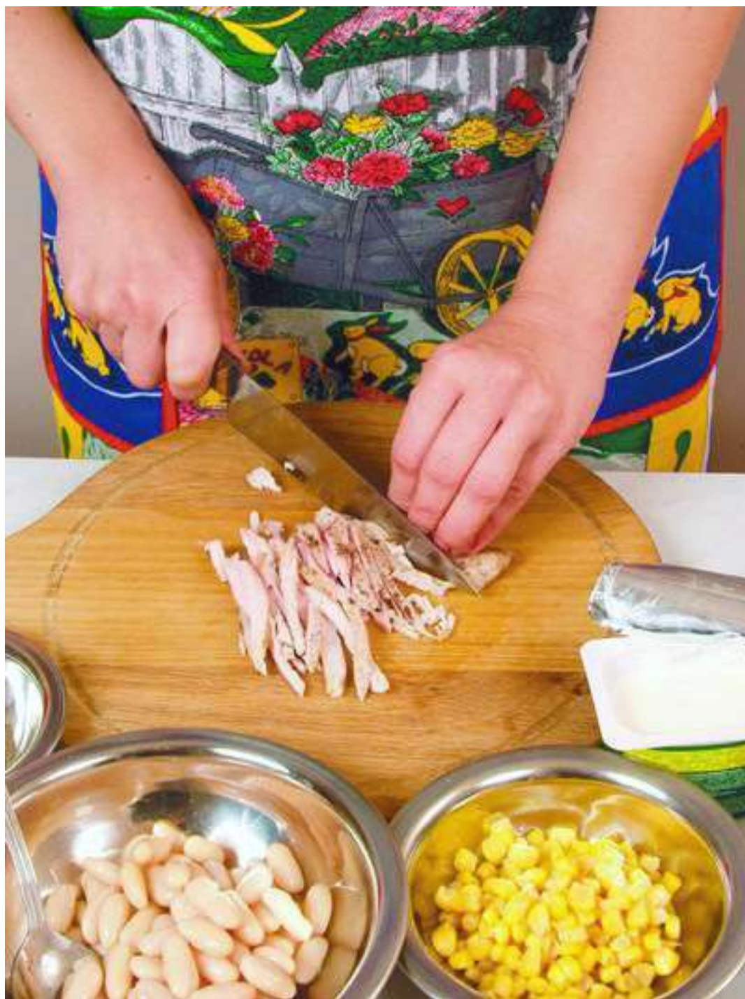
Предварительно обжаренное и охлажденное мясо курицы нарезать тонкой соломкой.