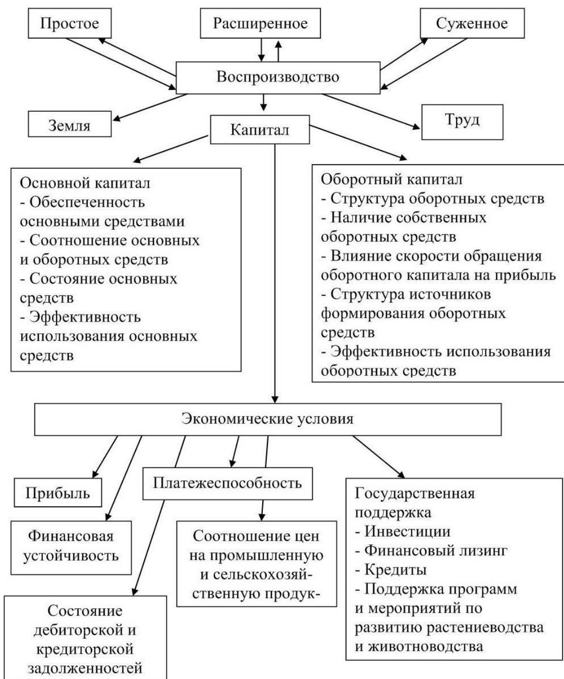
Рисунок 2 – Экономические условия воспроизводства в сельскохозяйственных организациях

На рисунке 2 схематично показаны экономические условия воспроизводства в сельскохозяйственных организациях.