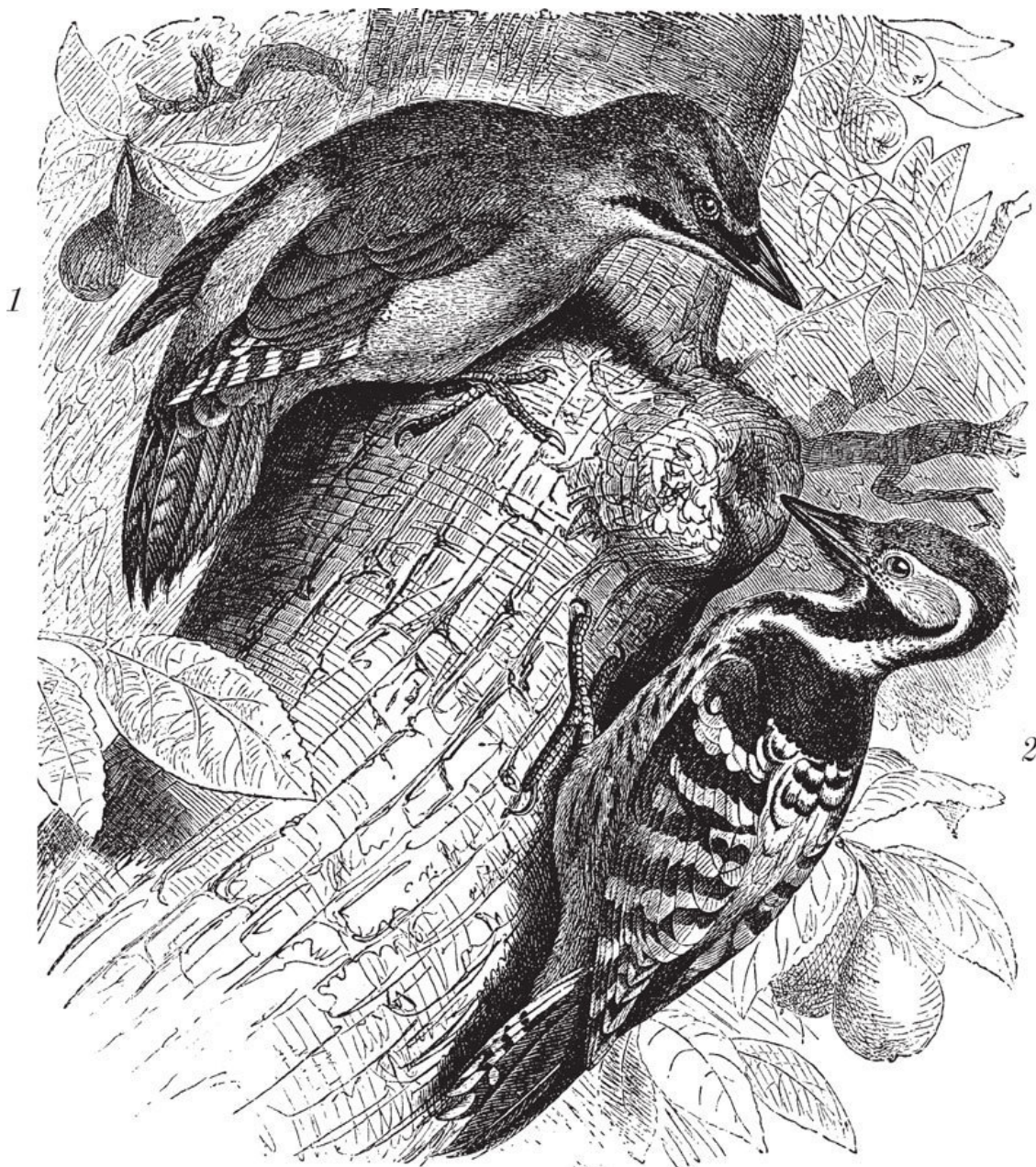
Дятлы: 1 – седой; 2 – белоспинный

буквально в щепки. (Я держал в руках эти щепки, на которых ясно можно было видеть следы клюва дятла.) Для предупреждения дальнейшего разрушения дачи пришлось прибегнуть к помощи ружья.