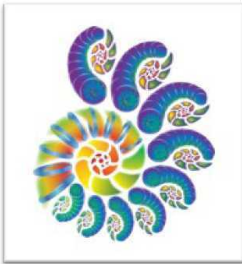
Рис. 2. Спираль Качеств

4. Точка схлопывания Спирали Качеств заполнена 22 Большим Арканом; описывает физическое тело человека