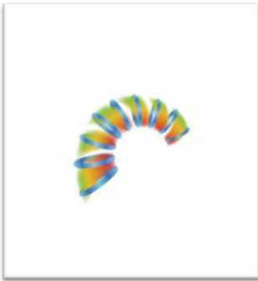
Рис. 4. Второй виток Спирали Качеств

Продолжая эксперимент и понижая активность ресурсов человека, в человеке выделяются психические свойства, как производные от биохимических: