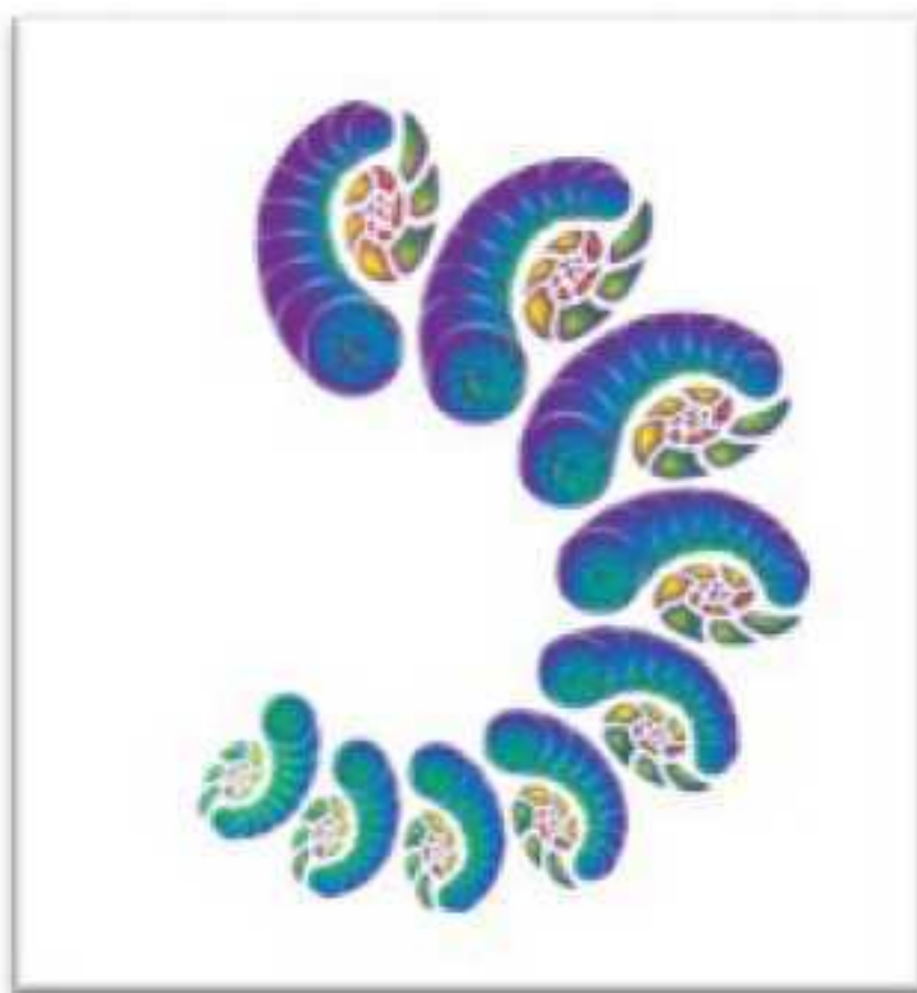
Рис. 3. Первый виток Спирали Качеств

Представим, что некоторый человек, находясь в искусственных условиях, достиг 100 % активности своего биологического ресурса. Он сам является базовой фрактальной формулой, описывающей все возможные свойства архитектуры человека. Далее предположим, что активность его психики понижается, и зафиксируем стабильные состояния, возникающие в результате эксперимента. Согласно системы ТАРО, проявятся следующие стабильные состояния: