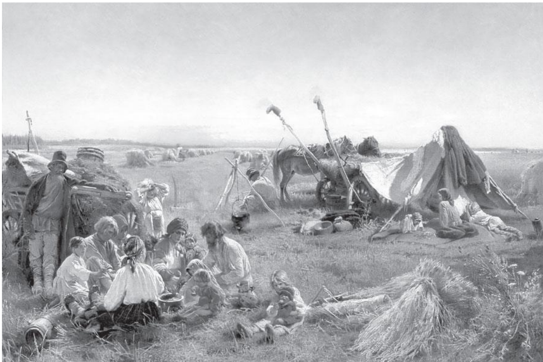
К. Маковский. Крестьянский обед в поле, 1871. Во время уборочных работ крестьяне проводили в поле весь день