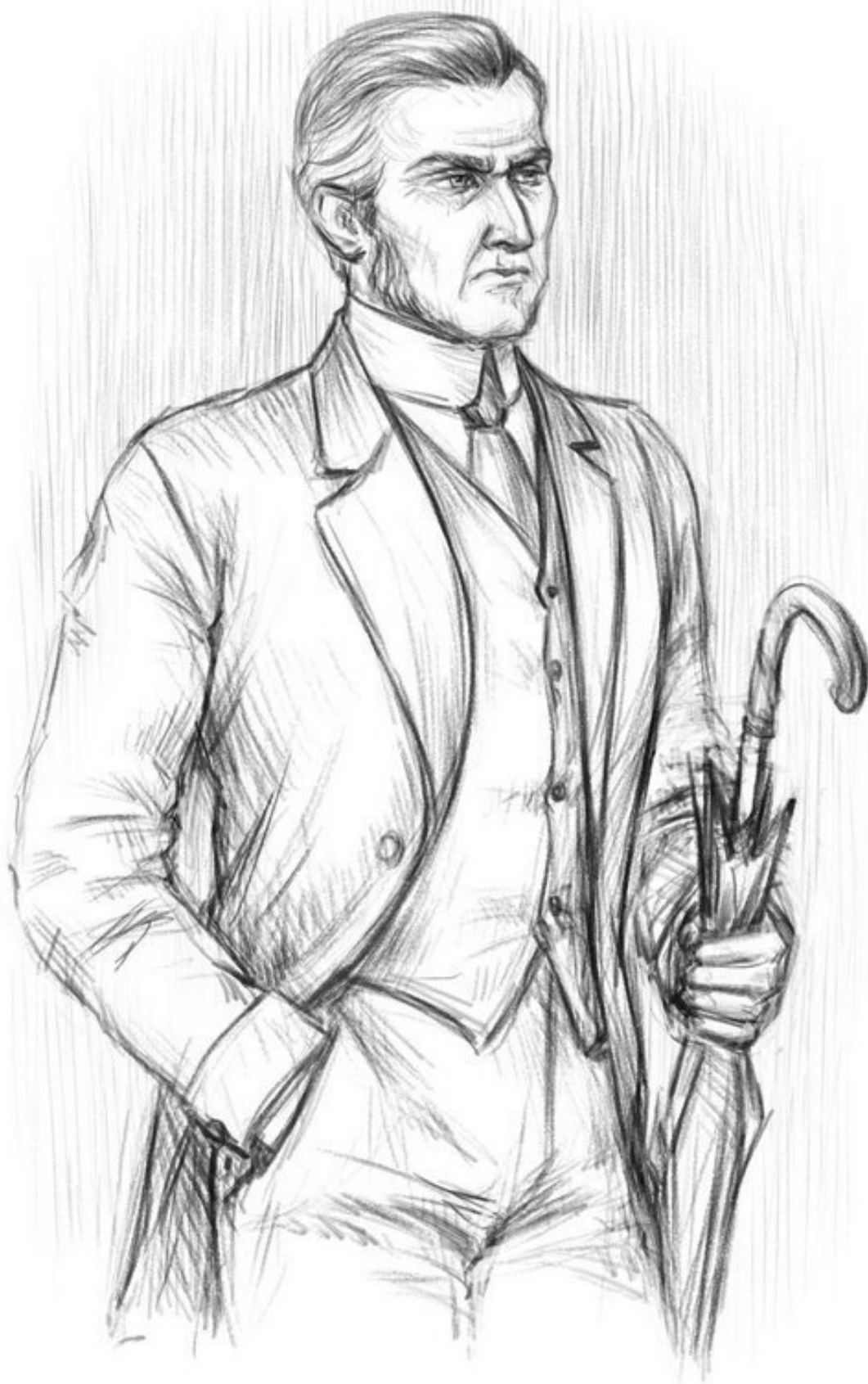
Джон Уильям Кембридж