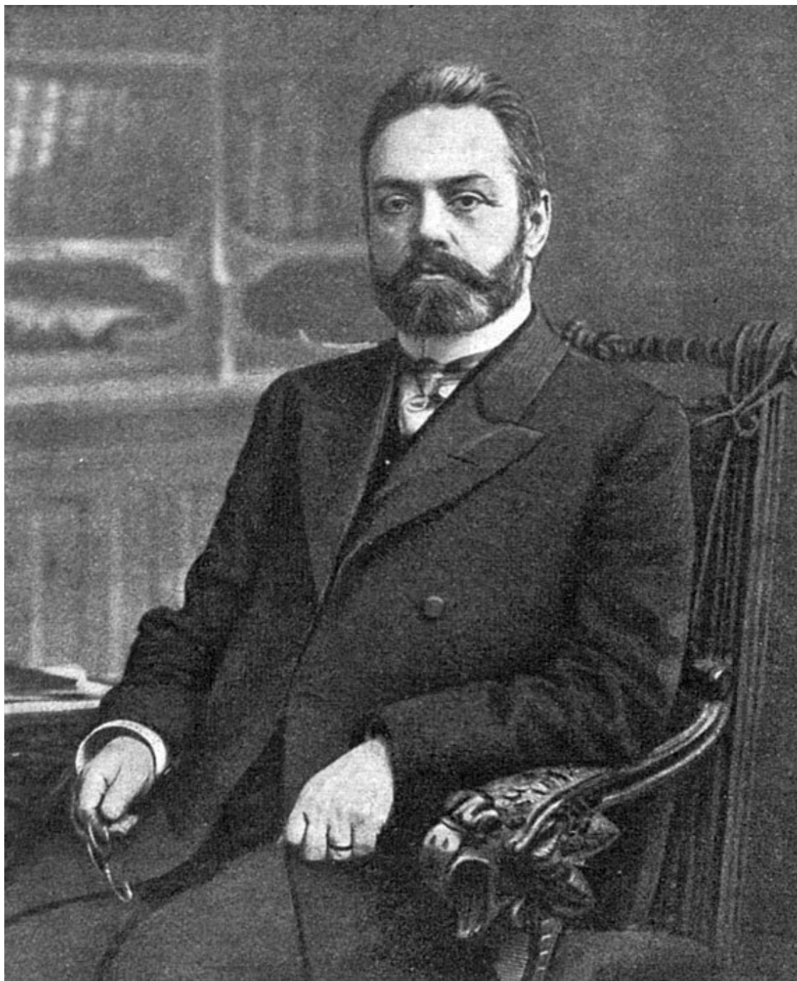
А. И. Гучков