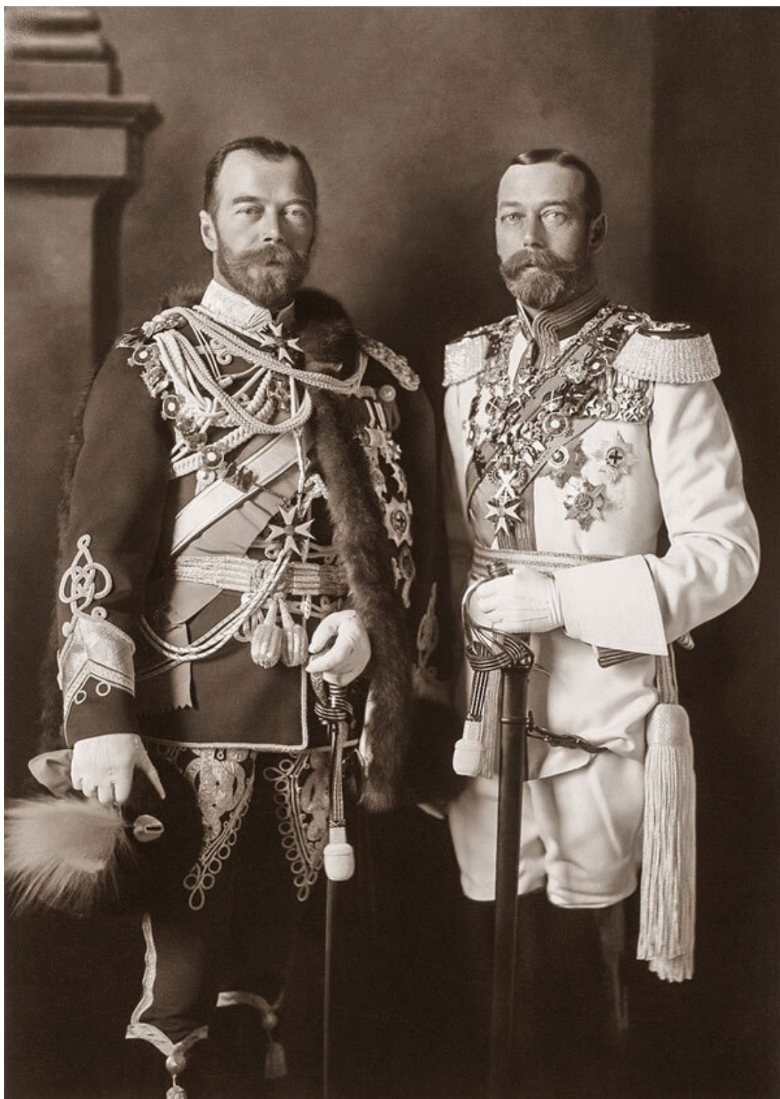
Николай II и Георг V в Берлине

Можно продолжать бесконечно. Ах, как сладка была бы долгожданная победа русского оружия в Великой войне, как желанна и заслуженна! Добыта доблестью десятков тысяч храбрых сынов народов России. Обильно политы нашей кровью поля Галиции и Мазурские болота. Выкошена почти вся кадровая русская гвардия, цвет офицерства полег. Заслужили ли мы победу? Конечно! Но вот то ли англичане, то ли немцы, то ли большевики, а может, все они