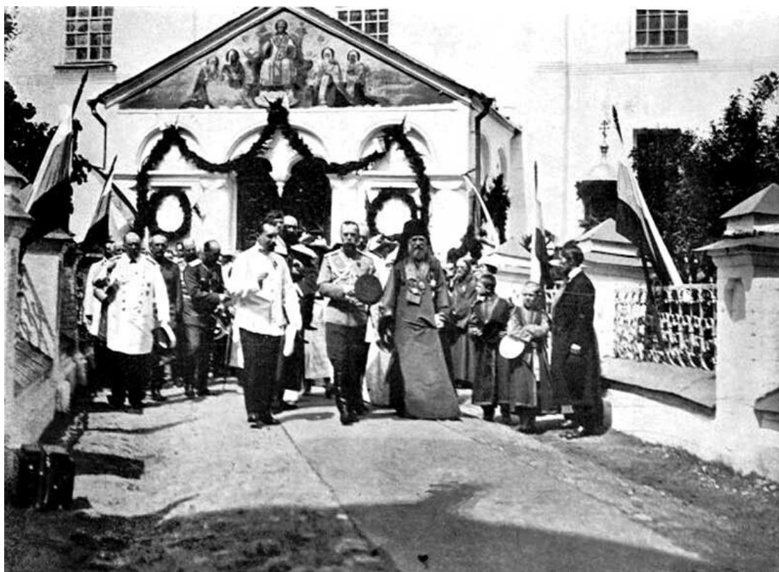
Представление делегации Союза русского народа императору Николаю II

Бесконечное множество «почему». И все они остаются без ответа. Да, задним умом мы все крепки. Очевидно, Николай отнесся несерьезно к поступку Милюкова. Быть может, он верил, что присягнувший ему лично Союз русского народа сам разберется с охамевшим вконец депутатом и его прихлебателями. Вполне вероятно, он рассчитывал, что вопли Милюкова никого с пути истинного не собьют. Так или иначе, но драгоценное время было бездарно потеряно.