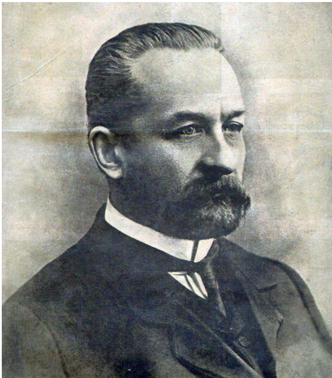
Князь Г. Е. Львов. Толстолец во главе правительства воюющей страны

Пару князю Львову в этом танго «Мальчики, не боящиеся грозы» составлял Гучков. Это не просто хороший человек, а исполин разума. Чрезвычайно деятельный был персонаж. Заговор ткал на зависть всем иваново-вознесенским ткачихам. Не покладая рук трудился. Всех привлек, кого знал. Даже те, кто отказался участвовать в этой мерзости, оказались в дальнейшем запятнаны, ибо болтлив был депутат Гучков донельзя. Все, что знал он, знал и весь Петроград, и не только. На этом достижения заканчиваются. Милюков в собственных воспоминаниях не скрывал грусти: «Гучков не поддержал своей прежней репутации. Я ожидал встретить в нем союзника. Но он держал себя в стороне, нечасто участвовал в заседаниях кабинета и, очевидно, вел свою собственную линию» .