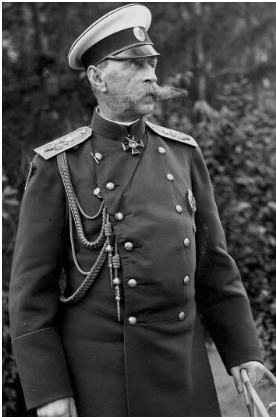
Граф В. Б. Фредерикс. Министр двора Николая II

Этим словам Николая II выпала счастливая жизнь. Кто только их не цитировал за прошедшие 100 лет! Кто только не искал в них вдохновения для описания роковых событий Российской империи! Но почти все старательно обходят один незначительный нюанс: а кто виноват? В самом деле, кто виноват, что в тяжелейший для страны момент не нашлось никого, кто взял бы на себя ответственность за веру, царя и Отечество? Кто держал на должности петроградского градоначальника Балка? Кто не разогнал Государственную думу сразу после речи Милюкова? Кто упорно не хотел принять единственно здравый план действий, предложенный генералом Алексеевым? Да, кругом измена. Тут не поспоришь. Но трусость-то – чья? И чей обман?