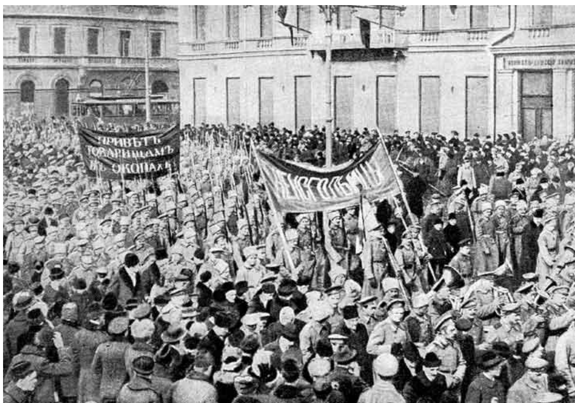
Солдатская демонстрация в Петрограде в феврале 1917 года

В Петрограде начинается бунт, который сопровождается характерными требованиями «Долой самодержавие!» и «Долой войну!» Царь уезжает в Ставку. Его почему-то совсем не тяготит обстановка в столице. Он почему-то хочет верить, что в Государственной думе его очень любят. А есть еще и революционные партии, которые его очень сильно не любят. И подобная обстановка может быть ими сполна использована для своих целей. Тем более что начинаются стычки демонстрантов с казаками и полицией. Это уже революционная ситуация в классической форме. Уже и всеобщая забастовка началась. Его величество никак не реагирует.