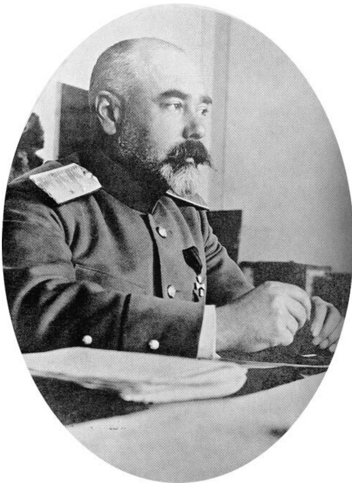
Генерал-майор А. И. Деникин