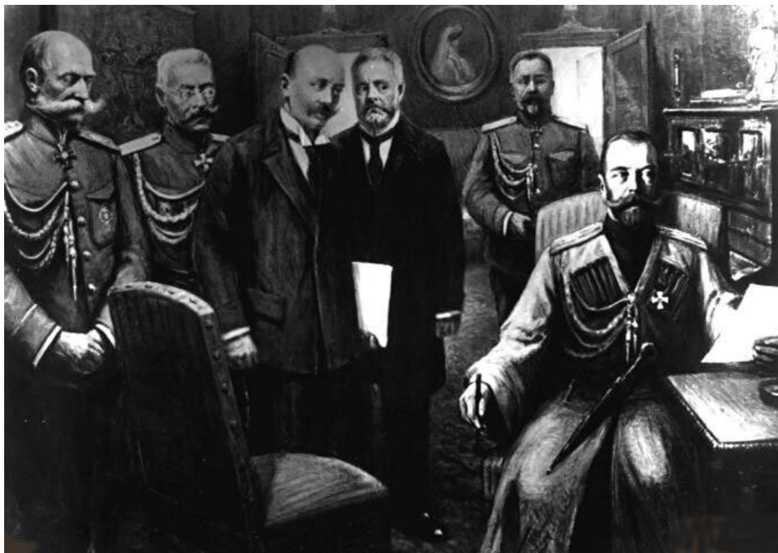
В. В. Шульгин (третий слева) в момент отречения. Ирония судьбы: он был убежденный монархист

Граф Фредерикс – убежденный монархист. Последний министр Императорского двора Российской империи. Прожил после революции еще 10 лет. У него была масса возможностей разоблачить невиданную в мировой истории подлость: обманули помазанника Божьего. Нельзя утверждать, что он круглые сутки находился под контролем чекистов. Во-первых, реалии начала 1920-х годов были несколько иными, чем в 1937-м. А во-вторых, граф Фредерикс в 1924 году покинул родину и переселился в Финляндию. Выражаясь языком монархистов – что нынешних, что прежних, – в страну, свободную от красной заразы, от коммунистической сволочи. Рядом – хорошо знакомый графу генерал Маннергейм. Вопрос: кто мешал Фредериксу сорвать покровы и разоблачить отречение, которого якобы не было?