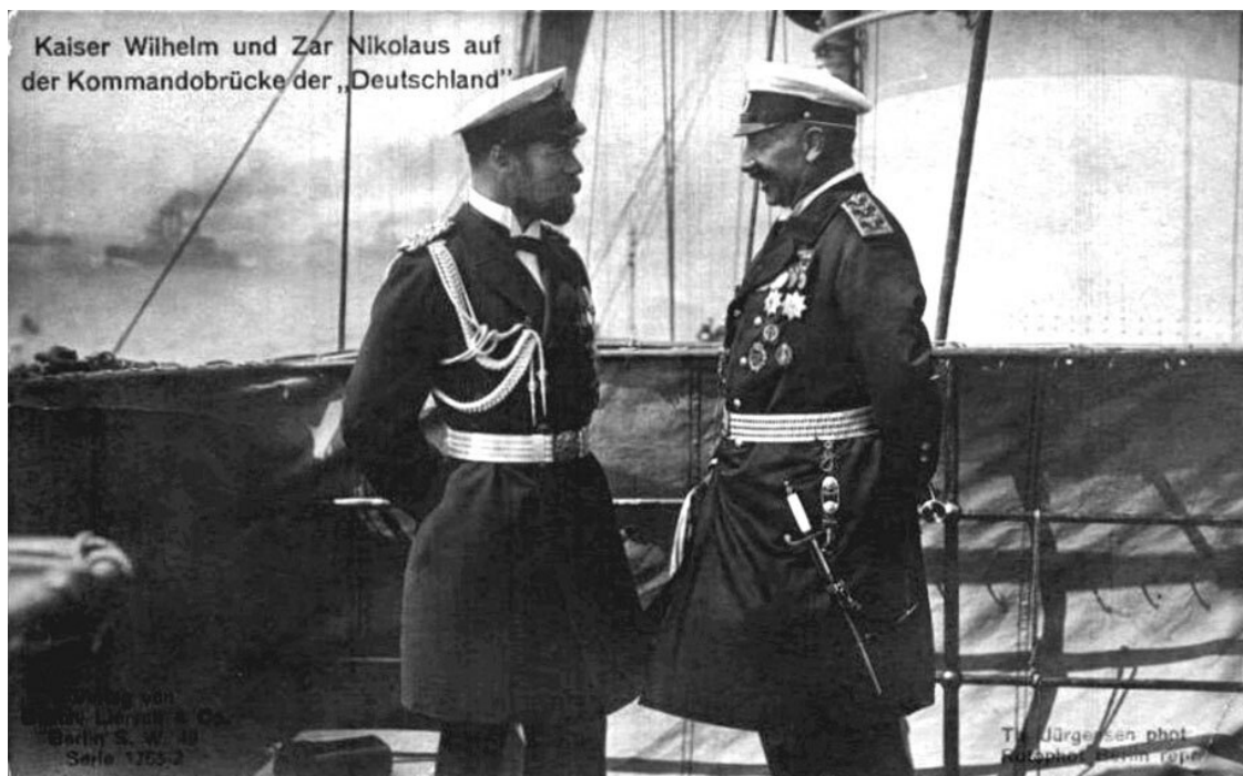
Николай II в немецком мундире и Вильгельм II в русском мундире на флотских маневрах в Свинемюнде