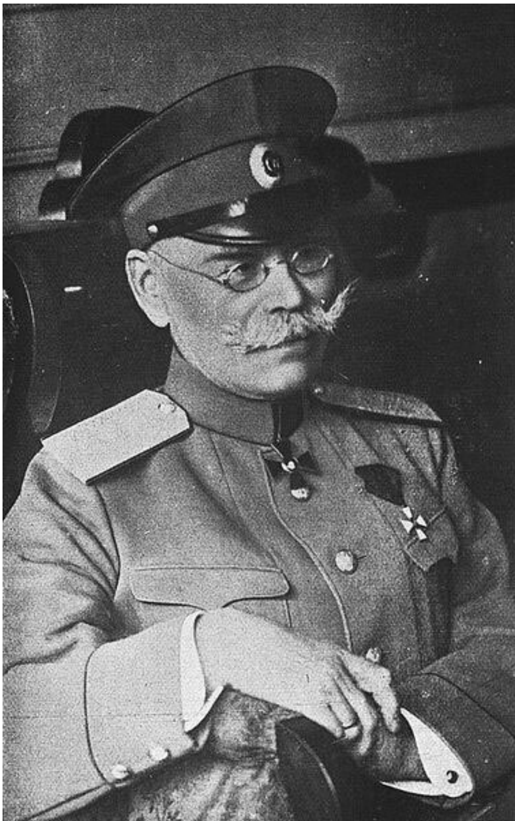
Генерал М. В. Алексеев

Больше всех не повезло с этой точки зрения генералу Алексеву. Несчастный старик до конца своих дней носил позорное клеймо заговорщика. А вся вина Михаила Алексеевича заключалась лишь в том, что он стал адресатом письма Гучкова, на которое даже не ответил. Но кого волнуют такие мелочи, если сам Гучков тут же раззвонил на весь свет, что и известный русский генерал теперь с ним заодно? Все ясно, Алексеев виноват. И генерал Корнилов будет