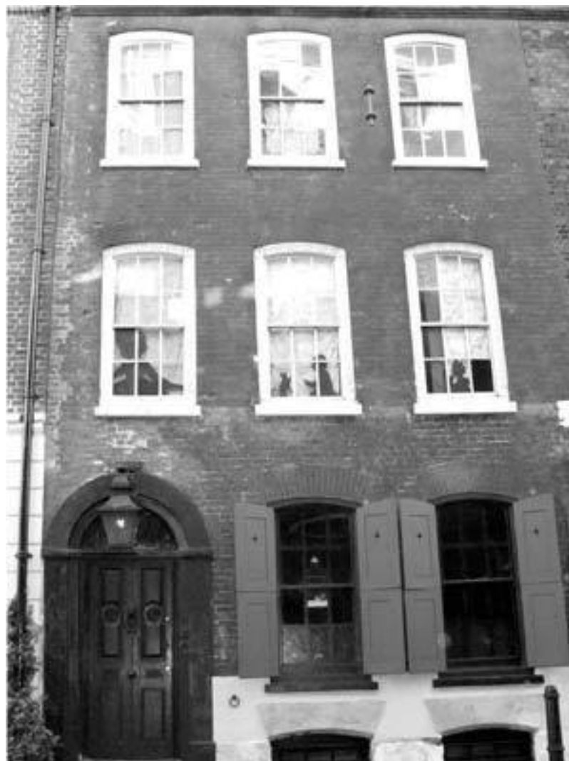
Фолгейт-стрит в Спитлфилдсе (Лондон): созданный в 1720-е годы городской дом этого типа воцарится на следующие два столетия. Спальни в таких домах, как правило, служили местом уединения.

Состоятельный джентльмен зачастую ночевал в своей гардеробной, когда возвращался поздно вечером после затянувшейся встречи с друзьями. Гардеробная дамы называлась будуаром (англ. boudoir , от фр. bouder — «дуться», «сердиться», «хандрить»). Идея отдельных спален, прижившись в домах богатых, вошла в моду: в начале XX века на аристократию стал равняться средний класс. Располагая более скромными возможностями, супруги, чтобы поделить пространство, спали в одной комнате, но на односпальных кроватях.