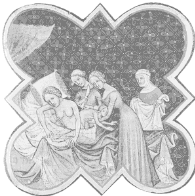
Средневековая операция по извлечению младенца из чрева матери путем кесарева сечения, проводимая в спальном покое роженицы.

В эпоху Тюдоров всем было известно то, что знают и нынешние приверженцы естественных родов: при разрешении от бремени помогает сила тяжести. В XVI веке королевы рожали на тронах с вырезанным сиденьем. Эти так называемые «кресла стонов» были обтянуты парчой и дополнялись медным тазом, в который падал послед. В распоряжении повитух, помогавших роженицам разных сословий, имелись и родильные кресла попроще. Некоторые из них были снабжены всякими усовершенствованиями – кожаными сиденьями, спинками с откидным механизмом или подлокотниками с ручками, на которые роженица опиралась при потугах.