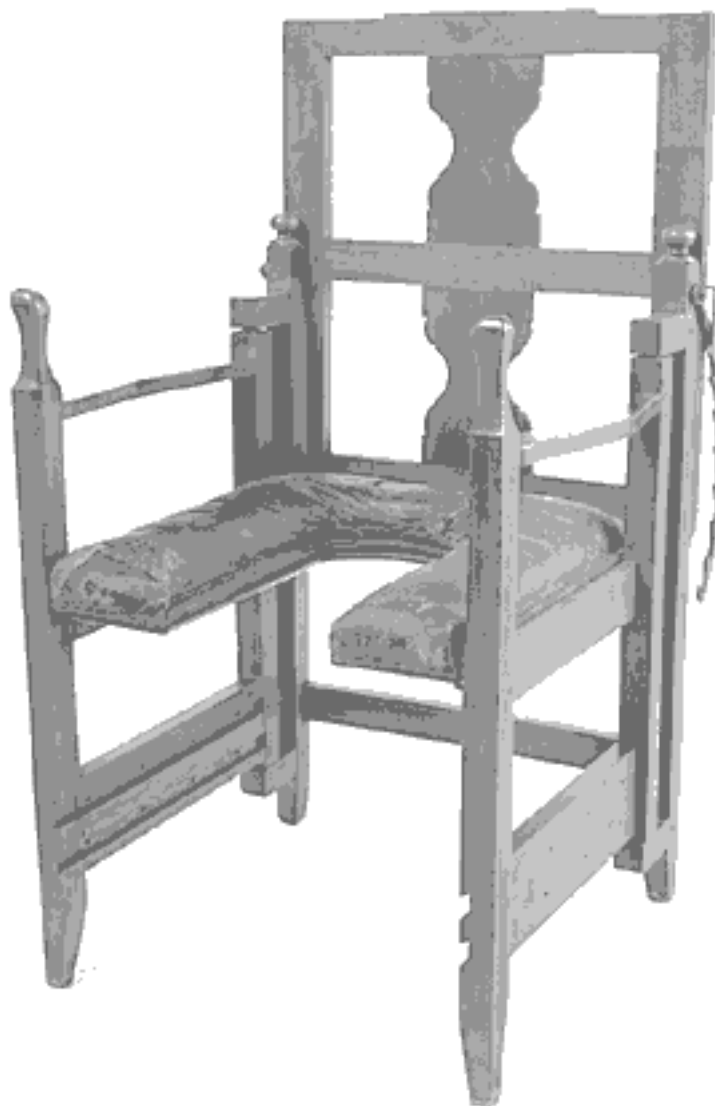
Родильное кресло XVII века из коллекции музея Уэллкома (Лондон).

По мере того как акушерская практика переходила от повитух к врачам-мужчинам, менялась и конструкция родильного кресла. Женщине было удобнее рожать в низком кресле, дающем ей возможность упираться ногами в пол, хотя повитухе приходилось сгибаться в три погибели и с вытянутыми руками ждать, когда появится головка младенца. Как только родовспоможением занялись врачи-мужчины (примерно с 1700 года), ножки у родильного кресла начали удлиняться. Высокое кресло было менее удобно для роженицы, зато врачу не нужно было наклоняться. В конце концов будущим матерям предложили тужиться лежа, а не сидя, то есть отказаться от использования силы тяжести. Как ни печально, подобное изменение ввели в обиход не в интересах пациенток, а в интересах врачей.