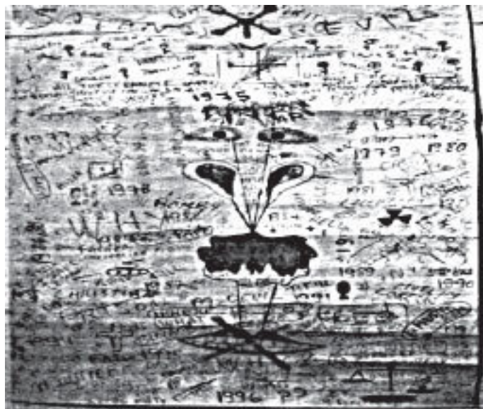
Рис. 1. Рисунок, созданный Арамом на начальном этапе арттерапии