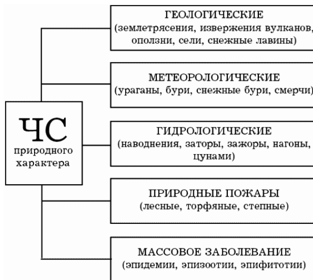
Рис. 1. Классификация ЧС природного характера

Различают природные (рис. 1), техногенные (рис. 2) и экологические (рис. 3) ЧС.