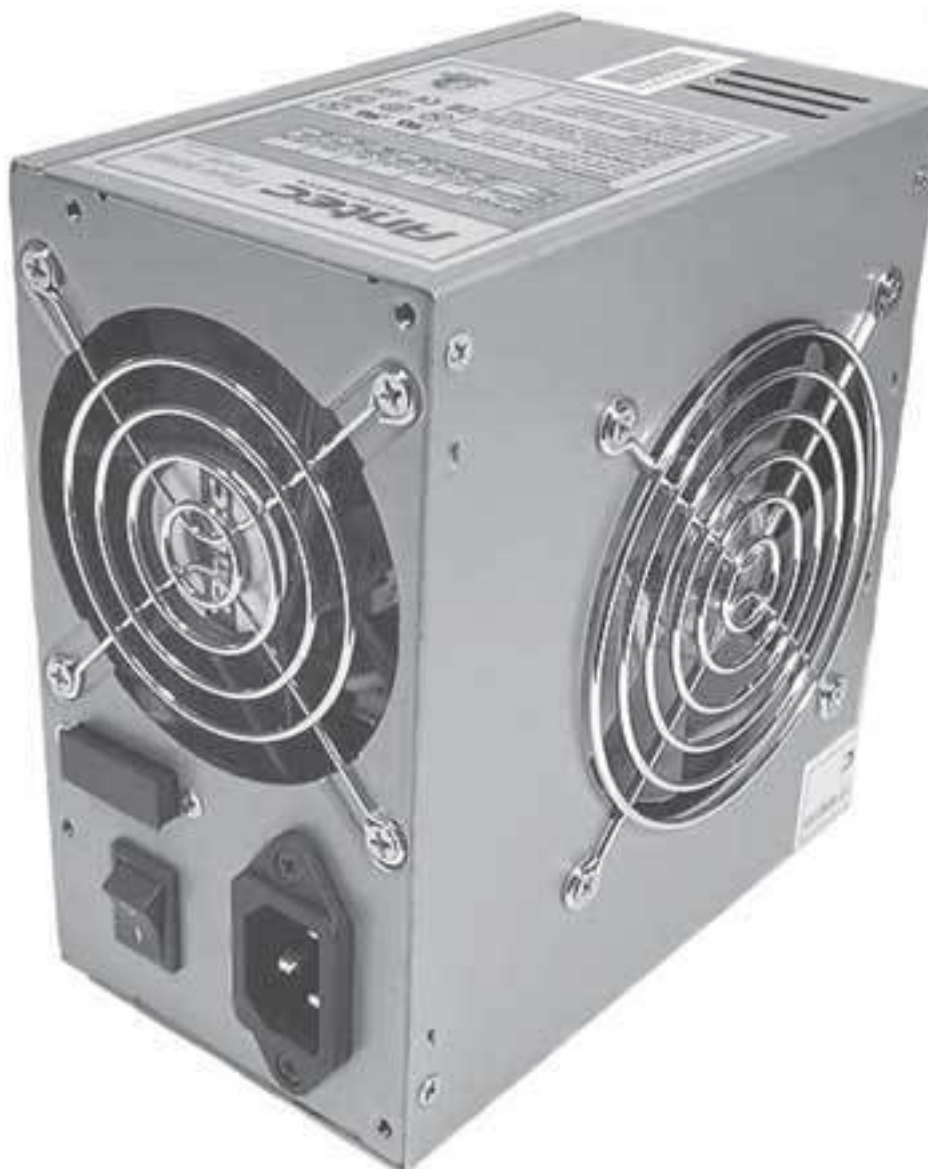
Рис. 1.1. Блок питания

Без сомнения, блок питания (рис. 1.1) – самый простой, но самый важный компонент компьютера. Он отвечает за снабжение стабильным напряжением всех устройств, установленных в компьютере (в том числе подключенных к USB-портам).