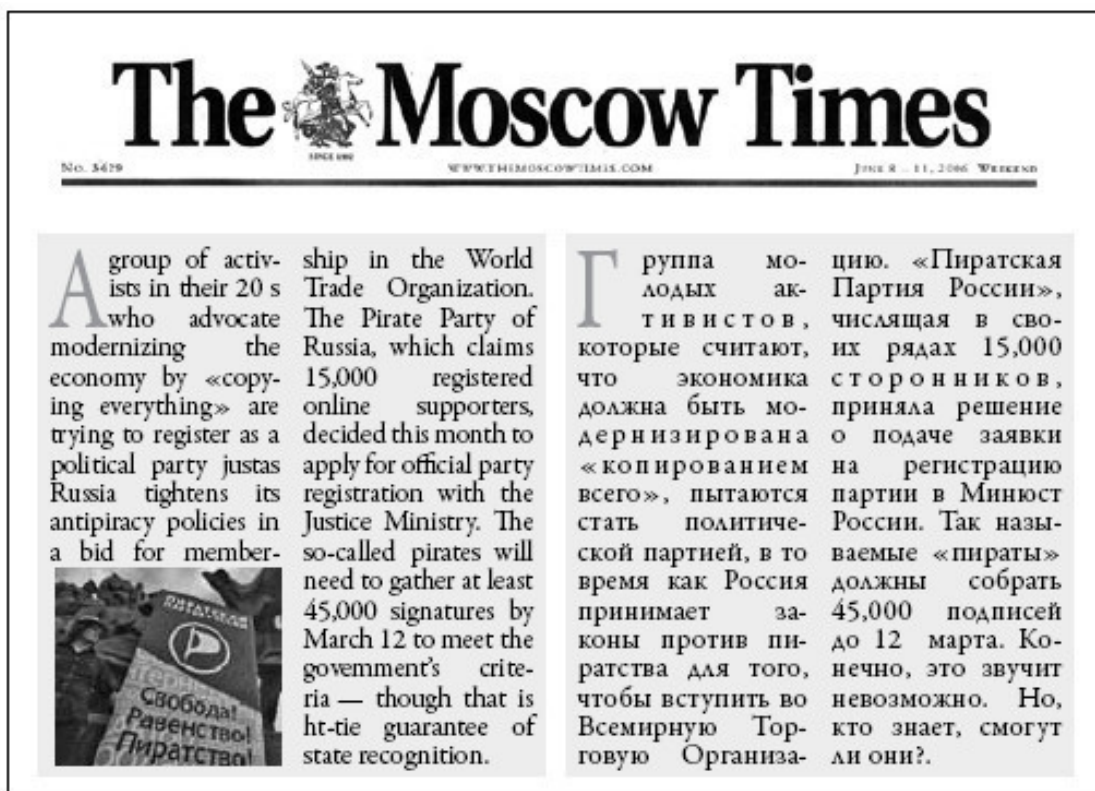
Фрагмент из статьи в российской газете «The Moscow Times» о Пиратской партии России

Остается их вообразать. Именно на этом основании понятие «виртуальной реальности» стало применяться ко всему «воображаемому и изображаемому». В своем истоке понятие «виртуальное» отсылает к возможному и вероятному. Виртуальное означает вымышленное, но не всякое вымышленное виртуально. Только вымышленное по правилам явно сформулированной логики может стать виртуальным. Это не обязательно должна быть программная логика компьютеров. Это может быть логика создания имиджа, дизайна, маркетинга, политологии и прочих процессов производства соблазняющих целей. Именно логика связывает ряд брендов в единый согласованный кластер – тренд.