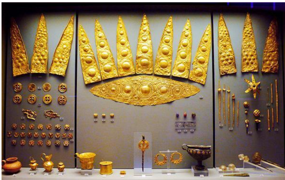
Выставка Микенских сокровищ в Лондонском музее

Это детали уже новой истории, когда повсюду шло исследование исчезнувших народов, городов, культур.