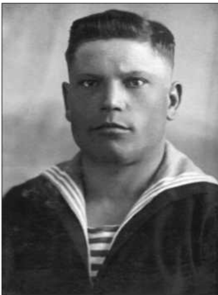
Автомеханик 12-й КОИАЭ