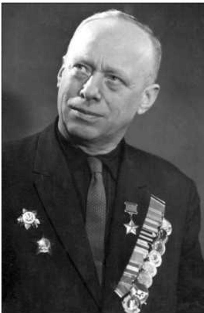
Герой Советского Союза Александр Иванович Нефёдов

Так он и сделал. На спасение послали лётчика Губрия, наводящим полетел тот же Нефёдов. Самолёт Губрия посадил на лёд, а в воздухе его прикрывал Нефёдов.