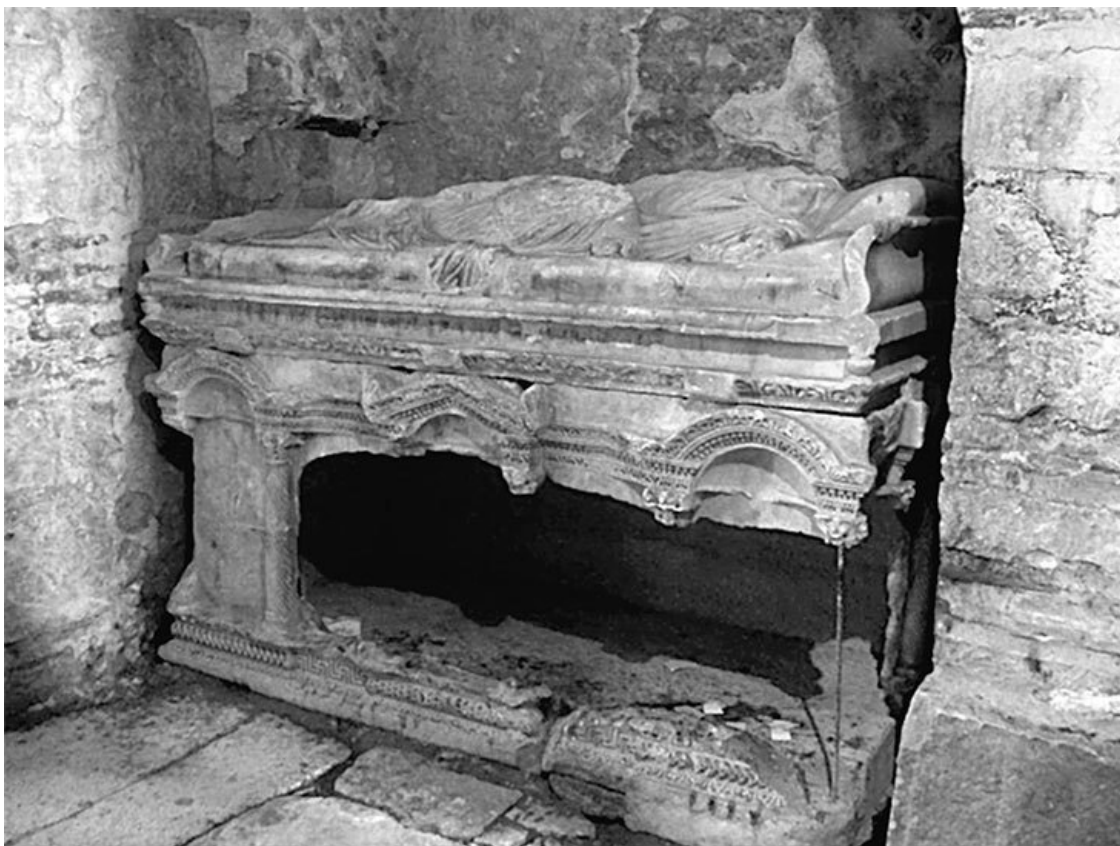
Саркофаг, в котором предположительно покоились мощи Святителя Николая до перенесения их в г. Бари (Италия)

Около 345 г. архиепископ преставился. Его гробница стала источать благовонное миро, туда потянулись многочисленные паломники, происходили исцеления. Одно из первых посмертных чудес связало св. Николая с территорией нынешней России. Группа людей, живших в устье Танаиса (Дона), тоже решила посетить Миры, снарядила корабль. К ним перед отплытием обратилась незнакомая женщина, сетовала, что не может поехать сама, и просила передать от нее к гробнице драгоценный сосуд. Но на судно обрушились штормы, раз за разом отбрасывали назад. Паломники принялись молиться св. Николаю, и он сам подплыл к ним в лодке. Объяснил, что под обликом женщины скрывался нечистый дух, и мешает им тот самый сосуд. Его выбросили в море, и корабль благополучно достиг цели.