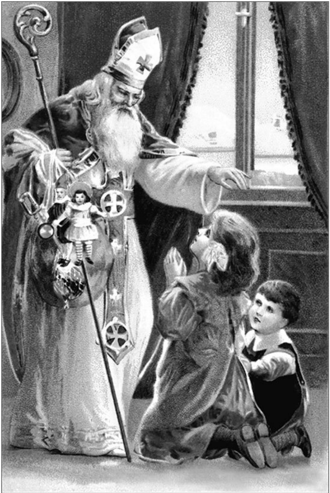
Святой Николай – Санта-Клаус

Хотя нетрудно увидеть, что духовная суть в данной традиции оказалась совершенно выхоленной. Ведь св. Николай приносил вовсе не подарки. Он спасал от гибели четыре