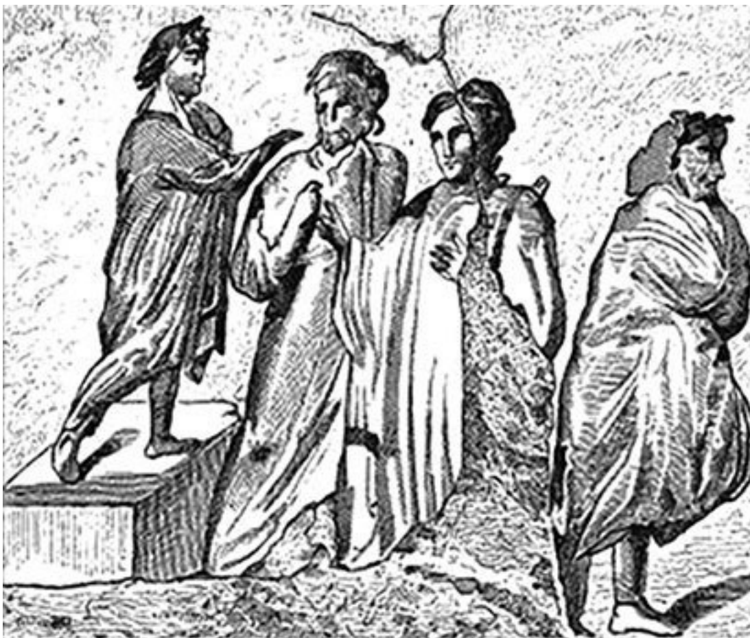
Суд над христианами. Рисунок на фреске из римских катакомб

Однако служение архиепископа в те времена означало не только почет и работу по устройству своей епархии. В 303 г. император Диоклетиан и его соправитель Галерий вспомнили прежние законы о запрете христианства, было издано четыре новых эдикта. Развернулись страшные гонения. Началась кампания в Никомидии, в день Пасхи там сожгли прямо в церкви массу собравшихся людей. Затем террор покатился по другим городам. Христиан хватали, подвергали пыткам, требуя отречься, за отказ обрекали на мучительные казни. Хоть и не сразу, кровавая волна дохлынула до Ликии. Вместе со многими прихожанами попал в темницу и св. Николай. Здесь добрый и скромный священнослужитель проявил себя железным борцом за веру. В переполненной камере терпел голод и жажду. Готовился принять мученический венец, укреплял в этом паству.