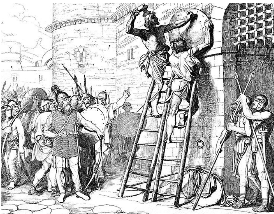
Олег прибывает щит свой к вратам Царьграда. Гравюра Ф. А. Бруни, 1839

А император и его военачальники не могли оказать помощи Солуни, потому что с севера в это время приближались войска Симеона и Олега. Что касается «колдовства» вождя «Росса», то его суть поясняют русские летописи. Когда появились тяжелые неприятельские корабли с «греческим огнем», Олег нашел способ уберечься от них. Приказал вытащить ладьи на берег. Там двигались его конница и обозы, и князь велел поставить лодки на повозки, везти по суше. Противостоять соединенным силам болгар и русичей Лев X был не в состоянии. Выслал делегации для переговоров. Впрочем, в запасе у императора имелось еще одно оружие. Почему бы не предложить «варварам» отравленные угощения? Но «колдун» Олег оказался не таким простаком, как представляли «цивилизованные» греки, распорядился не принимать от врага еду и напитки. Пришлось признать поражение, идти на уступки и откупаться.