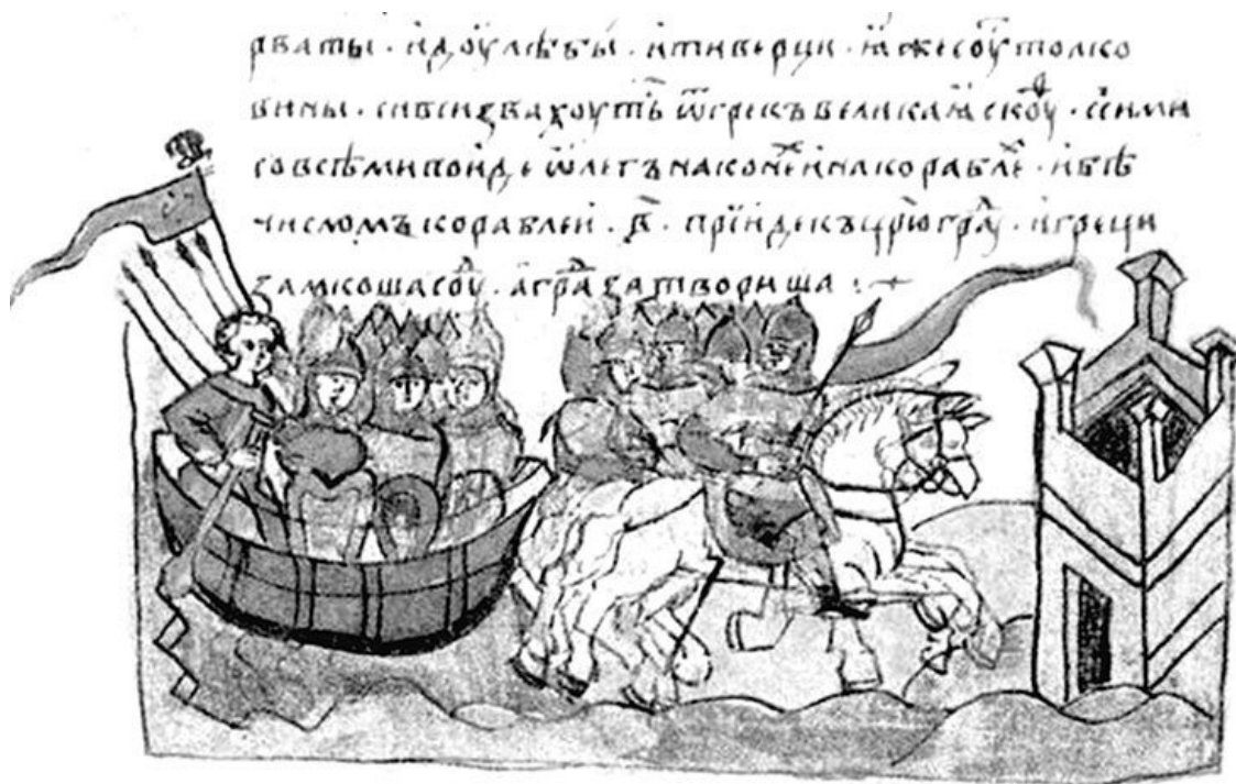
Поход Олега на Царьград. Миниатюра из Радзивилловской летописи

Вещий Олег тоже не упустил своего. Преследуя и вытесняя мадьяр, он присоединил к Руси Волынь и Прикарпатье, ему подчинились племена дулебов и белых хорват. Но подлыми методами он не пользовался. Напротив, предложил венграм примириться – мы вас не будем трогать, а вы нас. Изгнанники это оценили. Обживать на новых местах было трудно, и безопасность карпатской границы для них много значила. Но и для Руси подобный дипломатический поворот оказался крайне полезным. Из Паннонии орды мадьяр раскатились набегами по всем европейским странам, врывались даже в Италию, и лишь на русские владения они не ходили ни разу.