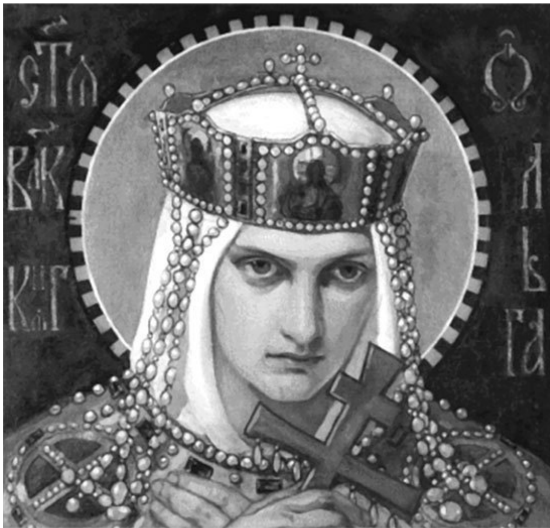
Н. А. Бруни. «Святая великая княгиня Ольга». 1901

В первой половине X в. на Руси еще не существовало постоянных административных структур. Князья и их наместники лично ездили в полюдья. Отправлялись каждую осень, двигались от селения к селению, собирали с населения «дань», т. е. подати. Попутно решали накопившиеся вопросы, судили, разбирали тяжбы. Изменила положение св. равноапостольная княгиня Ольга.