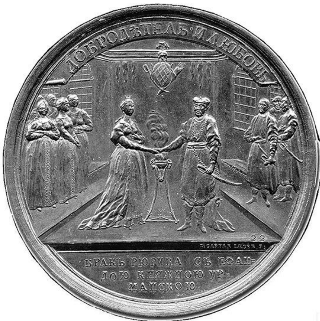
Медаль в память брачного союза с Ефандой, княжной урманской. Конец XVII – начало XIX вв.

На обратном пути князь посетил Норвегию. Здесь он присмотрел себе третью жену, норвежскую принцессу Ефанду. По возвращении в Ладогу сыграли свадьбу. Молодая супруга родила Рюрику сына Игоря. А правой рукой и советником князя стал брат Ефанды Одда, известный на Руси как Олег. Хотя может быть и так, что он еще раньше был приближенным государя и сосватал ему сестру. В 879 г. бурная жизнь Рюрика подошла к концу. Он начинал ее несчастным сиротой и изгоем – завершал повелителем многих городов и земель от Финского залива до Муромских лесов. Командовал горсткой бойцов на борту пиратского корабля – а умирал во дворце, окруженный домочадцами, сотнями придворных и слуг. Наследником остался сын Игорь, но он был еще ребенком, и место регента занял его дядя Олег.