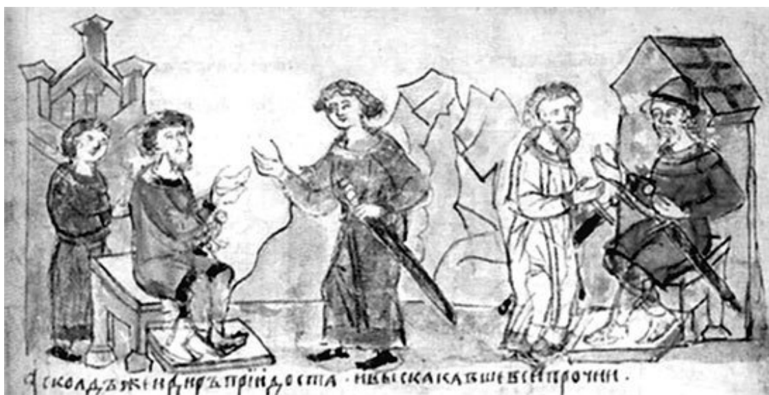
«Правление Аскольда и Дира в Киеве» Радзивилловская летопись

Варяги выполнили заказ. Ударили на подданных князя, кривичей, захватили Смоленск. Правда, развить успех не сумели, их остановили. Но цель Византии и Хазарии была достигнута, они стравили Ладогу и Киев. Поэтому Рюрик не стал продолжать боевые действия против каганата. Отправь он войска на Волгу, ему угрожал бы удар по тылам, с Днепра. Одолеть Аскольда и Дира тоже было непросто, за ними стояли две великие державы.