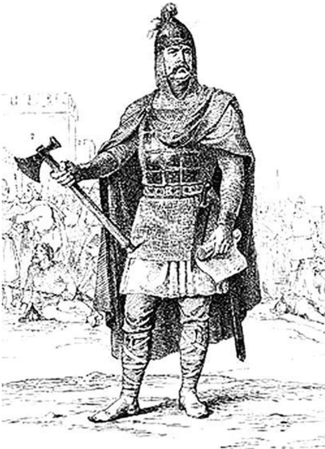
Олег I Вещий. Портрет в Радзивилловской летописи

Но летописи очень лаконичны. Они сообщают нам лишь скудные факты, излагают их весьма сжато. Так, в 883 г. Олег совершил поход на древлян и покорил их, в 884–885 гг. без боя подчинил северян и радимичей, данников Хазарского каганата, а затем начал жестокую и затяжную войну с тиверцами и уличами. В это время Киев подвергся мадьярскому нашествию, которое удалось отразить. Потом каким-то образом в состав державы Олега вошли дулебы и белые хорваты, обитавшие на Волыни и в Прикарпатье. И наконец, в 907 г. (по другим источ-