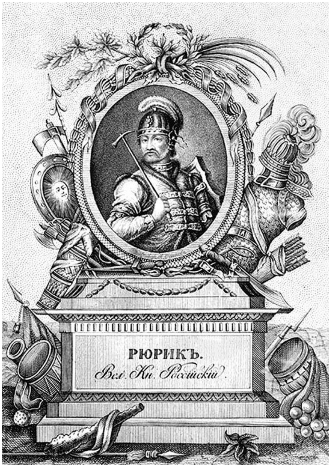
Князь Рюрик. Гравюра 1805 г.

Но... реально для возвращения наследства он не сделал ничего. Император был занят другими делами, разборками с Бретанью, Хорватией, войной с болгарами, церковными реформами. Даже внутри империи Людовик не мог толком навести порядок. Вместо этого поделил все владения между детьми, Лотарем, Пипином и Людовиком. Но потом овдовевший император пылко влюбился в молоденькую еврейку Юдифь, она произвела на свет четвертого сына