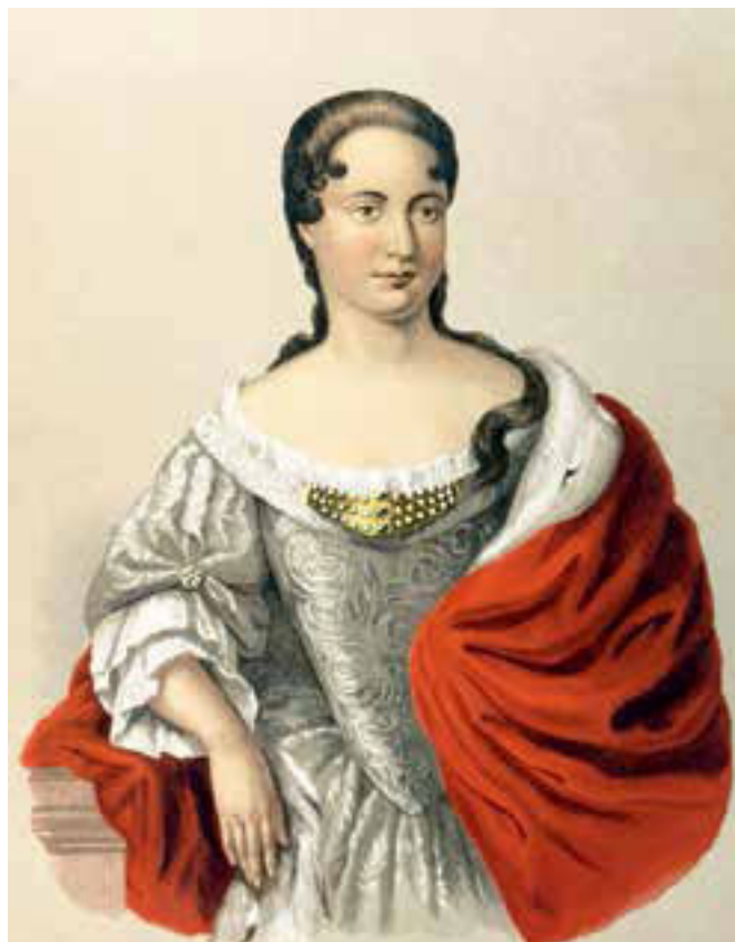
Мать – царица Прасковья Фёдоровна.

25 июня 1682 года сводные братья вместе венчались на русский престол. Так появилось соправление царей Ивана и Петра Алексеевичей. Третьим правителем-регентом была сама Софья, сошедшая с политической сцены в 1689 году. Впрочем, еще до своего заточения в Новодевичьем монастыре властная царевна успела женить брата, который сам «склонности к браку не оказывал».