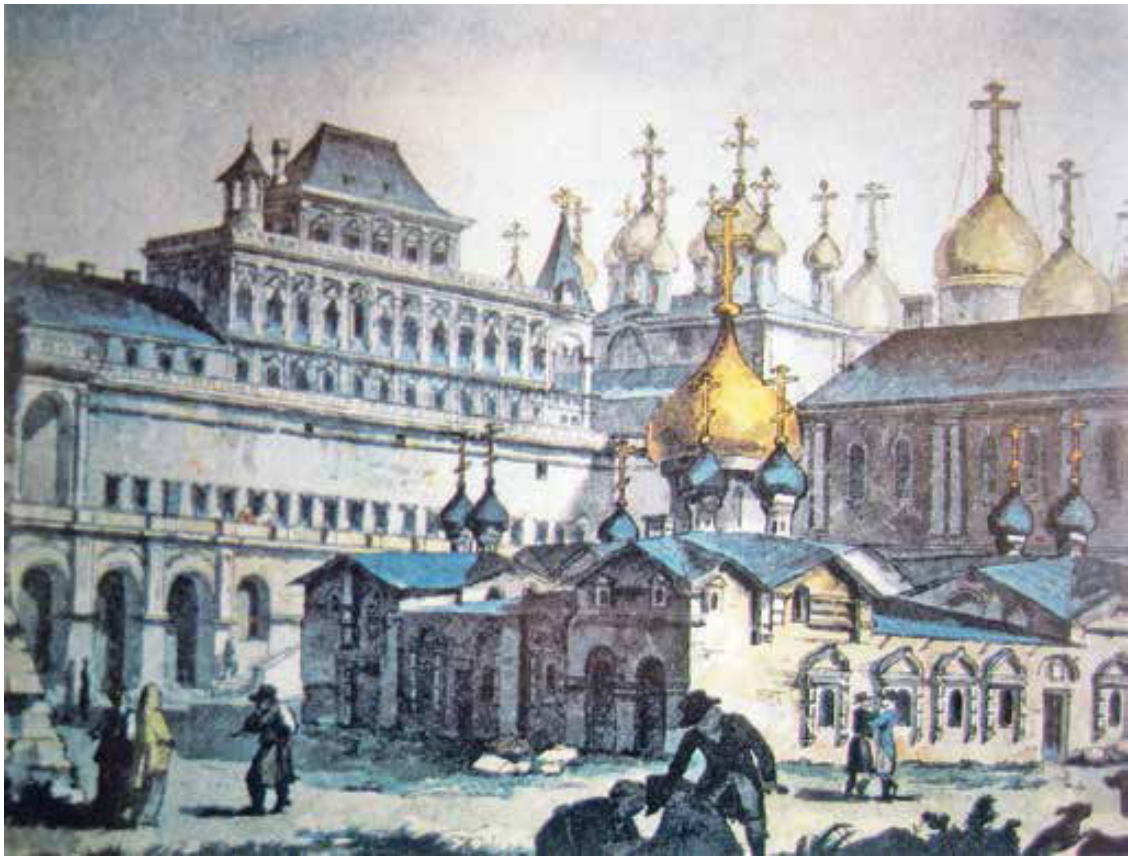
Вид на собор Спаса на Бору и Теремной дворец. Конец XVIII в.

В этой обстановке в январе 1693 года и появилась на свет царица Анна. Местом ее рождения был Кремлевский дворец, и, вероятнее всего, его деревянные царские хоромы. По обычаям русского двора они были предназначены для холодного времени года и строились отдельно для каждого царя, царицы, царевны и царевича. Рубившиеся внутри обширного, слепленного из разных строений дворца, хоромы не просматривались снаружи, что делало жизнь их обитателей закрытой от постороннего взгляда. Летом члены царской фамилии перебирались в кремлевские каменные терема или же выезжали в подмосковные Измайлово, Коломенское и прочие государские «дворы».