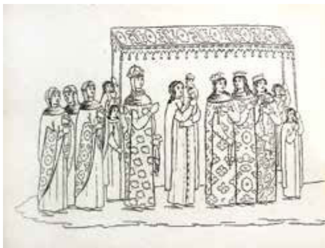
Выход царицы. XVII в.

После отправления требуемых церковных обрядов и дворцовых церемоний, началась повседневная жизнь царевны в дворцовых хорамах. Маленькой Анне был назначен детский штат, в который вошли: мамка для досмотра, ею была «боярыня честная» на жалованье; кормилица, целовавшая крест и получавшая от двора наряд; бабка-лекарка для «бережения» ребенка, а также няньки и прочие служительницы. Во дворце царевне выделили собственный покой, стены которого, по описи дворца 1694 года, были обиты кожами. Здесь ребенка окружил обычный мир детских вещей, предназначенных для повседневной жизни, игр, а позже и учения.