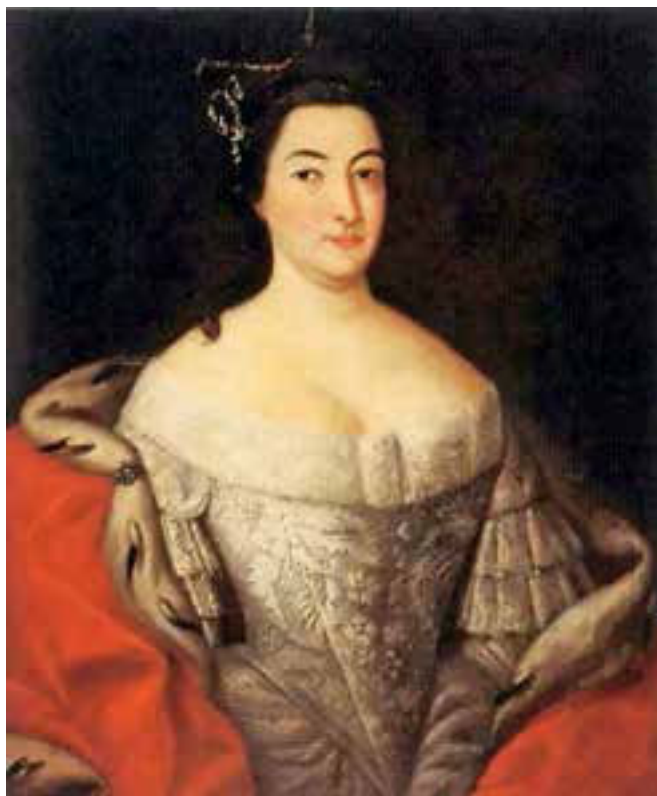
Царевна Екатерина Иоанновна.

Рубеж 1680-х – 1690-х годов, на который пришлось рождение детей у братьев-соправителей, стало последним периодом, когда при появлении царских отпрысков соблюдались многочисленные обычаи московского двора. Осведомленный современник, дипломат князь Борис Иванович Куракин, писал об этом так: «И при тех рождениях последние церемонии дворовые отправлялись как обыкновенно: патриарх и бояре, и все стольники, гости и слободы были с приносом и прочие».