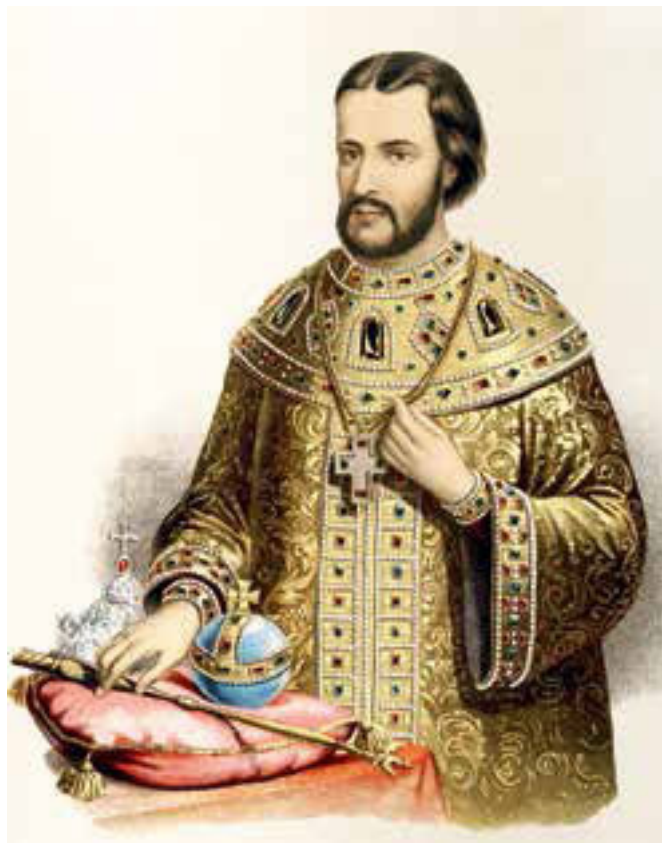
Отец – царь Иоанн V Алексеевич

Будущая императрица всея России царевна Анна Иоанновна родилась 28 января 1693 года. Отцом был царь Иоанн V Алексеевич из династии Романовых, мать – царица Прасковья Фёдоровна, происходила из рода Салтыковых.