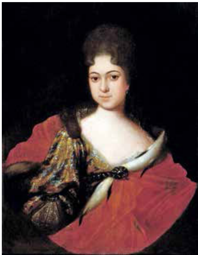
Царевна Прасковья Иоанновна. Художник И. Н. Никитин.

За выполненные требы духовник по традиции получал от царицы драгоценный кубок, 40 соболей, шелковую камку и прочие дары.