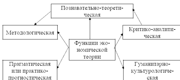
Рис. 1.2. Взаимосвязь функций экономической теории

В целом взаимосвязь функций экономической теории представлена на рис. 1.2.