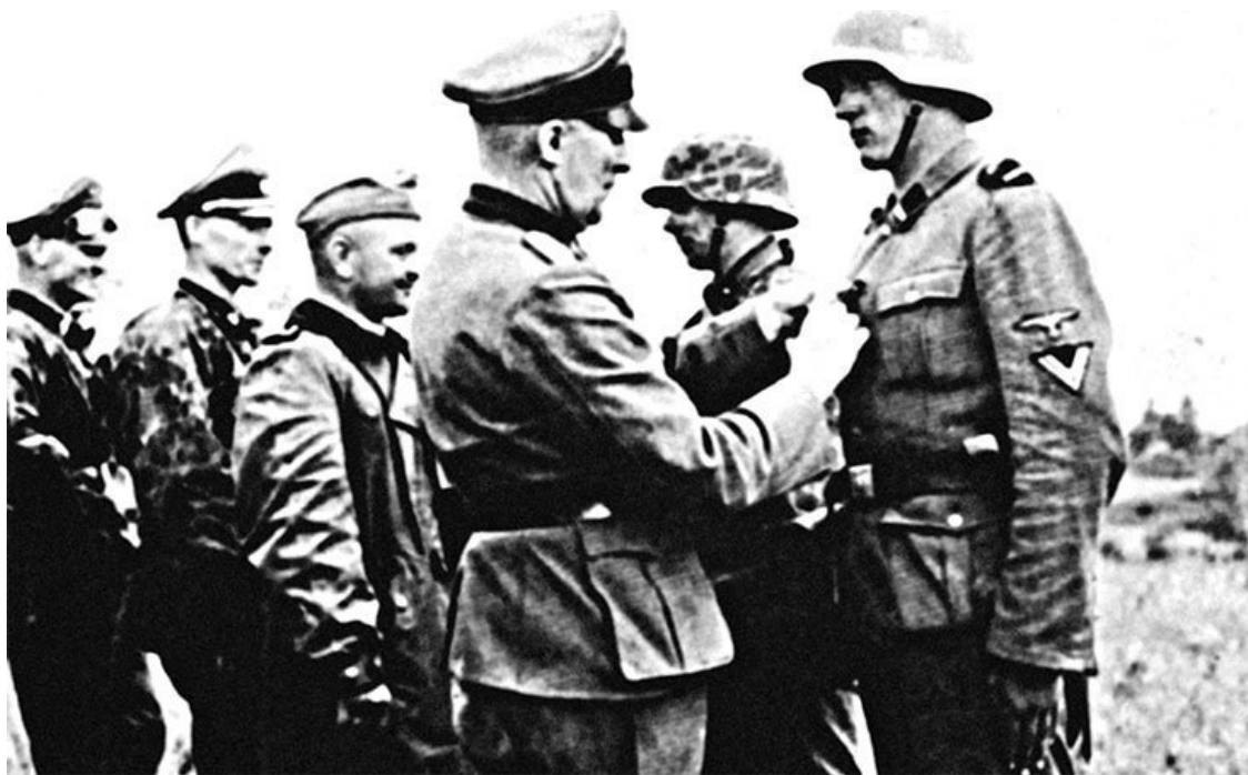
Кляйнхайстеркамп награждает эсэсовцев своего полка после боев у «линии Сталина»

По словам фон Манштейна, в боях в районе линии Сталина «Мертвая голова» понесла колоссальные потери, так как она и ее командиры должны были в бою учиться тому, чему полки сухопутных войск армии уже давно научились. Эти потери, а также недостаточный опыт приводили в свою очередь к тому, что она упускала благоприятные возможности и неизбежно должна была вести новые бои. Ибо нет ничего труднее, как научиться пользоваться моментом, когда ослабление силы противника дает наступающему получить наилучший шанс на решающий успех.