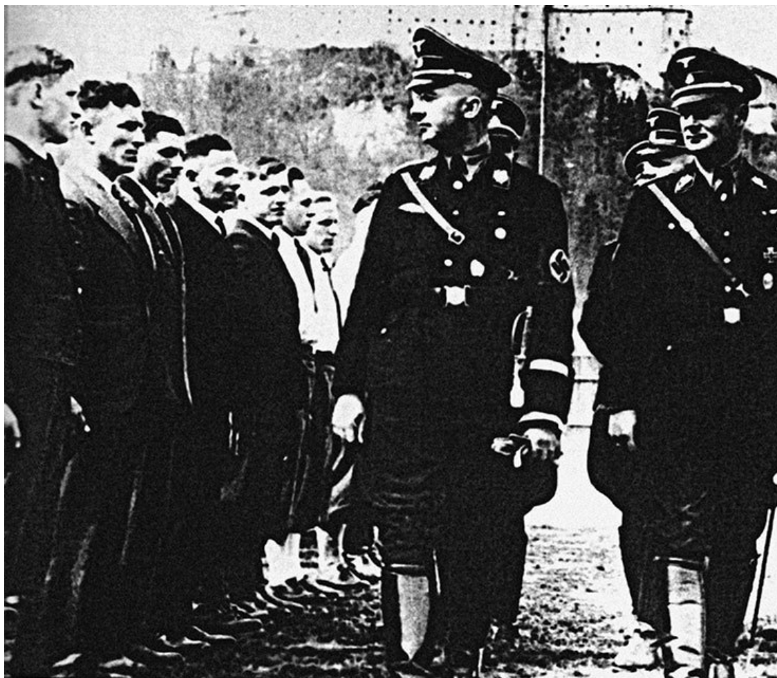
Гиммлер перед строем кандидатов в СС. Октябрь 1932 г.