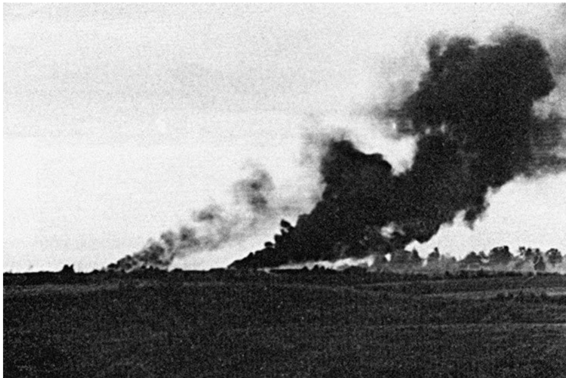
Впереди г. Себеж

навливаем наступление русских и отбрасываем их на исходную позицию. Атака отражена, но какой ценой – тела мертвых товарищей повсюду».