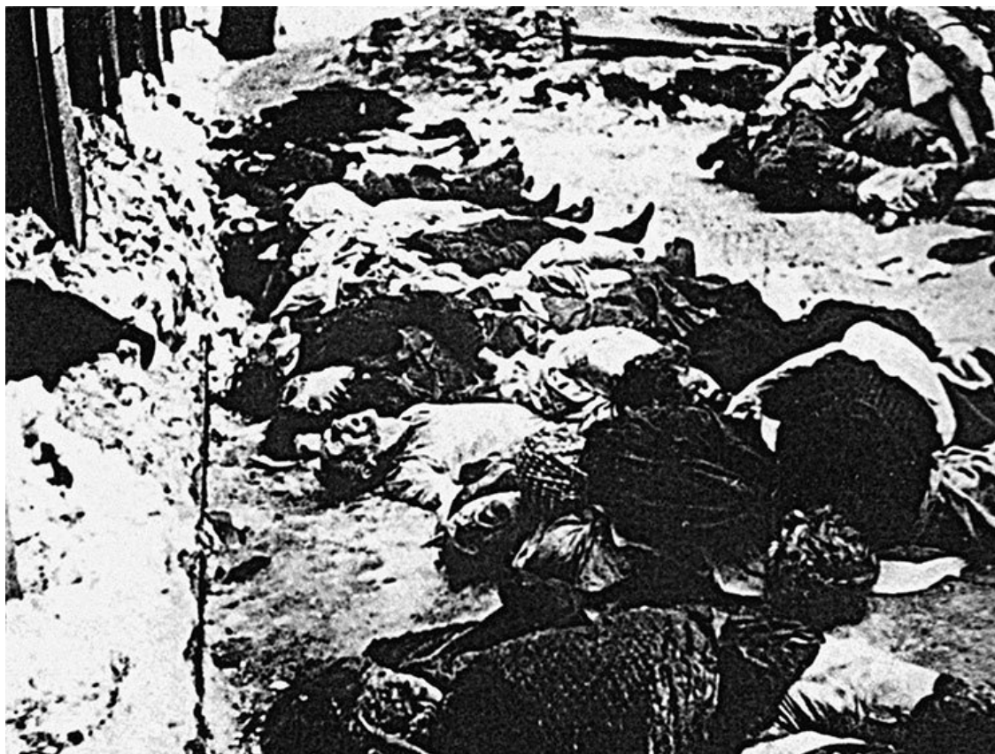
Жертвы подразделения «Бранденбург» в районе польского города Влоклавека

В Западной кампании «Мертвая голова» участие принимала, но особо в боях себя не проявила. Эйке не щадил своих людей, за что получил от генерала Гепнера прозвище «мясник». На Западе подчиненные Эйке совершили первые военные преступления. 26 мая 1940 года были зверски расстреляны из пулемета 100 пленных британских солдат. Марокканских солдат расстреливали, в плен не брали, считая их людьми «низшей расы».