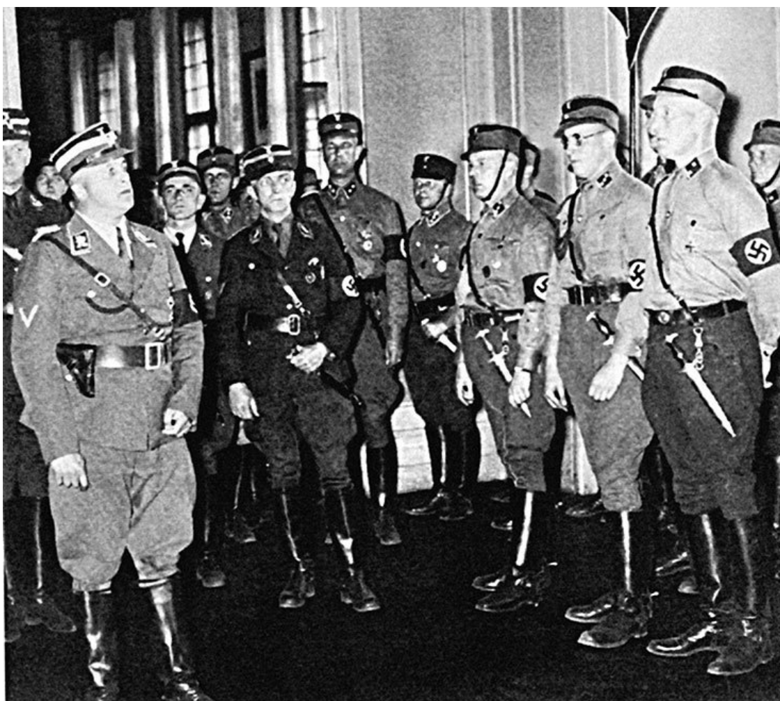
Офицеры СА во время инспекционной проверки

Заняв кресло канцлера, Гитлер и руководство нацистской партии не знало, к чему эти многочисленные отряды штурмовиков, в среде которых росло недовольство против Адольфа Гитлера. Был искусственно создан «мятеж СА», якобы угрожающий Гитлеру. Военное руководство Германии видело в штурмовых отрядах своих врагов и приняло участие в физическом уничтожении верхушки СА. Эйке было поручено убить Рема, что он и сделал, расстреляв его в тюремной камере 2 июля 1934 года. Вскоре, 20 июля, Гиммлер назначил Эйке инспектором концлагерей и командиром караульных подразделений СС, а через шесть дней ему было присвоено звание группенфюрер СС. 20 июля 1934 года в благодарность за верность и решительность в подавлении «путча» Гитлер разрешил СС создавать вооруженные формирования. Одновременно охранные подразделения перешли в прямое подчинение рейхсфюрера. Это позволило создать подразделения «Мертвой головы» численностью 3,5 тысячи человек и быстро их увеличивать.