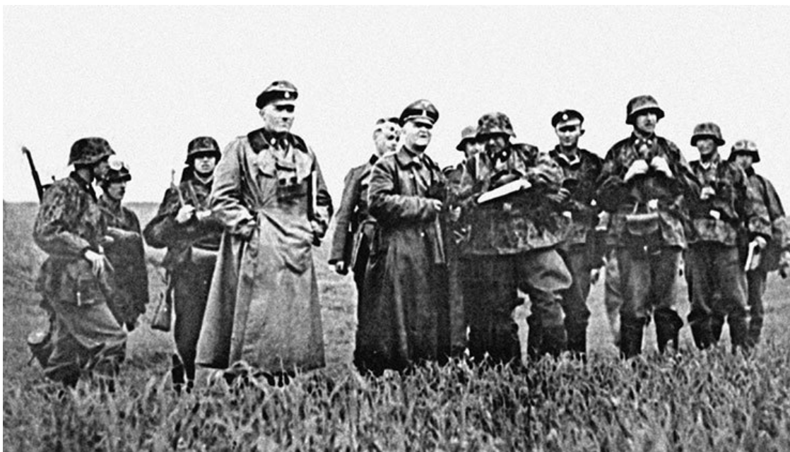
Совещание перед наступлением на «линию Сталина»