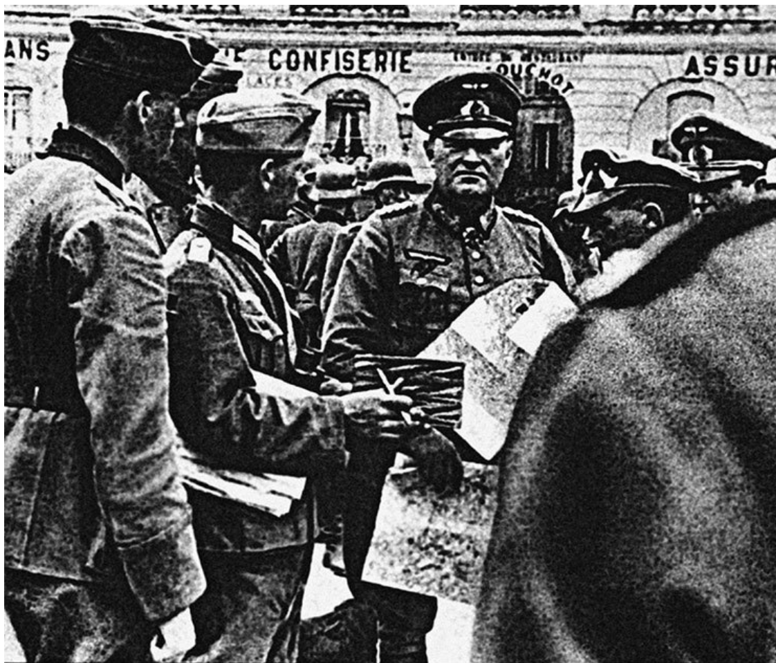
Генерал Гепнер не любил Эйке и не испытывал к нему и его действиям никакого уважения

В соответствии с распоряжением Гитлера о военной подсудности в районе «Барбаросса», подписанным Кейтелем 13 мая 1941 года, любой немецкий офицер мог отдать приказ о расстреле советских людей без суда и следствия, а командир батальона и выше мог применять «массовые насильственные меры»... Фактически распоряжения Гитлера предоставляли офицерам вермахта неограниченные полномочия для расправы с советскими людьми. Одновременно эти распоряжения избавляли военнослужащих вермахта от привлечения к суду за преступления по отношению к местному населению, за исключением случаев, когда они могли привести к разложению войск, снижению воинской дисциплины и безопасности войск.