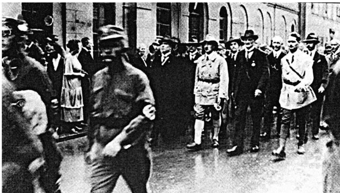
Гитлер в сопровождении видных нацистов шагает по баварскому городку. Справа в светлой куртке Рудольф Гесс. Сразу за ним виден Генрих Гиммлер

До прихода Гитлера к власти национал-социалистическое движение было немыслимо без штурмовых отрядов (СА), которыми руководил Эрнст Рем. Охранные отряды (СС), возникшие как личная охрана Гитлера в первую очередь, как ни странно, от штурмовиков, появились в феврале 1925 года и были малочисленны. В начале года насчитывалось около 1000 человек, к осени – всего двести. После того как 6 января 1929 года пост рейхсфюрера СС занял 29-летний Генрих Гиммлер, эсэсовская организация начала быстро расти и усиливаться.