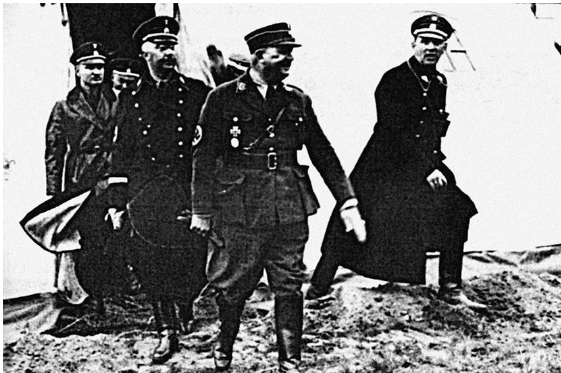
Эрнст Рем покидает партийный митинг в сопровождении своих сторонников

Силы «Мертвой головы» были распределены в четыре штандарта по три батальона в каждом. В середине лета 1939 года войско Эйке насчитывало уже 22 033 человека. Гитлер издал приказ, в котором служба охранников в подразделениях «Мертвой головы» приравнивалась к общеармейской.