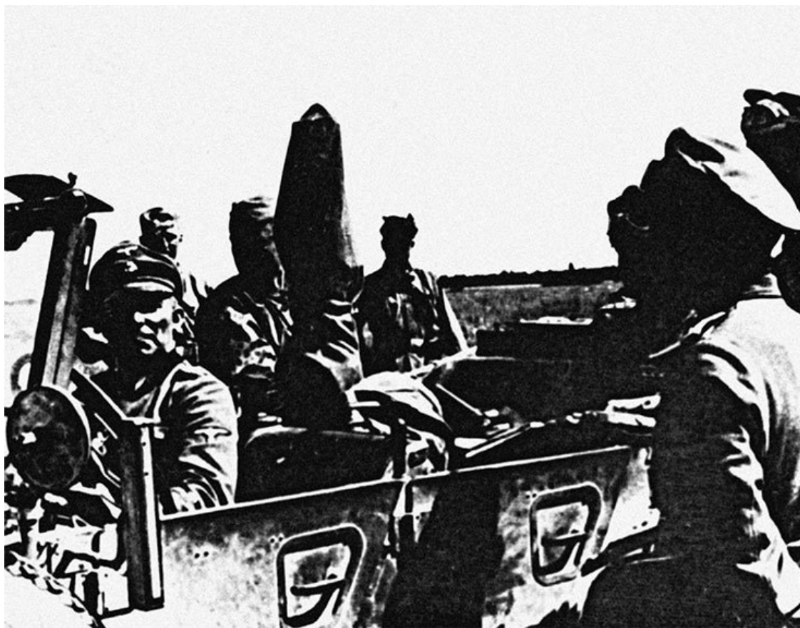
Командир 3-го полка Кляйнхайстеркамп

Отступая, русские взорвали мост у деревни Заситино через одноименную реку. Около 17.00 саперные части под русским огнем смогли мост восстановить. Потери дивизии в этот момент составляли около 50 убитых и более 160 раненых. К исходу дня «Мертвая голова» достигла Васильково, тем самым оказавшись на полпути к Себежу.