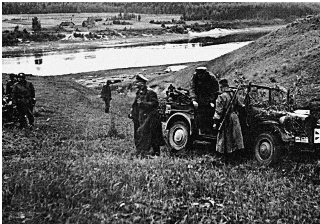
Командир дивизии разбирается в ситуации на месте. Район г. Эллерна на р. Двина

Нападение при сухой и жаркой погоде особенно благоприятно развивалось у 56-го моторизованного корпуса генерал-полковника Э. Манштейна. Его 8-я танковая дивизия (генерал-майор Бранденбергер) достигла реки Дубиссы и захватила плацдарм. Тем самым дивизия к исходу этого дня углубилась на 80 км на советскую территорию