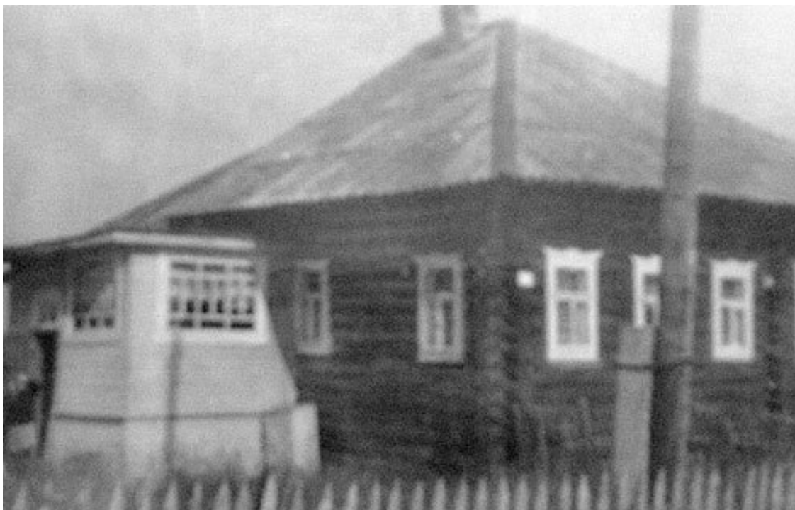
Дом Коноваловых на станции Морженга