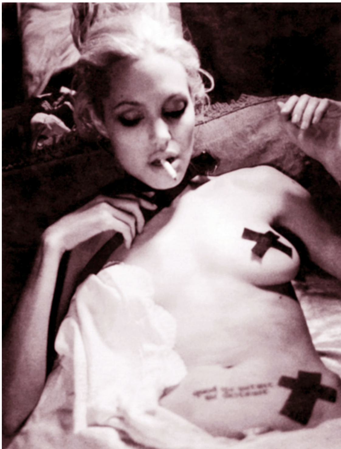
Актриса всегда стремилась «жить на полную катушку»

вновь по улицам, она обратила внимание на красивое платье в витрине одного из модных магазинов... и вдруг осознала, что, сделав последний шаг, уже никогда не сможет примерить это платье. Не сможет сделать еще массу вещей, которые – пока – все еще возможны, пока – маячат на горизонте. Она вдруг поняла, что может «жить на полную катушку», так, как будто каждый день – последний, просто потому что выйти в эту дверь никогда не поздно. Но пока – можно попробовать еще очень многое. Просто продолжать пробовать жизнь на вкус.