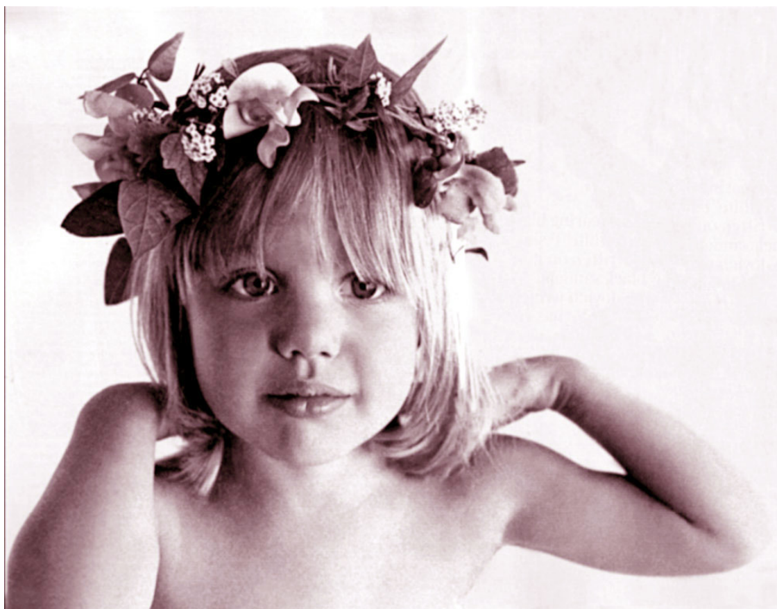
Будучи еще ребенком, Анджелина умела «работать на камеру»