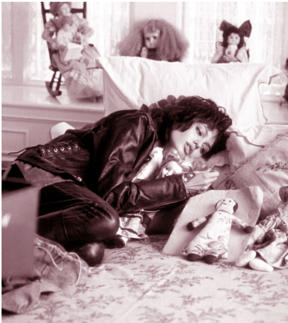
Кадр из фильма «Джиа»

В 16 лет Энджи окончательно распростилась со своим увлечением «сексом с ножами» и... со своим бойфрендом. Очевидно, с ее точки зрения эти отношения попросту исчерпали себя, хотя для ее молодого человека это стало полной неожиданностью. Анджелина просто сняла квартиру и переехала в нее – одна. С этого момента она решила жить самостоятельно. А заработок в качестве модели вполне позволял ей это сделать.