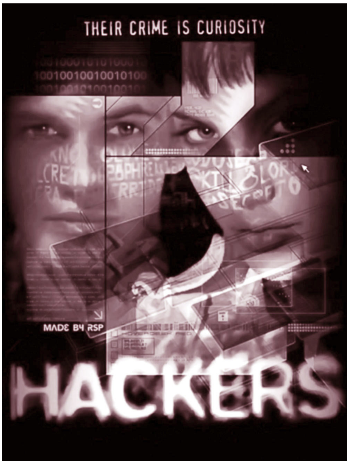
Афиша к фильму «Хакеры»

Как покажет будущее, «вращать» в эмоции на съемочной площадке настолько, чтобы всерьез увлекаться своими партнерами по фильмам, для Анджелины достаточно естественно. Она играет так же, как живет, не всегда находя – и не всегда пытаюсь найти! – границы между собой реальной и собой в роли кого-то еще. В сущности, в этом и заключается, возможно, ее истинный драматический талант – Анджелина всегда остается искренней, не пытаюсь переделывать себя под своего персонажа, а попросту находя своего персонажа в себе.