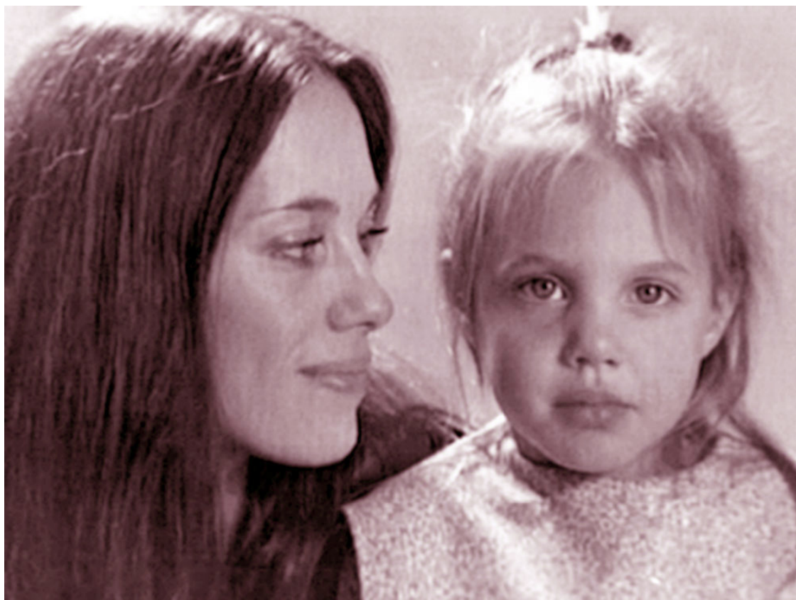
Анджелина в фильме «В поисках выхода». Юной актрисе семь лет...