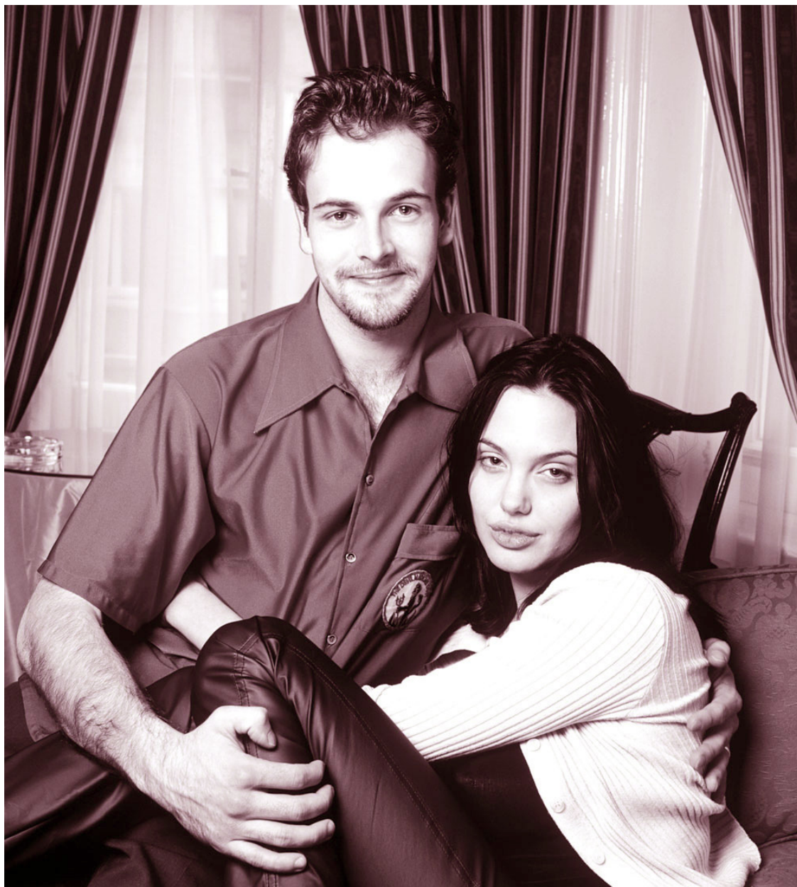
Джоли и ее первый муж Джонни Ли Миллер

Как почти все в жизни пылкой Анджелины, отношения с Джонни Ли Миллером развиваются стремительно и бурно. В 1996 году, в 20 лет, актриса выходит замуж, а уже спустя год расстаётся с новоиспечённым супругом (правда, официально развод был оформлен только в 1999 году). Джоли впоследствии говорила, что они были слишком молоды для брака, и называла женитьбу слишком поспешным шагом. Как бы то ни было, этим двоим удалось сохранить превосходные отношения, и они остались добрыми друзьями на всю жизнь.