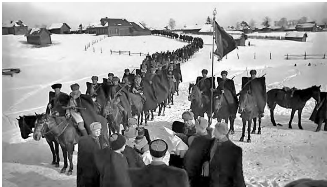
Кавалеристы на марше. Стоит с картой в руках Л. М. Доватор