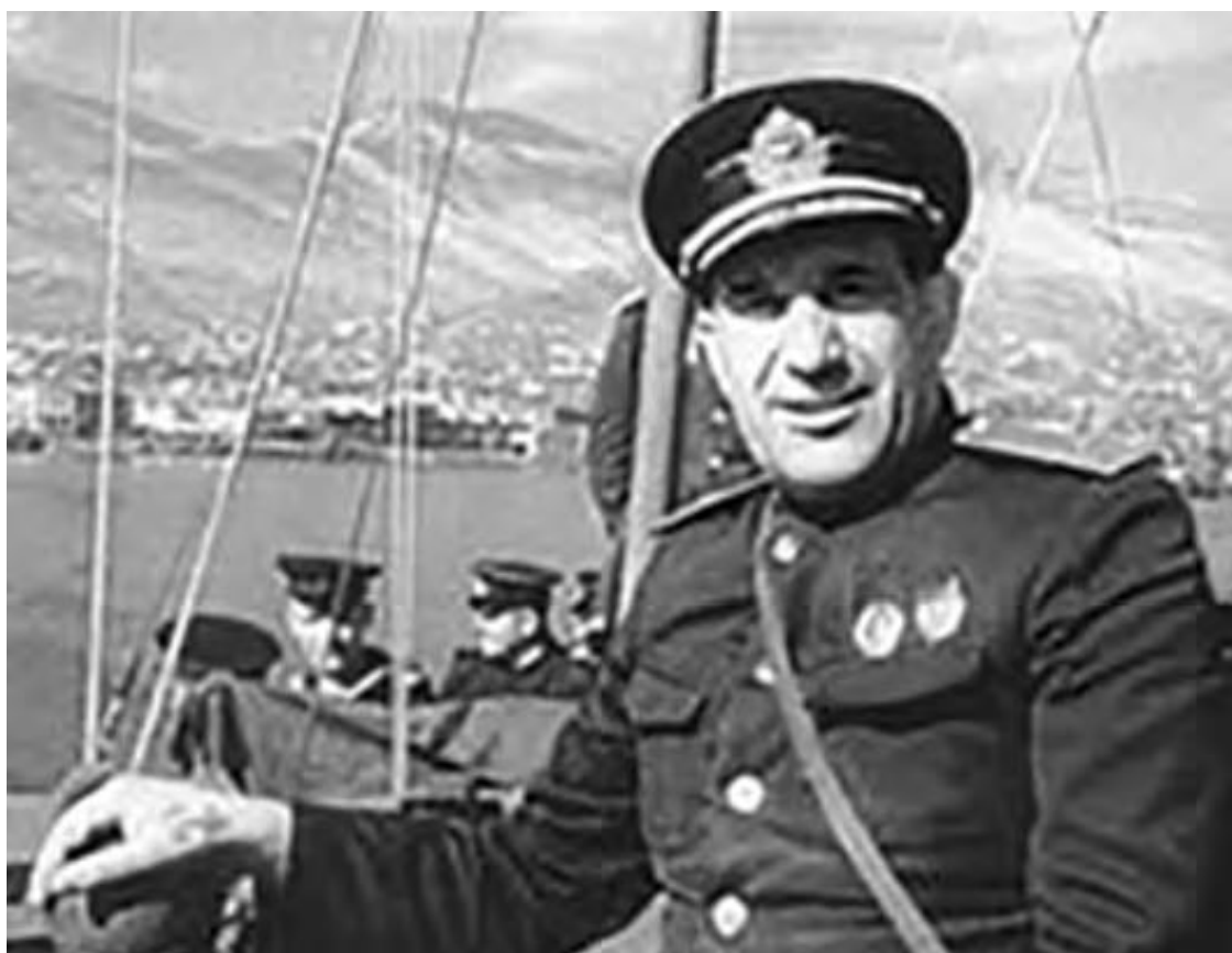
Г. Н. Холостяков у побережья Цемесской бухты. 1943 г.

тябре 1943 г. В результате этого смелого удара с суши и моря войска Северо-Кавказского фронта во взаимодействии с кораблями и частями Черноморского флота после пятидневных ожесточенных боев штурмом овладели портом и городом Новороссийск. Вечером 16 сентября 1943 г. Москва салютовала в честь героев, освободивших Новороссийск. В Приказе Сталина по результатам Новороссийской операции отмечалось: «Войска Северо-Кавказского фронта во взаимодействии с кораблями и частями Черноморского флота в результате смелой операции ударом с суши и высадкой десанта с моря после пятидневных ожесточенных боев... сегодня, 16 сентября, штурмом овладели важным портом Черного моря и городом Новороссийск. В боях за Новороссийск отличились войска генерал-лейтенанта Леселидзе, моряки контр-адмирала Холостякова, летчики генерал-лейтенанта авиации Вершинина и генерал-лейтенанта авиации Ермаченкова...» 190