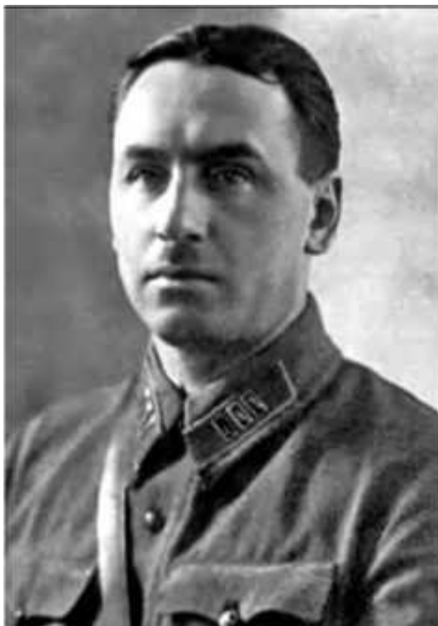
А. И. Антонов

25 июля 1942 г. развернулось грандиозное сражение за Кавказ. Тяжелейшие бои велись по фронту от 320 до 1000 км и на глубину от 400 до 800 км. Высочайшего накала достигли бои сначала в районах городов Новороссийск, Малгобек, в предгорьях Главного Кавказского хребта, затем в других регионах. Среди наиболее известных наших земляков, кому принадлежит слава обороны Кавказа, был А. И. Антонов, уроженец Гродно. В июле-августе 1942 г. он в чине генерал-майора был начальником штаба Северо-Кавказского фронта, затем до декабря 1942 г. – начальником штаба Черноморской группы войск и Закавказского фронта. С декабря 1942 г. являлся первым заместителем начальника Генерального штаба Красной Армии и начальником Оперативного управления, а с февраля 1945 г. – начальником Генштаба, членом Ставки ВГК. Генерал армии А. И. Антонов – единственный наш соотечественник, награжденный высшим советским орденом «Победа».