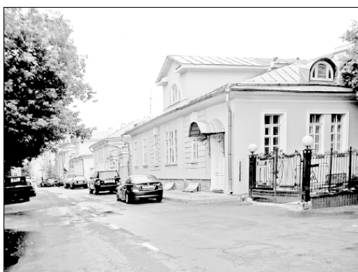
Большой Афанасьевский переулок, дома № 8 и 12

Напротив – два замечательных литературных мемориальных памятника. Один из них – одноэтажный с мезонином домик (№ 8, законченный постройкой, как сказано в архивном документе, 28 июня 1818 г.), к которому были сделаны пристройки в 1884 г. и, вероятно, тогда же изменен фасад. Здесь в 1920-х гг. жил Н.К. фон Мекк, погибший в застенках Лубянки. Он был сыном той самой Надежды Филаретовны, прославившейся поддержкой в течение многих лет П.И. Чайковского. Н.К. фон Мекк стал председателем правления Московско-Казанской железной дороги, был женат на племяннице Чайковского А.Л. Давыдовой. Его арестовали вместе с многими техническими интеллигентами, которым приписали образование так называемой Промпартии. Это был один из первых политических процессов, инсценированных Сталиным. Почти всех участников процесса расстреляли.