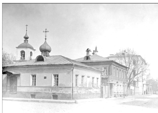
Власьевский Большой и Гагаринский переулки. Фото 1913 г.

Большой и Малый Власьевские переулки. Оба Власьевских переулка, и Большой и Малый, получили название от церкви Власия. Св. Власий издавна почитался на Руси как покровитель домашних животных, и на него перенесли верования, связанные с языческим богом Велесом. Недаром эта церковь стояла в Конюшенной слободе и называлась «что в Старой Конюшенной», а по старым документам – «на Козьем болоте». Она неоднократно перестраивалась – возможно, что первоначально каменное здание впервые появилось здесь в начале XVII в. По письменным источникам известна с 1625 г. В 1644 г. была выдана благословенная грамота на четыре придела – Спасопреображенский, Казанской иконы Богоматери, св. Власия и св. Николая. Колокольню XVIII в. изменили в 1816 г., а в 1872 г. построили новую широкую трапезную.