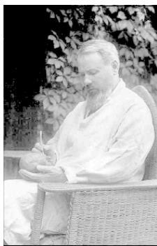
Скульптор Николай Андреевич Андреев