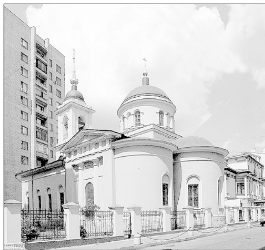
Церковь свв. Афанасия и Кирилла

Из-за бездумного, безразличного отношения к нашему наследию этот некогда один из самых поэтических уголков Москвы неузнаваемо изменился.