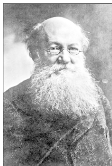
Петр Алексеевич Кропоткин, русский революционер, теоретик анархизма, географ, историк

твердыней государства и церкви. Громадная площадь пред ним, застроенная тысячами лавок и лабазов, с незапамятных времен представляла настоящую торговую толчею и до сих пор является сердцем внутренней торговли обширной империи. На Тверской и Кузнецком мосту издавна сосредоточены главные модные магазины, тогда как заселенные мастеровым людом Плющиха и Дорогомилово сохранили те самые черты, которыми отличалось их буйное население во времена московских царей. Каждая часть составляет сама по себе отдельный мирок, со своей собственной физиономией, и живет своей особой жизнью. Даже склады и мастерские, тяжело нагруженные вагоны и паровозы железных дорог, когда последние вторглись в древнюю столицу, и те сосредоточились отдельно, в особых центрах, на окраинах старого города.