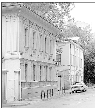
Большой Афанасьевский переулок, дома № 7 и 9