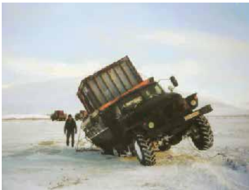
Автомобиль в наледи.

Наледь зимой – один из самых страшных врагов человека на белой тропе. На первый взгляд её существование противоречит законам природы. Откуда ни возьмись на сорокаградусном морозе вдруг из-под снега начинает течь живая вода. Причём порой эта картина настолько живописна, что просто потрясает воображение даже многие испытавших людей.