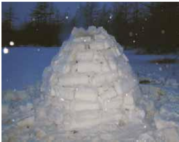
Так выглядит снежная хижина в законченном виде

А вот почему. В своих собственных путешествиях я всегда старался двигаться тайгой. в крайнем случае лесотундрой – то есть в условиях избытка горючего материала. А при таком раскладе мощная энергосберегающая система, которой и является иглу с точки зрения чистой термодинамики, не нужна!