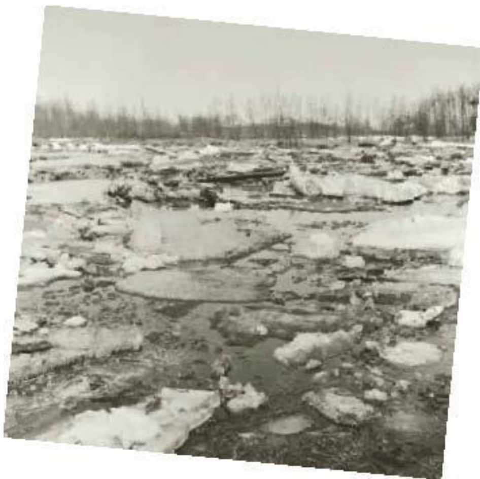
Ледоход на реке Убиенке.

Дождевые паводки неприятны своей непредсказуемостью. Конечно, если беспрестанно с неба сыплется мелкий нудный дождичек, который усиливается день ото дня, при этом грунт постепенно напитывается водой, то не надо быть колдуном, чтобы предположить, что вода в реке в конце концов поднимется. Но бывает и так – в далёких верховьях реки проходят мгновенные проливные дожди, поднимающие уровень воды в сотнях километрах вниз по течению буквально за считанные часы.