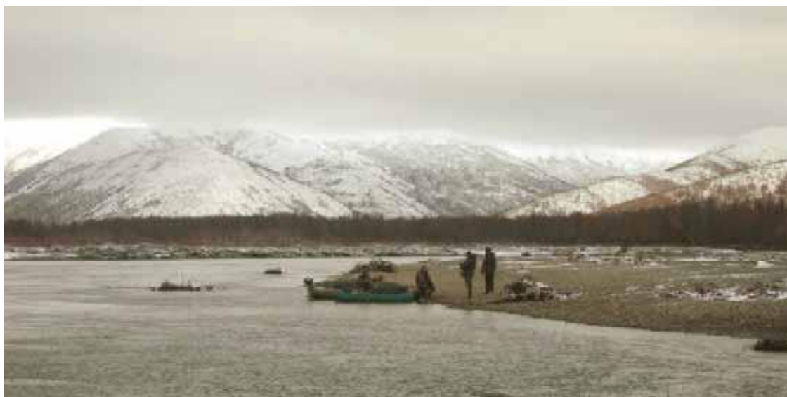
Поиски места для лагеря.

Первый снег в России характерен тем, что рано или поздно, но он всё равно пойдёт. Поэтому где-то с середины сентября к снегу надо быть готовым в любой момент. Если вы находитесь на зимовье, то помните – у снега существует противное свойство засыпать все предметы. Причём далеко не все они после его таяния могут обнаружиться весной. Особенно это относится к топорам. Кроме того, ежели снегом что-нибудь замело, то найти это «что-то» прямо сейчас становится очень и очень проблематично. Поэтому в ожидании выпадения снега желательно всё снаряжение или прятать под крышу, или закрывать тентами или ящиками.