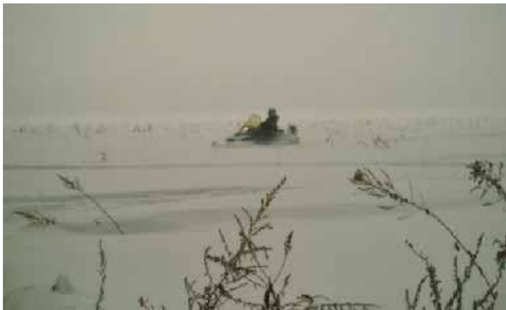
Снегоход в плохую погоду.