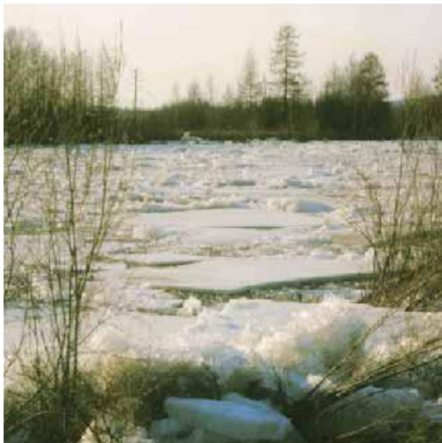
Ледоход на таёжной реке.

Мощь ледохода из всех стихий сопоставима только с энергией снежной лавины. Но завыва в том, что далеко не каждый опытный путешественник хоть раз в жизни встречался со снежной лавиной. А вот ледоход происходит на каждой реке каждый год. Ледоход уносит с берегов десятки квадратных километров леса, срывает с неудачных стоянок баржи и катера, сносит поставленные избышки, перелопачивает тысячи кубических километров грунта. Но ледоход создаёт и ещё одну проблему, которая может в одночасье превратить его из титанического явления природы в катастрофу, подобную азиатскому селю.