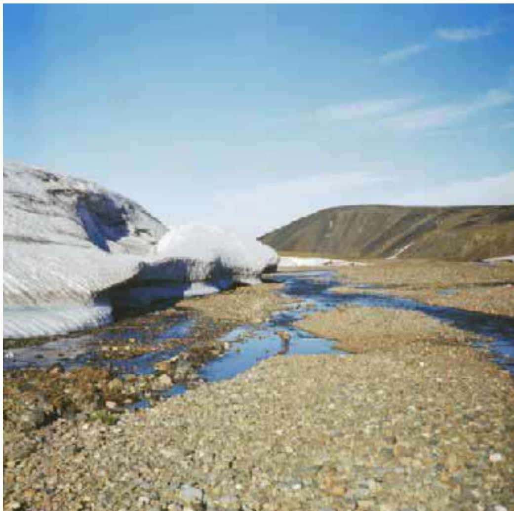
Панцирь нетающего льда (Амгуэмская наледь).

Кроме зимних наледей бывают ещё и летние. Точнее – это те же зимние наледы, но не успевшие растаять к середине лета. Иногда они не тают полностью до следующей зимы – тогда они становятся наледями многолетними. Многолетние наледы особенно распространены в Якутии, где носят гордое название тарынов . Самая большая многолетняя наледь, длиной более сорока километров, лежит на притоке Индигирки реке Моме и звучно зовётся Улахан Тарын, что попросту значит – Большая Наледь. Такие наледы имеют значение, прежде всего, для тех, кто передвигается сплавом по этим рекам. Дело в том, что в первую половину лета эти наледы зачастую являются непроходимыми. Вода прорезает в них множество мелких тоннелей, которые сверху прикрыты бело-голубым панцирем. Обычно они имеют форму овала, вытянутого вдоль русла реки, длиной в один-два километра, так что не составляет труда обнести весь груз и сами лодки по краю этой ледяной линзы.