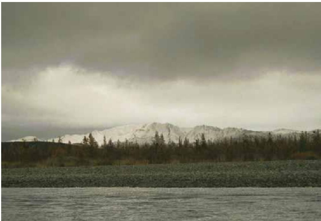
В предчувствии снегопада.

Кроме того, если вы обращали внимание, то, наверное, заметили, что в самих зимовьях вокруг печки в стены и потолок вбито огромное количество гвоздей.