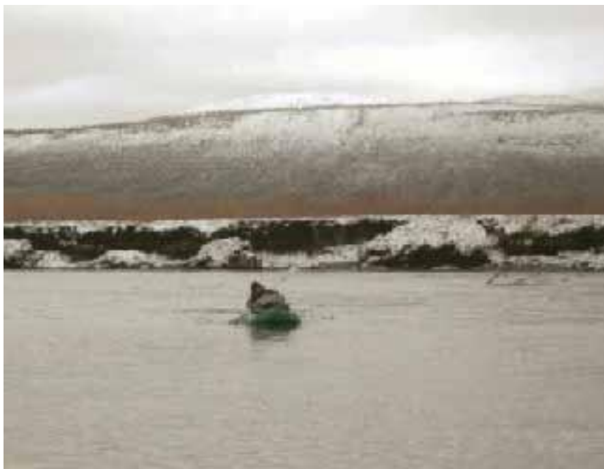
Уход от нависших над рекой обрывов.

Вообще, замерзание рек – процесс длительный и сложный. Ледостав происходит в течение нескольких дней, причём раньше всего замерзают озёра, потом тихие, спокойные долинные реки, а уж затем – быстрые реки горных долин.