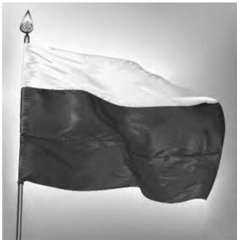
Государственный флаг Российской Федерации

Формирование семей в историческом плане, в том числе и в России, происходило примерно по одному сценарию, но с особенностями каждого народа. Об этом убедительно написал Ф. Энгельс в работе «Происхождение семьи, частной собственности и государства».