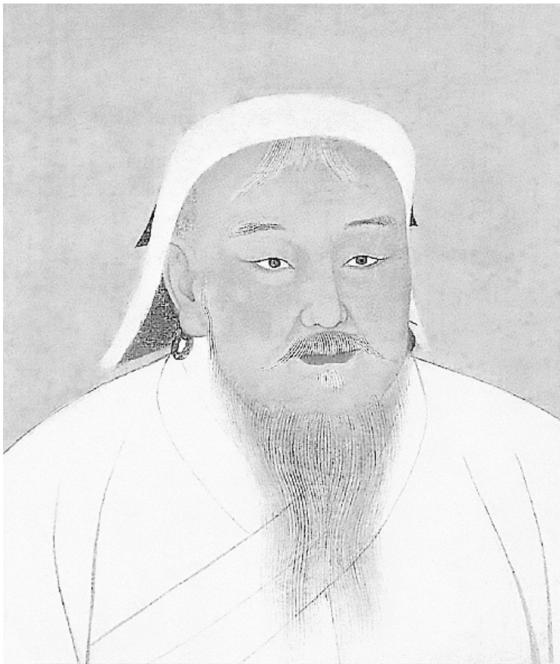
Портрет Чингисхана. Из коллекции портретов монгольских ханов и ханш, хранившихся в императорском дворце в Пекине. XIII–XIV вв.