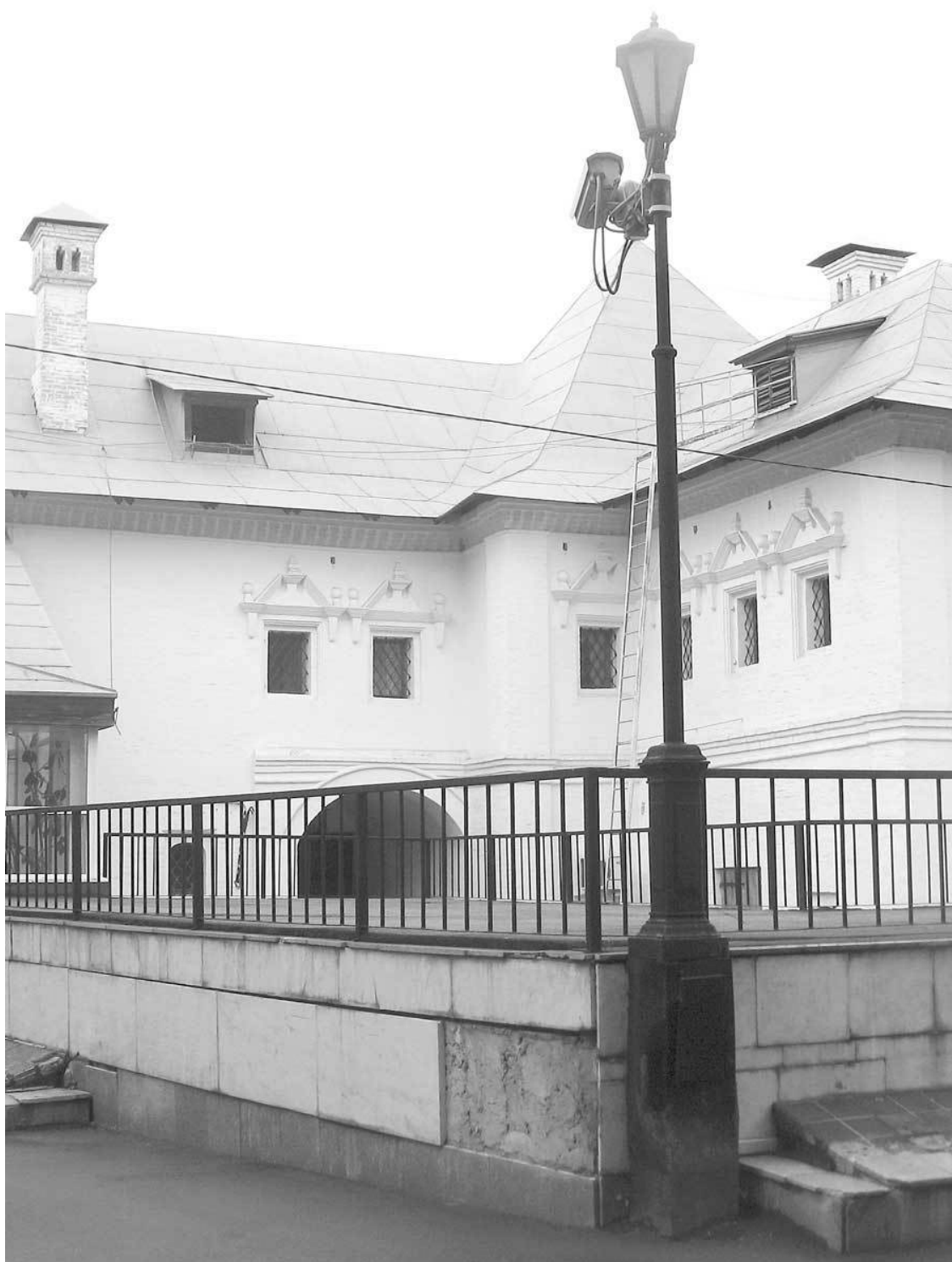
Гранатный двор сегодня

Небольшой и скромный жилой дом (№ 3), выстроенный в 1884 г. по проекту архитектора С. С. Эйбушитца (дом принадлежал М. С. Гольденвейзеру, юрисконсульту банка Полякова), оказался связанным с историей русского демократического движения, с именами Г. Б. Иоллоса и А. Д. Сахарова. Здесь жил один из самых блестящих политических деятелей и публицистов, член Государственной думы первого созыва, редактор газеты «Русские ведомости» Григорий Борисович Иоллос. Своими корреспонденциями и выступлениями в Думе он вызывал беш-