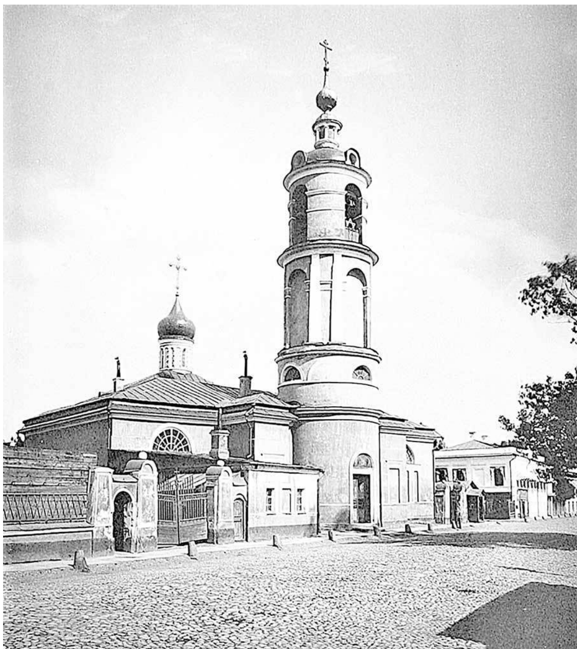
Церковь Св. Спиридона на Козьем болоте