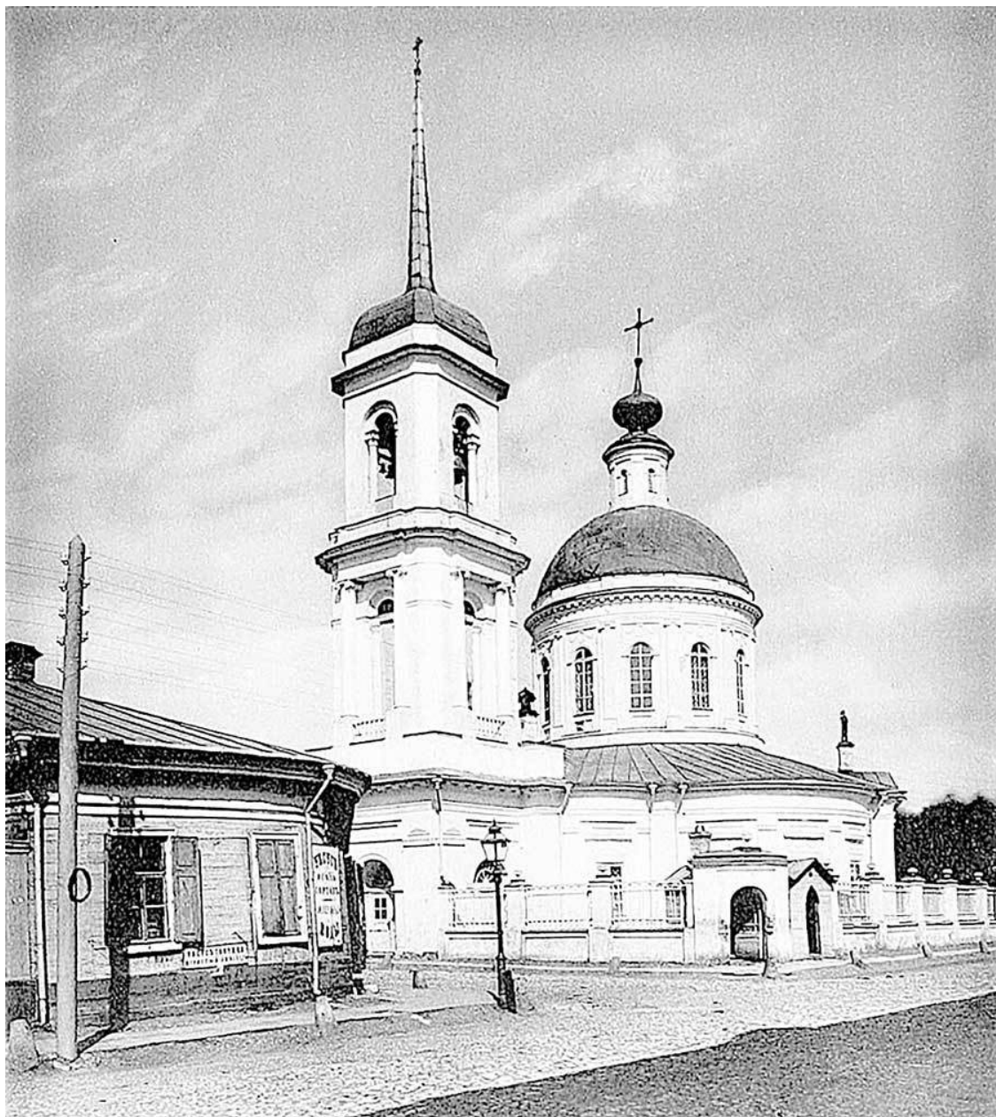
Церковь Георгия на Всполье