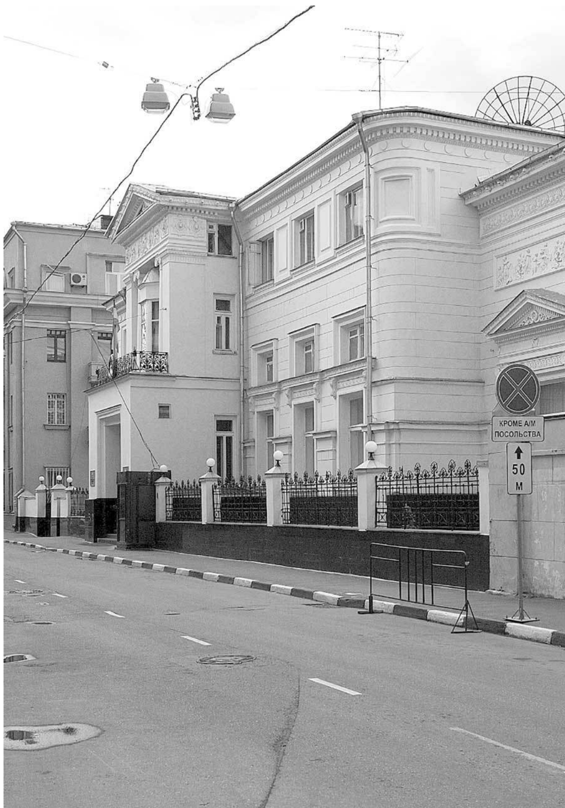
Гранатный переулок, дом № 13

Здесь снимал квартиру писатель Борис Зайцев: «В доме Армянских много у нас уже бывало народу... Бальмонт, Сологуб, Городецкий, Чулков, Андрей Белый... И конечно, бывал здесь Иван Алексеевич Бунин... Дух был богемский и бестолковый. Путано, шумно, нехозяйственно – но весело. И весьма молодо... На одном сборище таком встретил он у нас тихую барышню с леонардовскими глазами, из старинной дворянской семьи... Вера Никола-