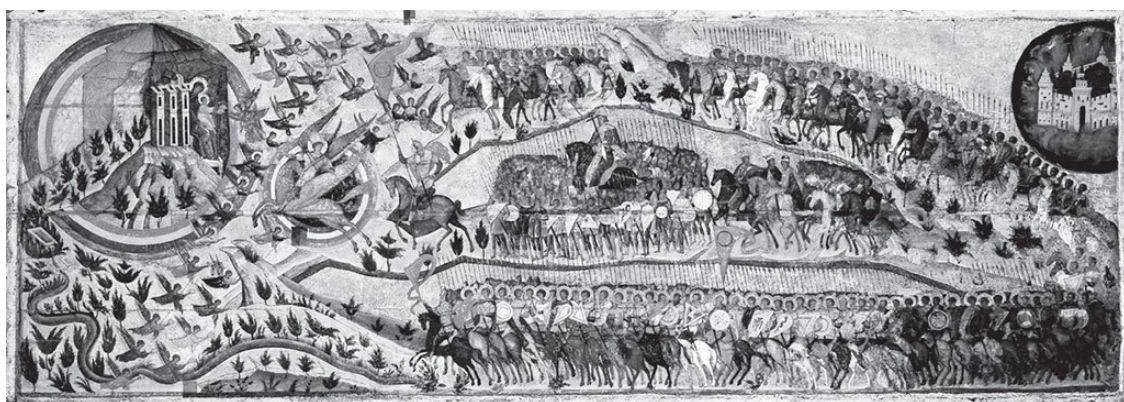
Икона «Благословенно воинство Небесного Царя».

Покорение давнего врага Руси – Казанского ханства – стало событием огромного значения, нашедшим отражение и в русской культуре. Помимо знаменитого Покровского собора –