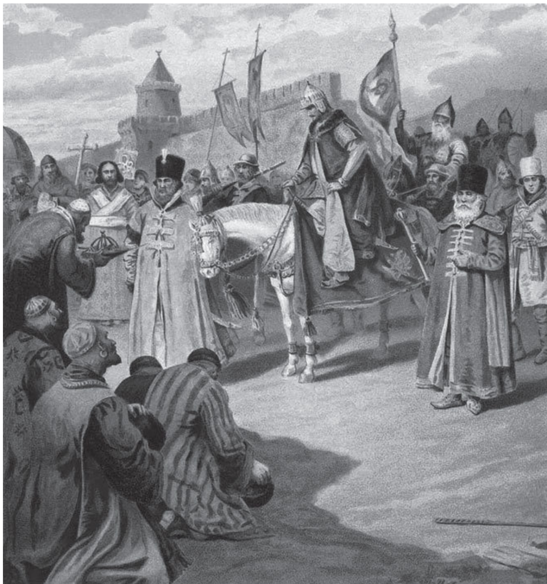
Коровин П. И. Взятие Казани Иоанном Грозным. Кон. XIX – нач. XX в.