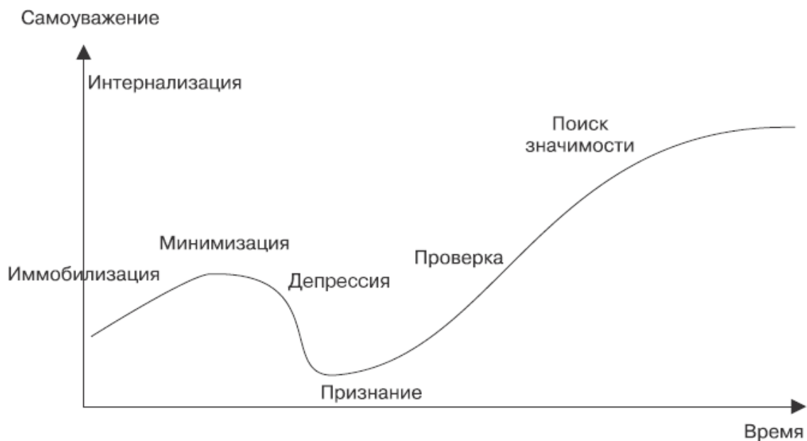
Рис. 1.2. Кривая самоуважения

Поскольку прогресс каждой личности уникален, то кто-то никогда не сможет пройти через иммобилизацию или минимизацию, кто-то может не справиться с депрессией, а многие пройдут поэтапно все ступени.