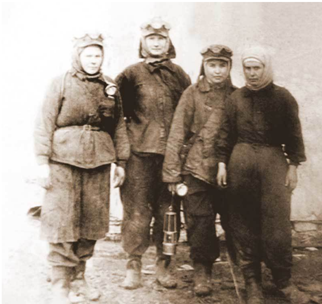
Шахтерки, 50-е годы