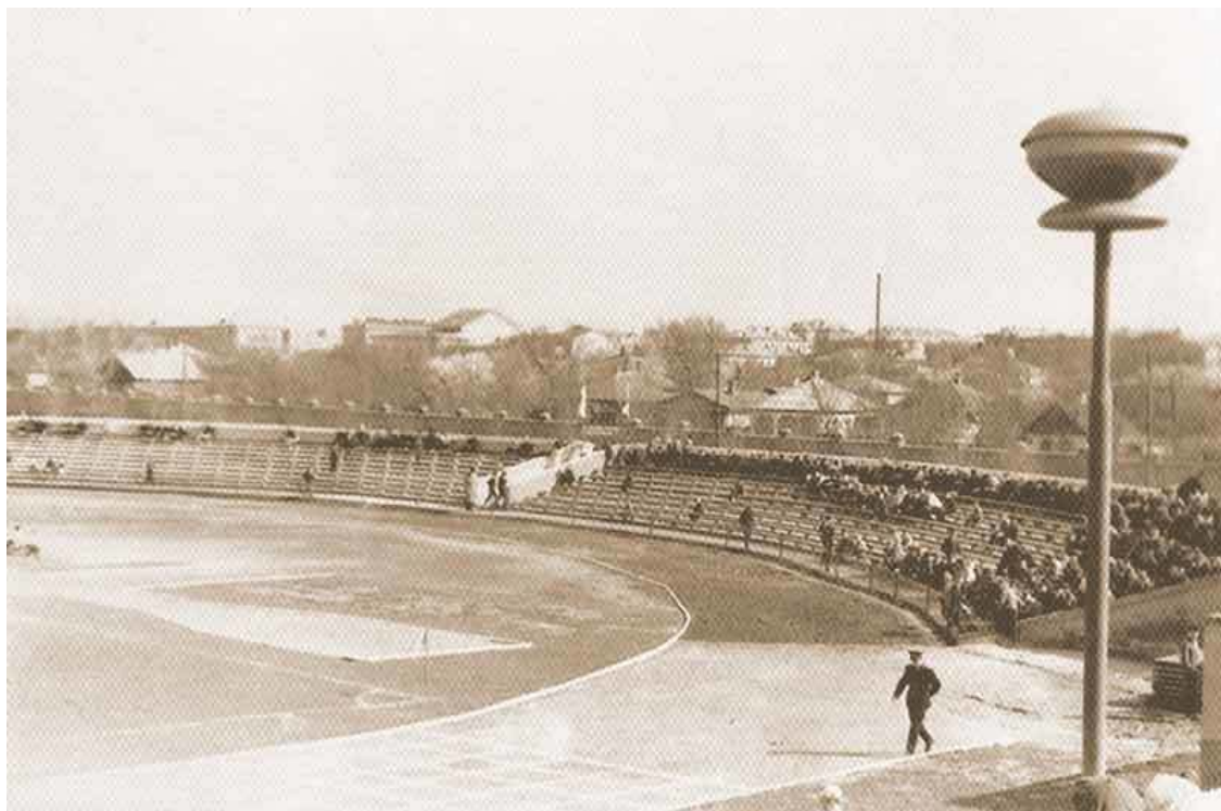
Каменск-Шахтинский, 60-е годы, стадион «Прогресс»