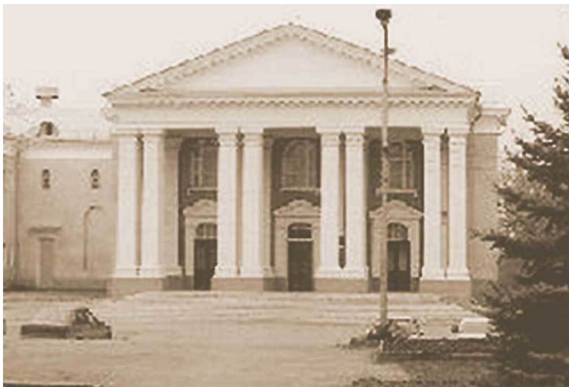
Каменск-Шахтинский, 60-е годы, ДК Маяковского