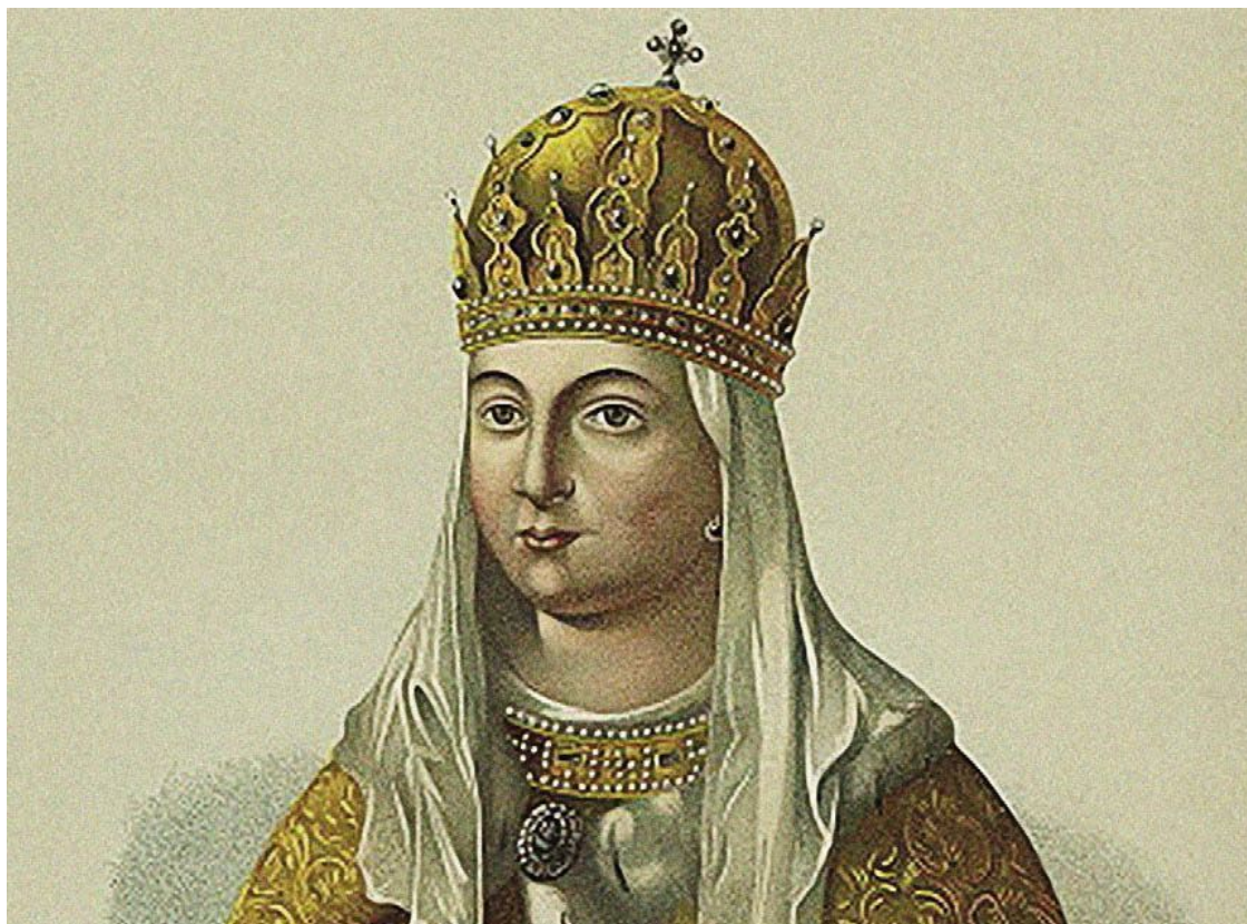
Царица Евдокия Лукьяновна Стрешнева, вторая супруга Михаила Федоровича (худ П. Ф. Борель, 1860-е)

Этот брак стал для Михаила Федоровича воистину счастливым. С царицей Евдокией они жили в полном согласии и уважении, оба умерли в 1645 году, с разницей всего в полтора месяца. Правда, из десяти детей, которых родила царица, шестеро умерли во младенчестве. До зрелого возраста дожили только четверо: Ирина, Анна, Татьяна и Алексей, который занял московский трон после смерти отца.