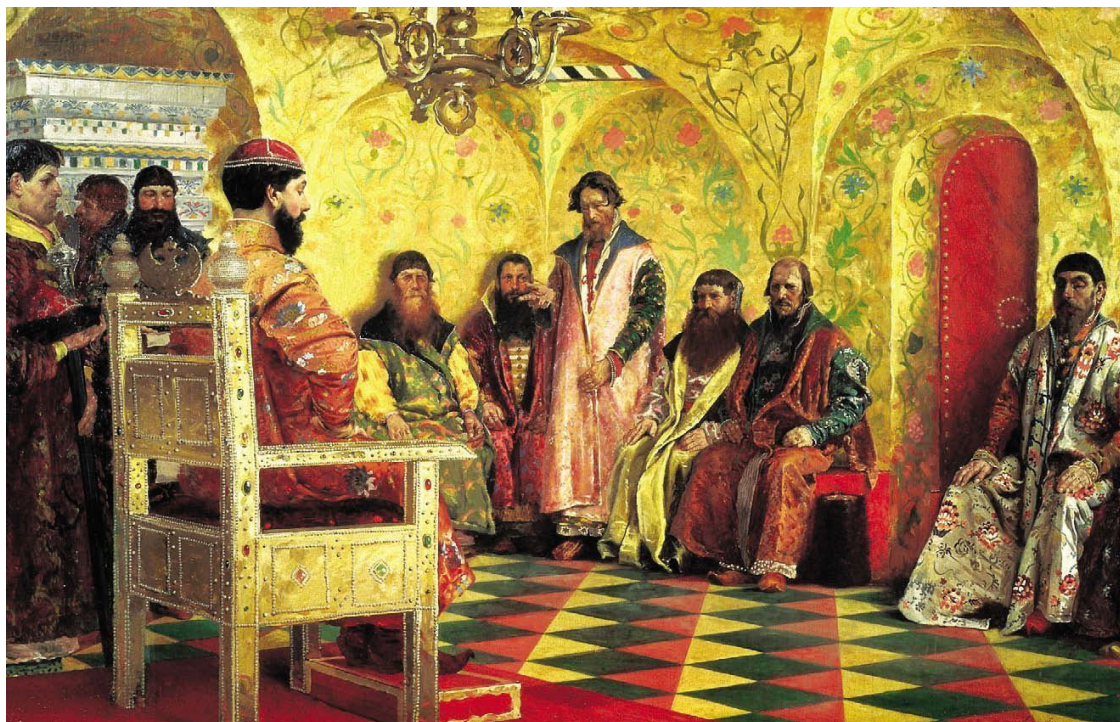
Боярская дума, разделявшая власть с царем, ежедневно заседала в одной из палат дворца (худ. А. П. Рябушкин, 1893)

Единственным взрослым мужчиной среди ссыльных был князь Борис Камбулатович Черкасский, однако никакого участия в воспитании маленького Михаила Романова он не принимал. Это было не в традициях эпохи. Будущим царем занимались в основном женщины, мамы и няньки. Однако самую заметную роль в воспитании маленького Миши сыграла княгиня Марфа Никитична Черкасская. Несомненно, женское руководство наложило отпечаток на характер будущего царя. Михаил с детских лет отличался смирением, кротким нравом и необычайной ласковостью.