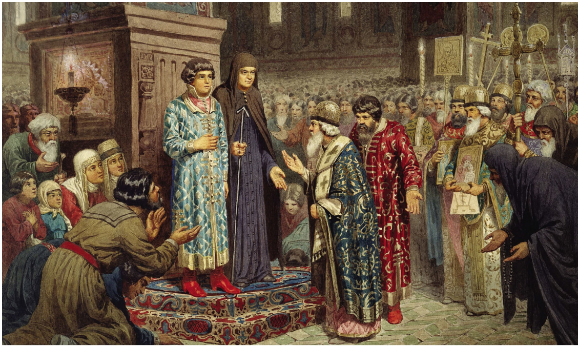
А. Д. Кившенко «Избрание Михаила Федоровича Романова на царство», 1880