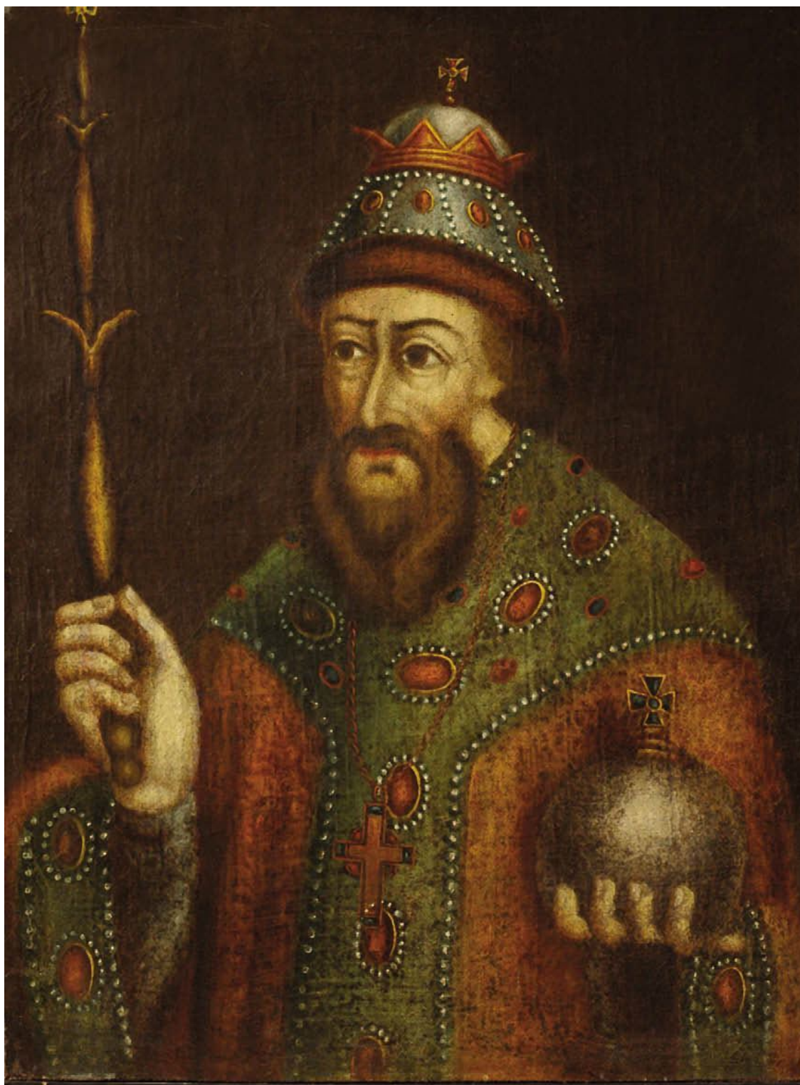
Правление Михаила Федоровича ознаменовалось «вечным миром» со Швецией и прекращением войны с Речью Посполитой (неизв. худ., XVIII в.)