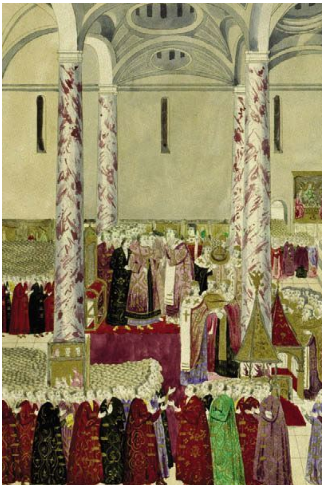
Коронование царя Михаила Феодоровича в Успенском соборе (литография XIX в. с гравюры XVII в.)