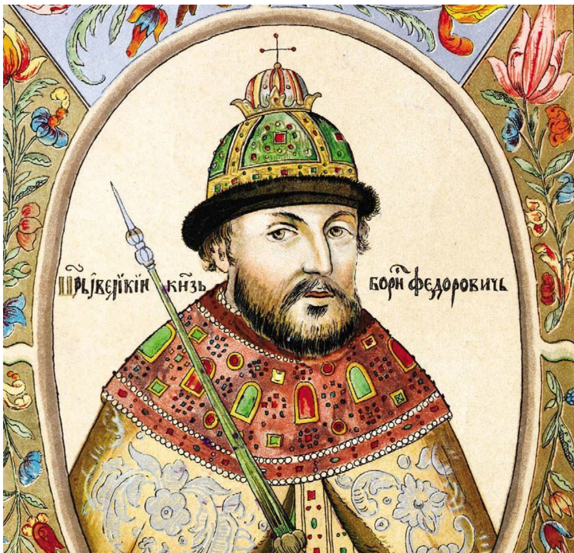
Борис Годунов ненавидел Романовых как возможных соперников на троне (илл. из «Царского титулярника», 1672)

Современники отмечали, что этот тихий, скромный и мягкий молодой человек с начала царствования не испытывал склонности ни к государственным делам, ни к державному устройству. Неудивительно, что и мать Михаила, умная и волевая инокиня Марфа, узнав о решении Земского собора, пришла в ужас. По ее мнению, сын совершенно не подходил на роль властителя огромной державы. «Люди московские измалодушествовались!» – такова была ее первая реакция. Лишь после долгих уговоров мать, скрепя сердце, согласилась благословить сына на царство.