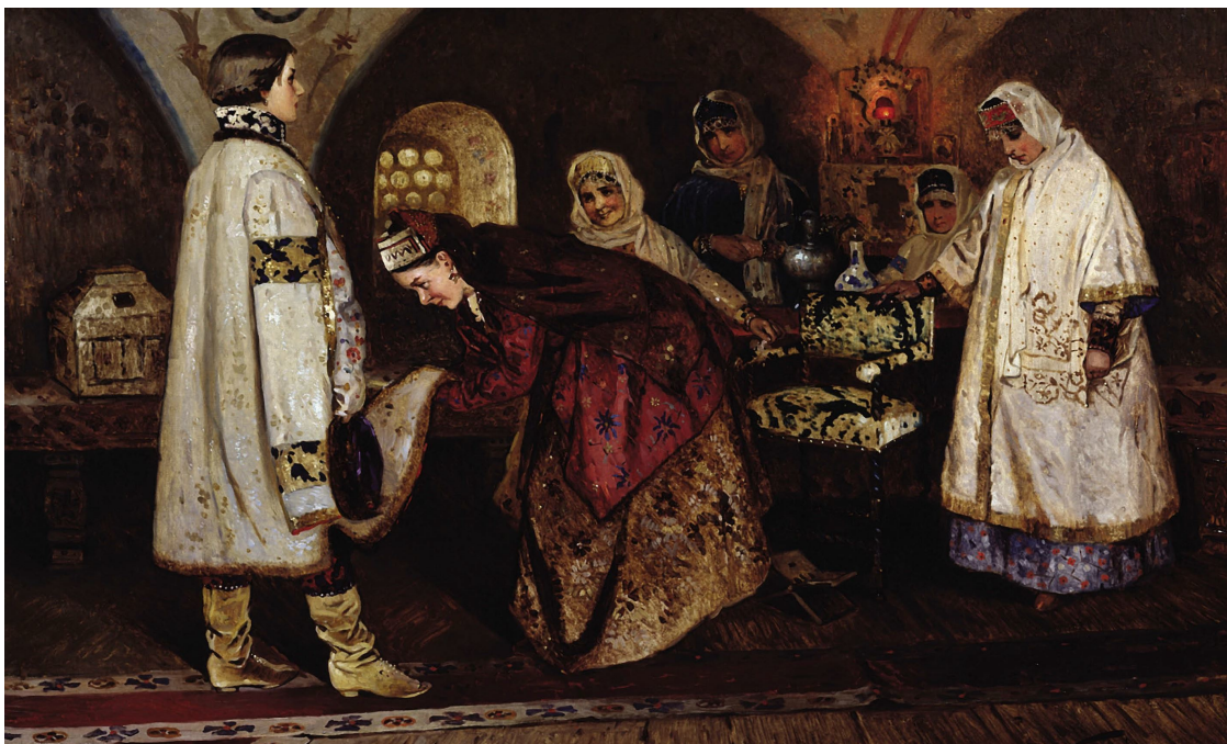
М. В. Нестеров «Первая встреча царя Алексея Михайловича с боярышнею Марией Ильичной Милославской (Выбор царской невесты)», 1887

Морозов же, по слухам, этот обморок и организовавший, обвинил отца девушки в том, что тот скрыл ее болезнь, и ни в чем не повинная семья отправилась в ссылку в Тюмень. Впоследствии Всеволожским позволили вернуться в свое имение, но без права из него выезжать. Через десять лет после несостоявшейся свадьбы Евфимия умерла.