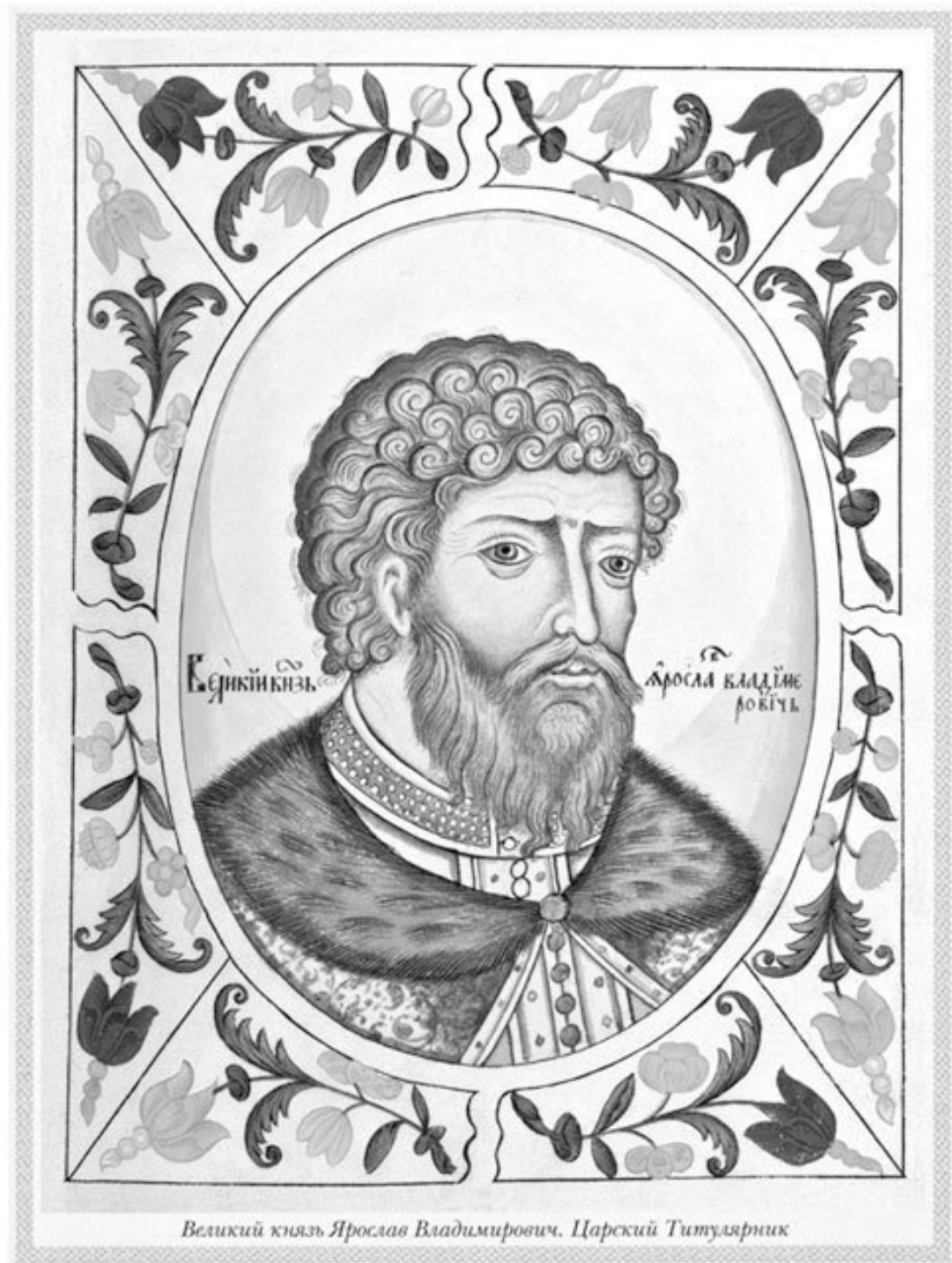
Ярослав Мудрый. Реконструкция М. М. Герасимова. 1939 год.

Ученые уверены, что Ярослав Мудрый вылечил рак губы мухомором и чагой, про примочки чаги есть тексты на новгородских берестах.