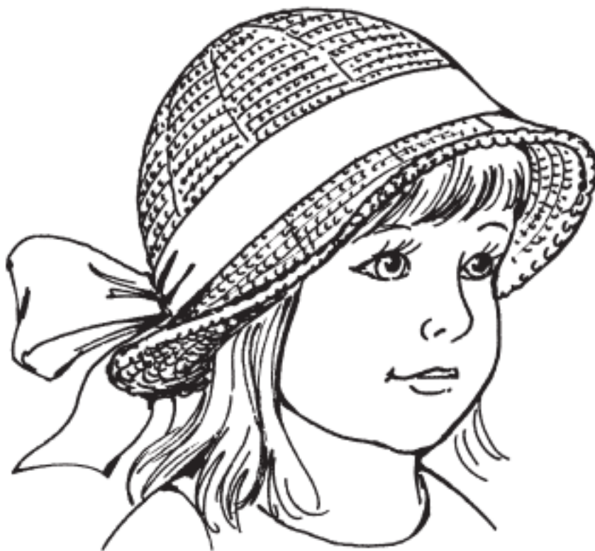
Рисунок 6. Шляпка для маленькой леди