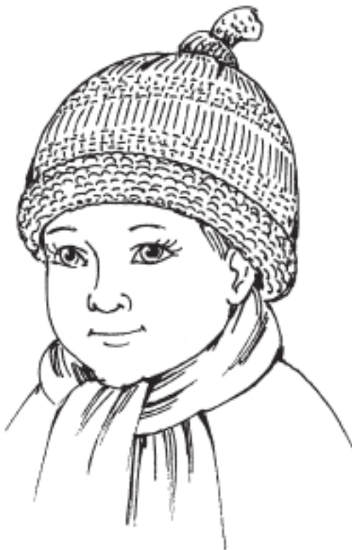
Рисунок 11. Шапочка с «хвостиком» для мальчика

Отворот шапочки подкатать на лицевую сторону, при необходимости закрепить потайными стежками. «Хвостик» на макушке завязать узелком (рис. 11).