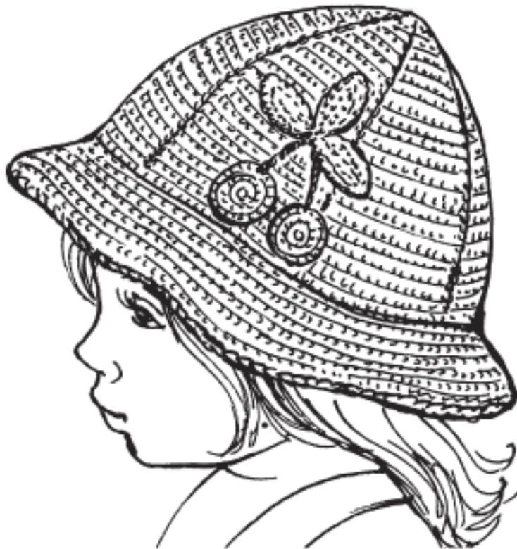
Рисунок 7. Летняя панамы для девочки

Панаму украсить аппликацией, атласными ленточками, вязаными элементами, бусинами или вышивкой (рис. 7).