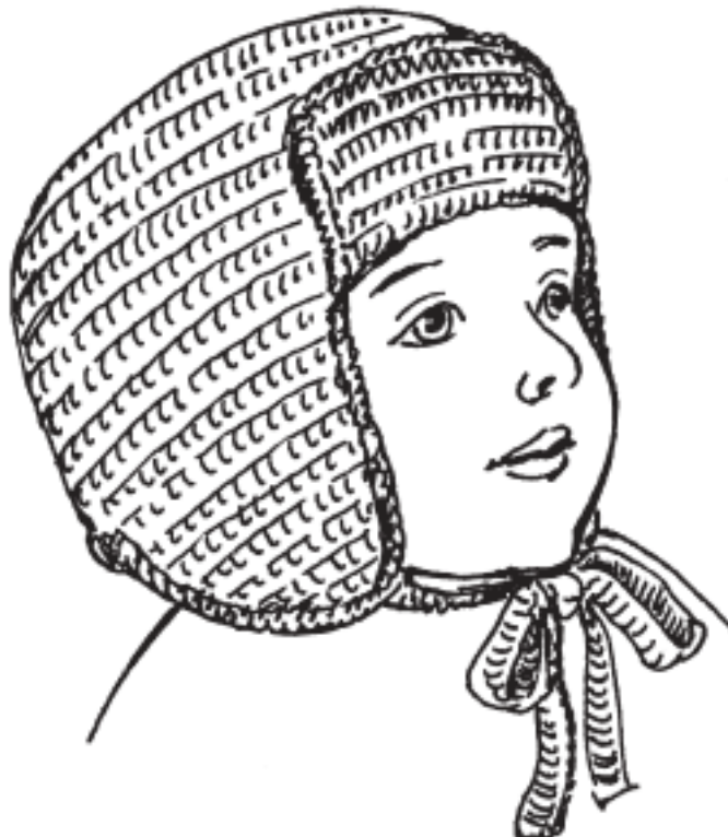
Рисунок 13. Шапка-ушанка

Отвернуть козырек вверх и пришить потайными стежками к основной части шапочки (рис. 13).