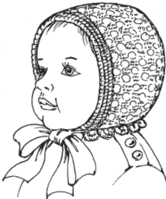
Рисунок 2. Чепчик ажурный для новорожденного

Передний край чепчика обвязать 1 рядом «рачьего шага» (столбики без накида выполнять справа налево) (рис. 2.).