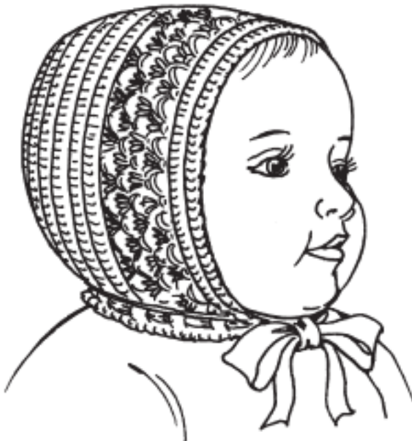
Рисунок 9. Чепчик с ажурной вставкой

Сквозь отверстия нижнего ряда продеть ленточку – набрать цепочку из воздушных петель длиной 40–50 см и обвязать столбиками без накида (рис. 9).