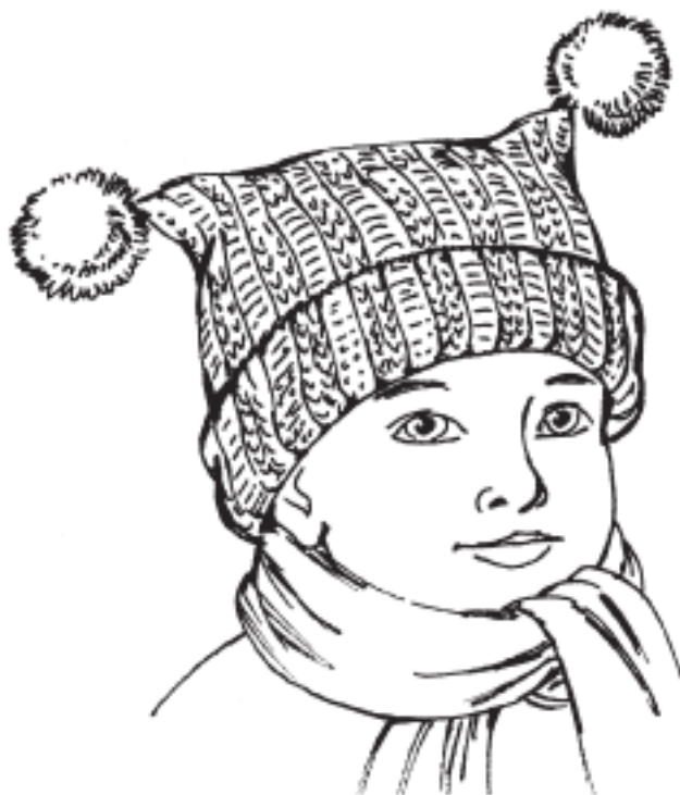
Рисунок 12. Шапочка с «рожками»