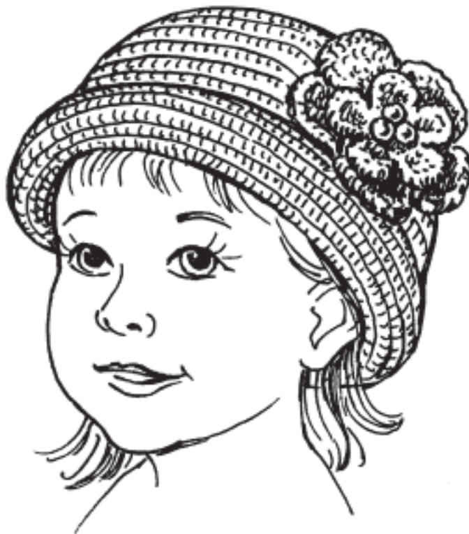
Рисунок 5. Шляпка для маленькой модницы

без накида, затем в следующем ряду в каждую 4-ю петлю выполнять по 2 столбика без накида. Провязать еще 4 ряда без изменений, а в следующем ряду оформить каждые 4-й и 5-й столбики без накида вместе. Поля свернуть валиком и закрепить потайными стежками (рис. 5.)