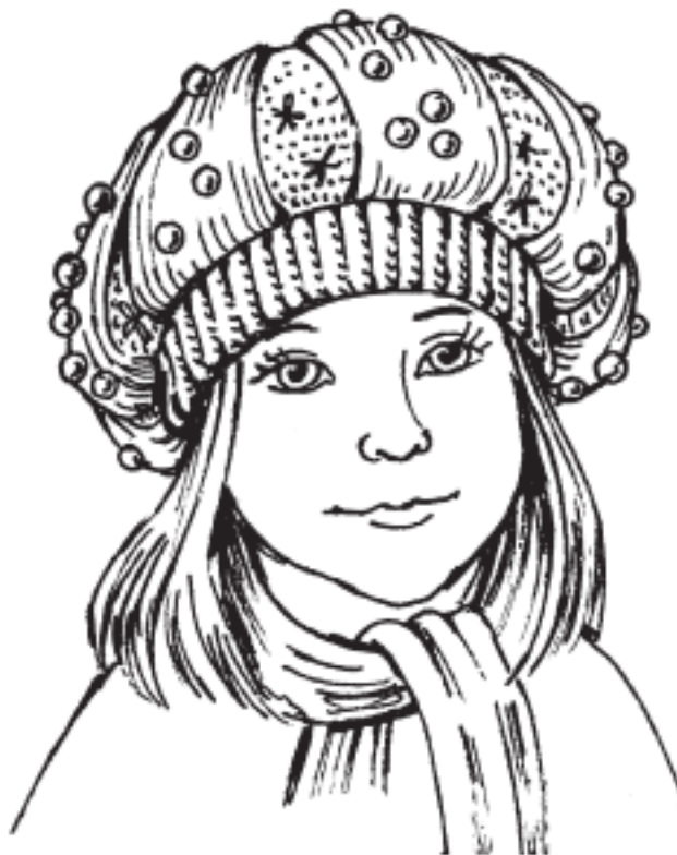
Рисунок 10. Беретик для девочки

Между лепестками берета вышить цветочки, расшить лепестки бусинами, а на макушку пришить декоративный вязаный цветок или помпон (рис. 10).