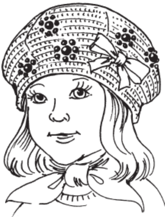
Рисунок 4. Берет универсальный

Для ободка провязать 4–5 рядов столбиками без накида и закончить изделие, провязав 1 ряд «рачьим шагом» (рис. 4.).