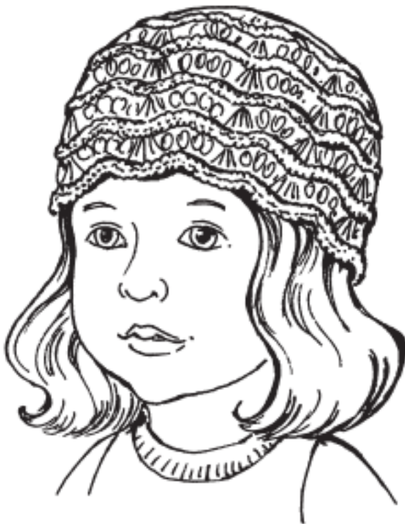
Рисунок 3. Шапочка для малыша

Для формирования донышка шапочки равномерно убавить 7 раз в каждом 2-м ряду по 10 петель. В следующем лицевом ряду провязать по 2 петли вместе и на оставшихся лицевых петлях вязать в высоту 5 см лицевой гладью, а затем стянуть все петли рабочей нитью и выполнить задний шов шапочки (рис. 3.).